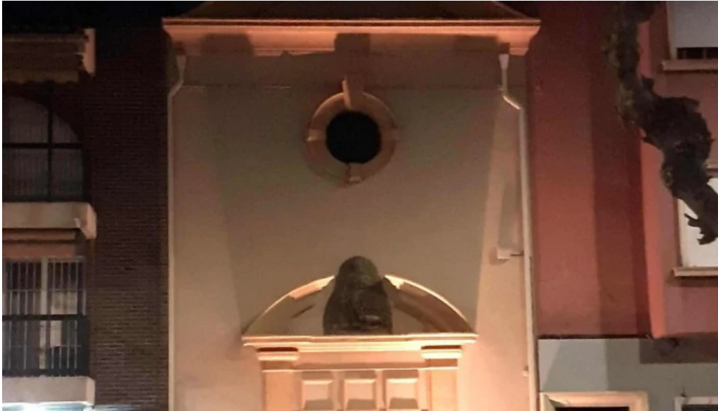
Ermita de san anton comentario 1