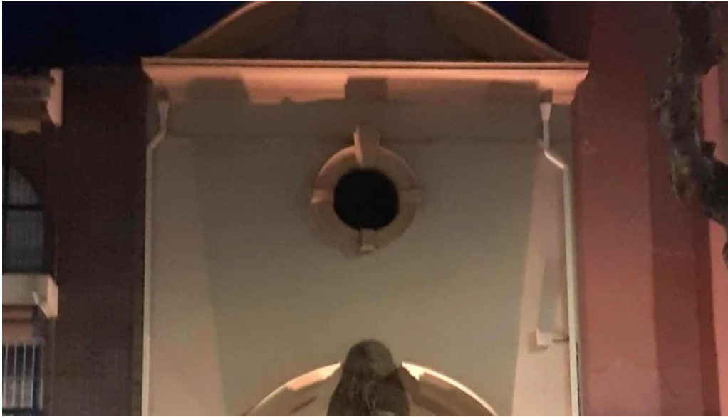
Ermita de san anton comentario 3