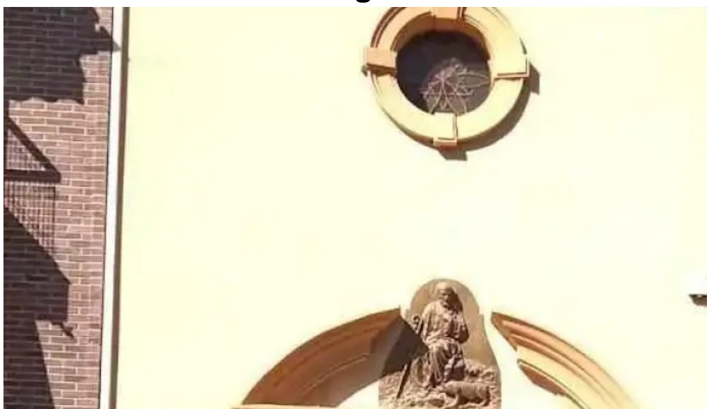
Ermita de san anton murcia