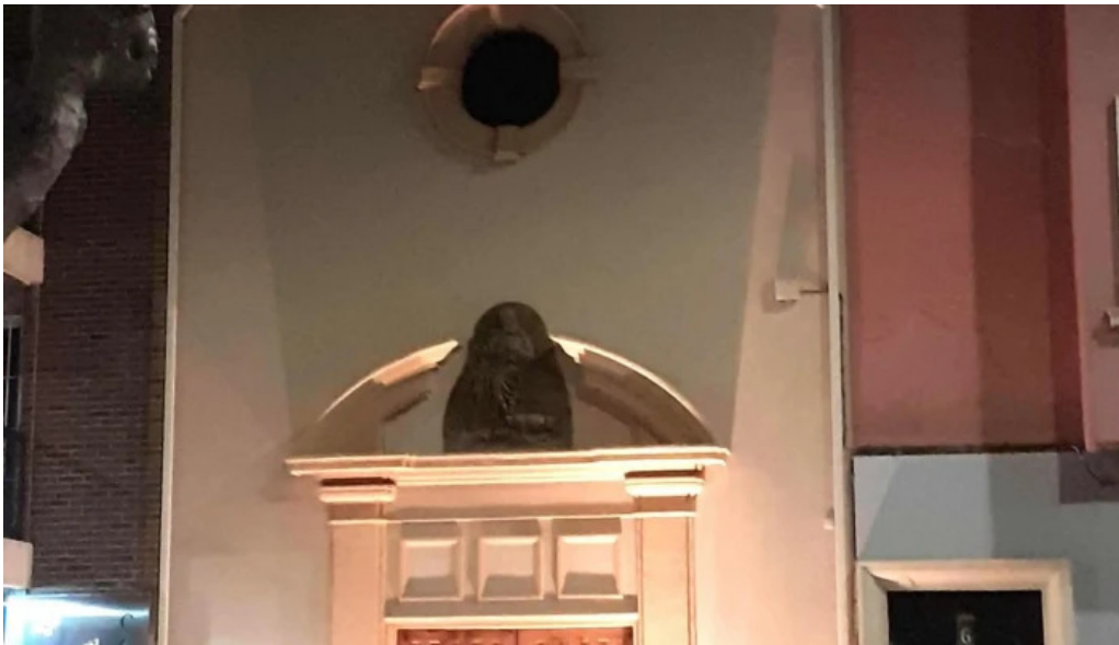
Ermita de san anton comentario 4