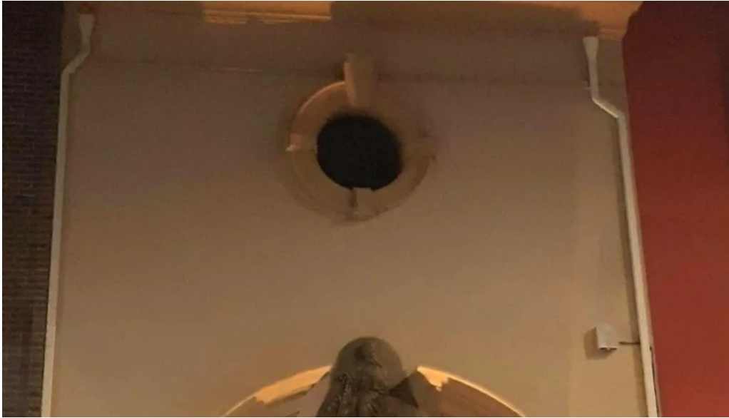
Ermita de san anton iglesia