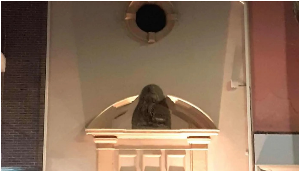
Ermita de san anton comentario 2