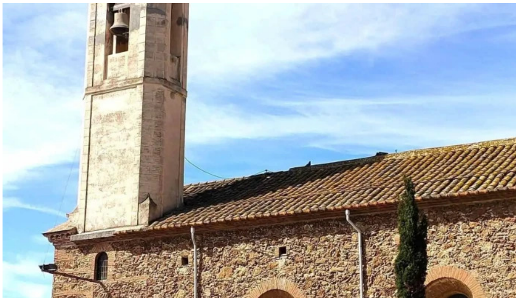
Sant joan de montgat iglesia