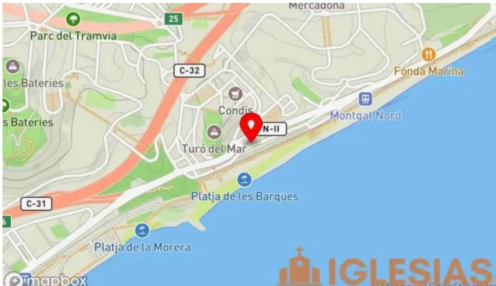
Sant joan de montgat mapa