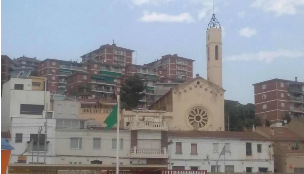
Sant joan de montgat numero