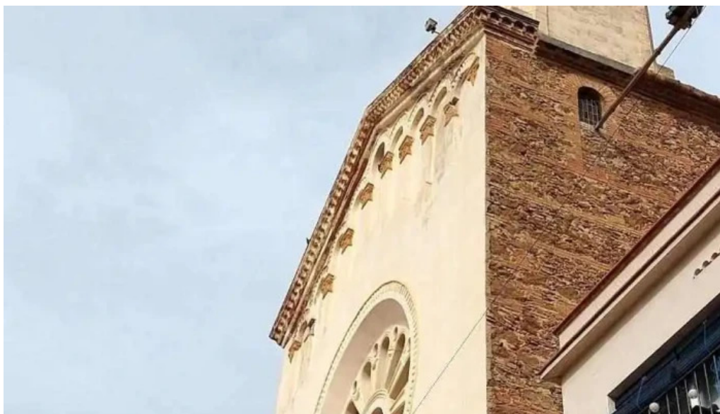
Sant joan de montgat iglesia catolica