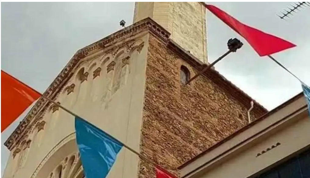
Sant joan de montgat videos