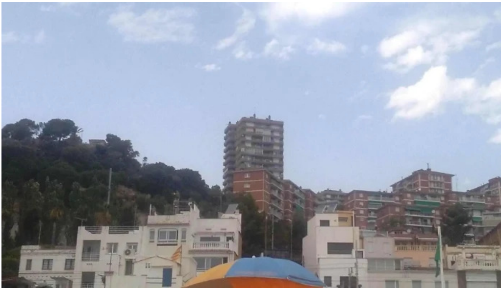
Sant joan de montgat montgat