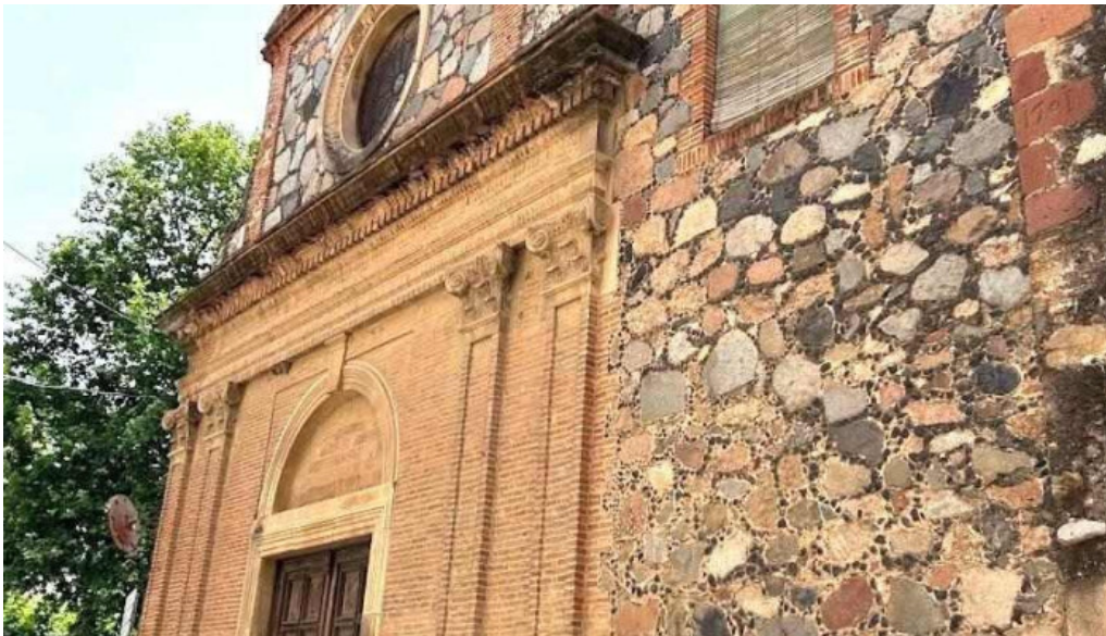
Mare de deu del carmen montbrijo del camp