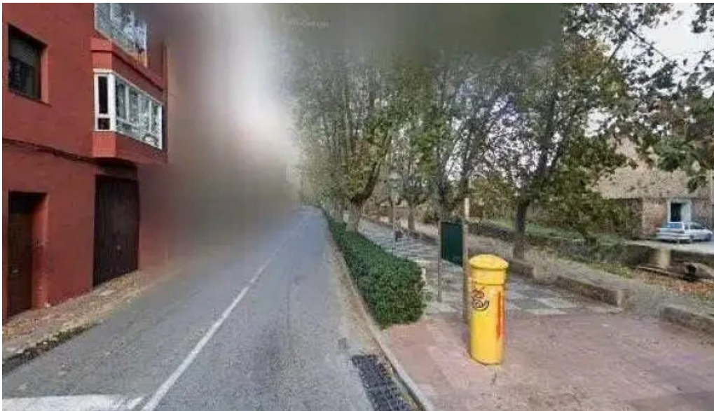
Mare de deu del carmen instagram