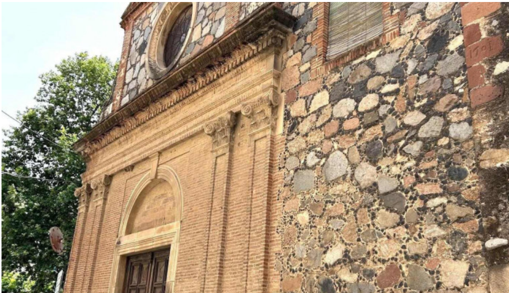
Mare de deu del carmen iglesia catolica