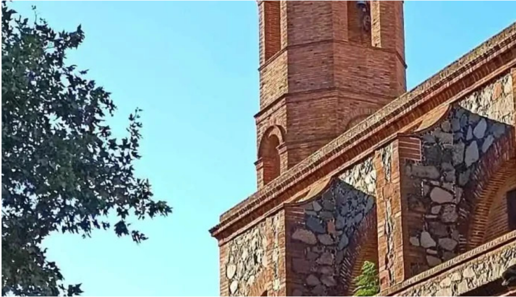
Mare de deu del carmen iglesia