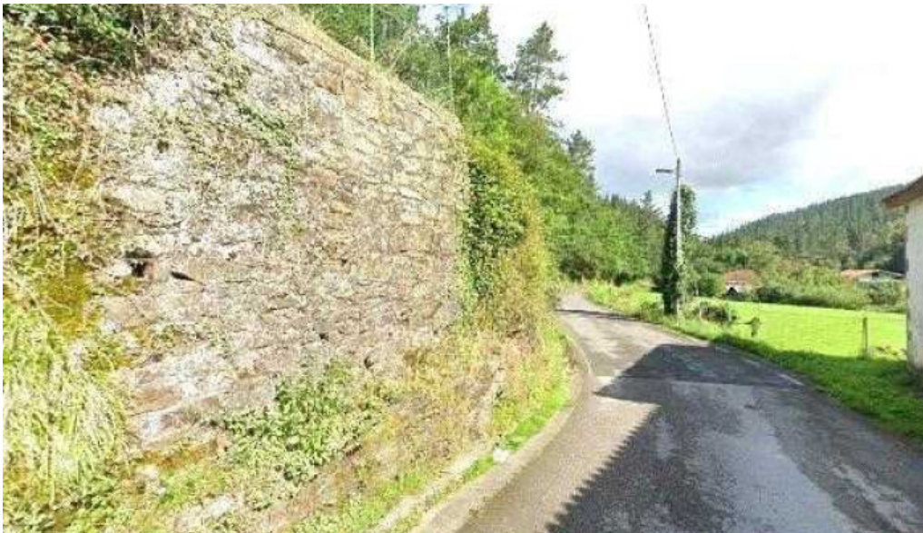
Iglesia de san pablo y san pedro numero