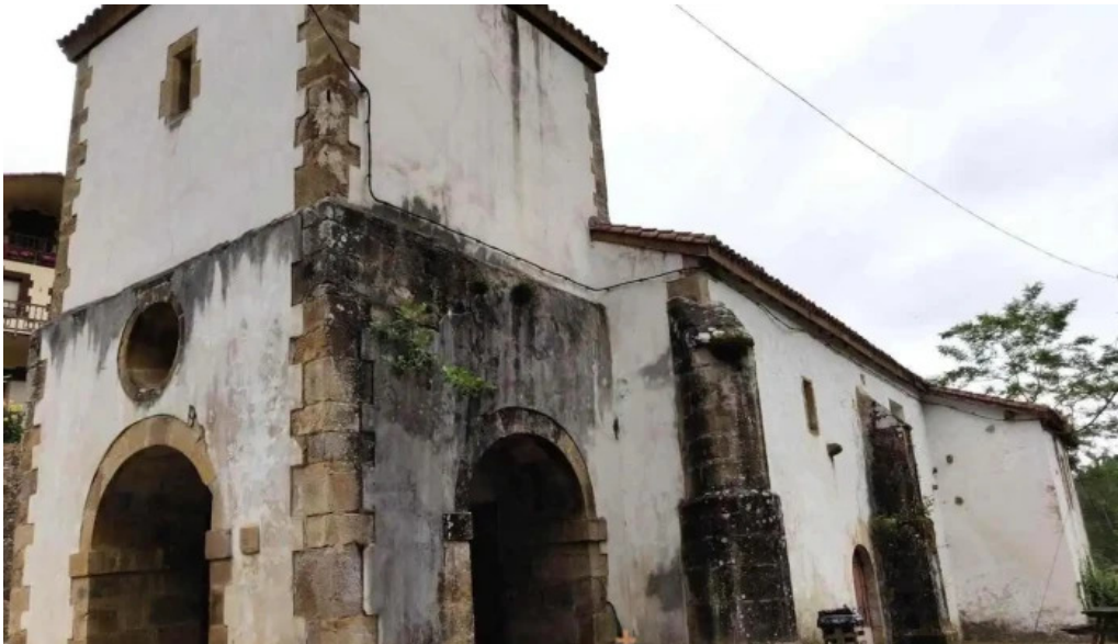
Iglesia de san pablo y san pedro mollinedo