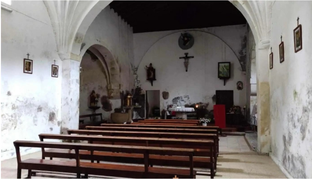
Iglesia de san pablo y san pedro iglesia