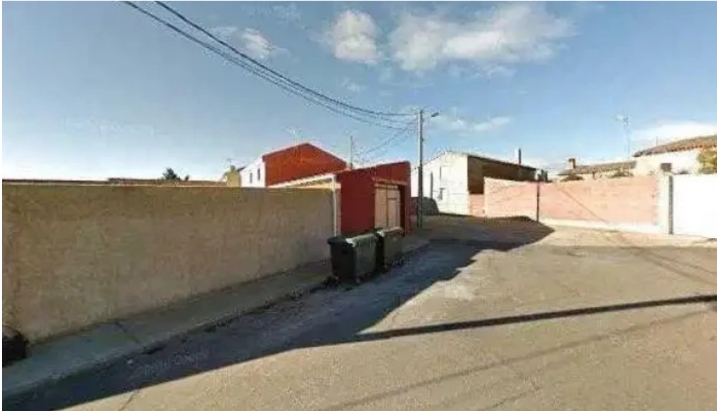
Iglesia de milles de la polvorosa iglesia catolica