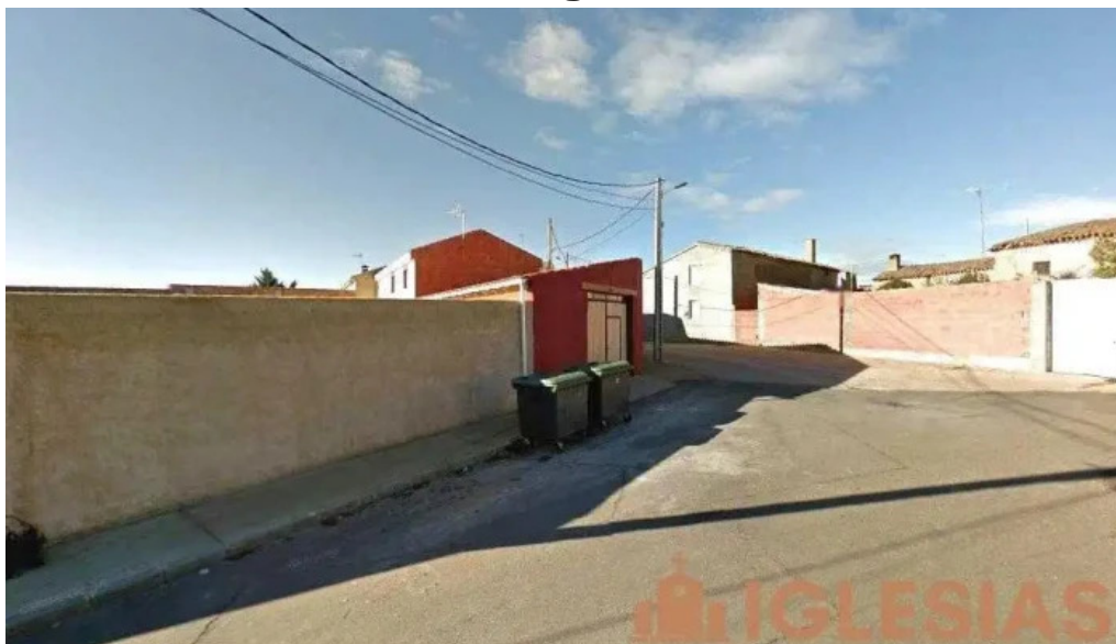
Iglesia de milles de la polvorosa milles de la polvorosa