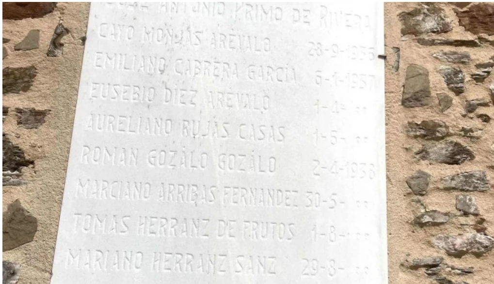
Iglesia de nuestra senora de la asuncion donde