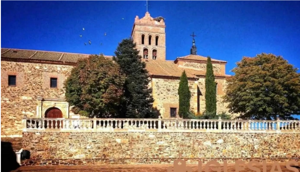
Iglesia de nuestra senora de la asuncion iglesia