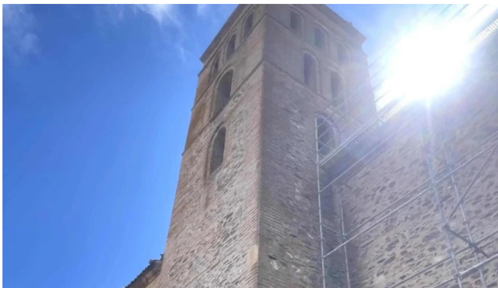
Iglesia de nuestra senora de la asuncion miguelanez