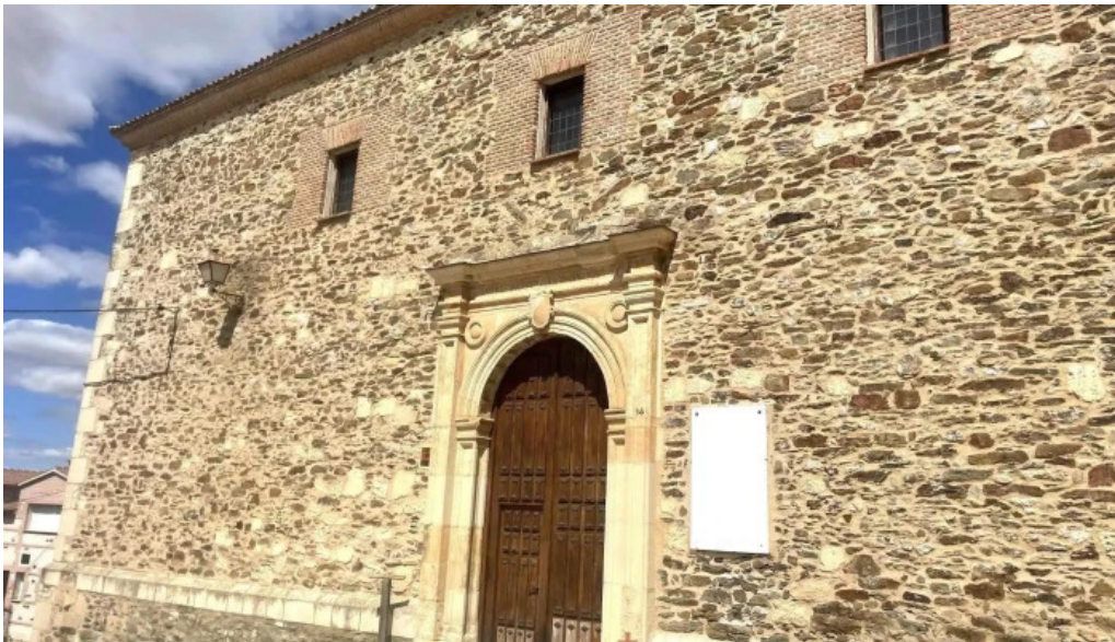
Iglesia de nuestra senora de la asuncion iglesia catolica