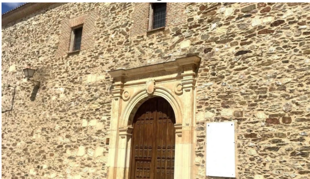
Iglesia de nuestra senora de la asuncion sitio web