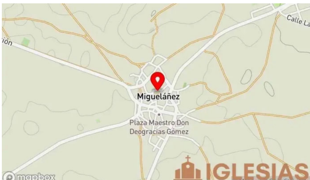
Iglesia de nuestra senora de la asuncion mapa