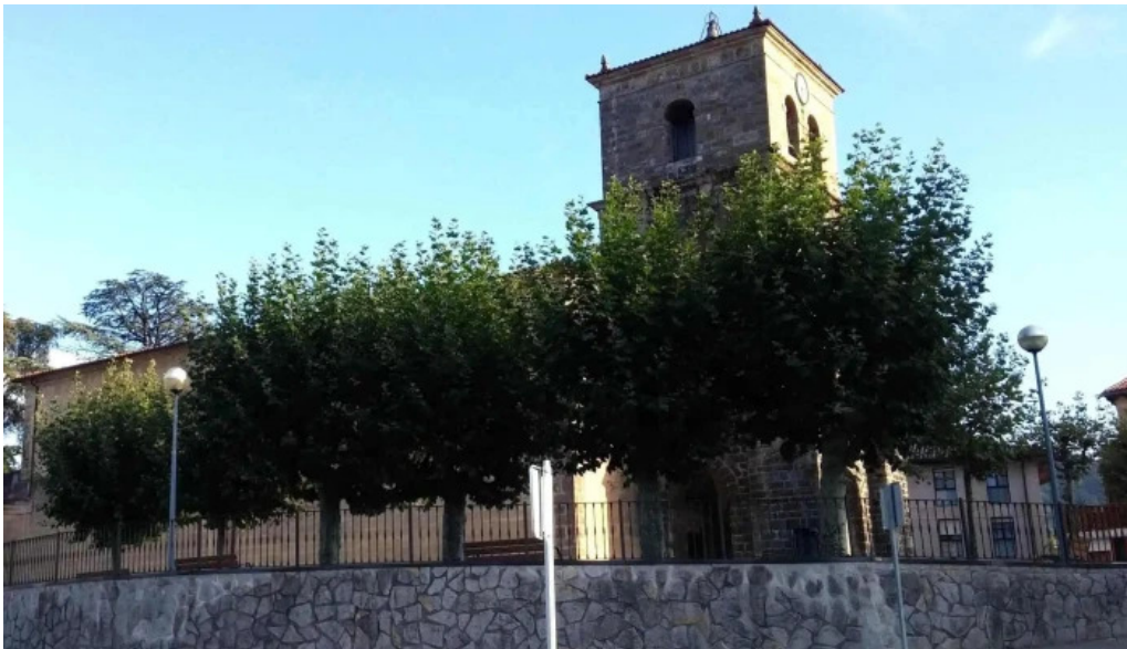
Iglesia de santa maria comentarios