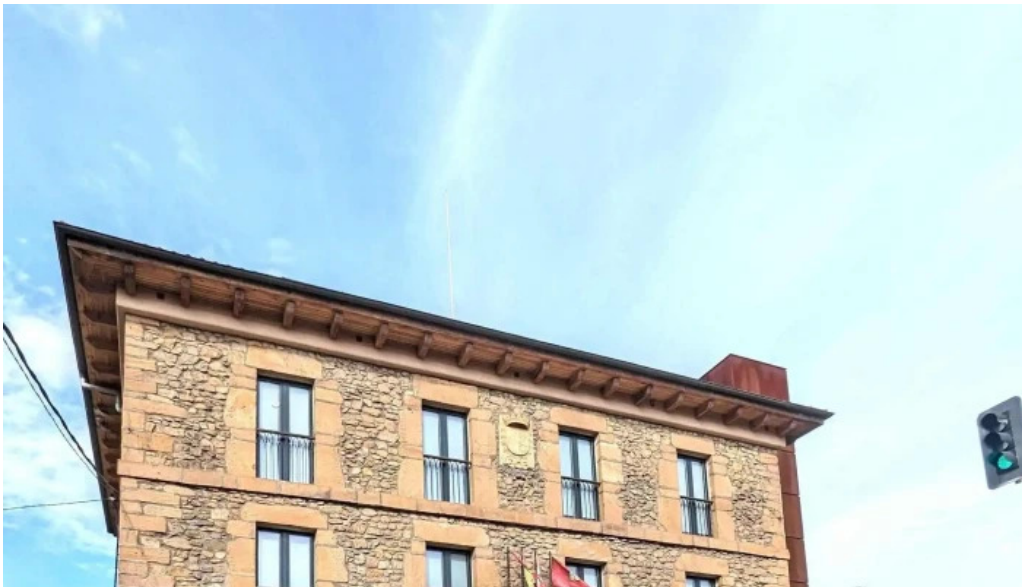
Iglesia de santa maria direccion