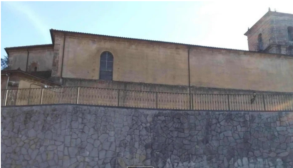
Iglesia de santa maria opiniones