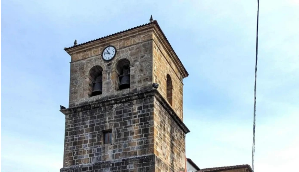
Iglesia de santa maria como llegar