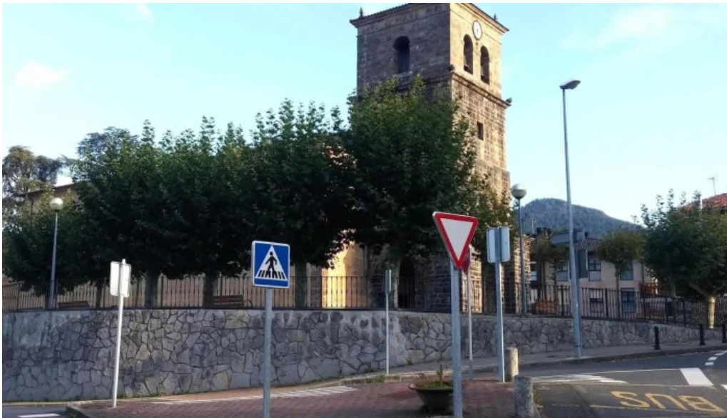
Iglesia de santa maria mercadillo