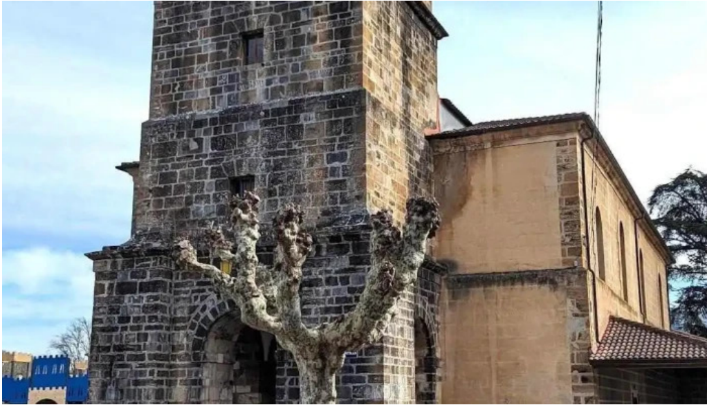
Iglesia de santa maria iglesia catolica