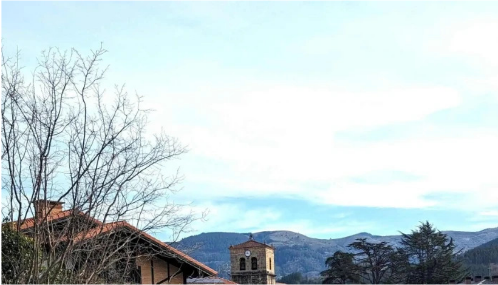
Iglesia de santa maria telefono