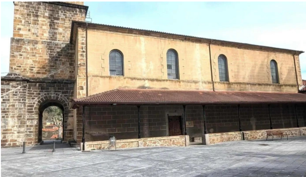
Iglesia de santa maria zona