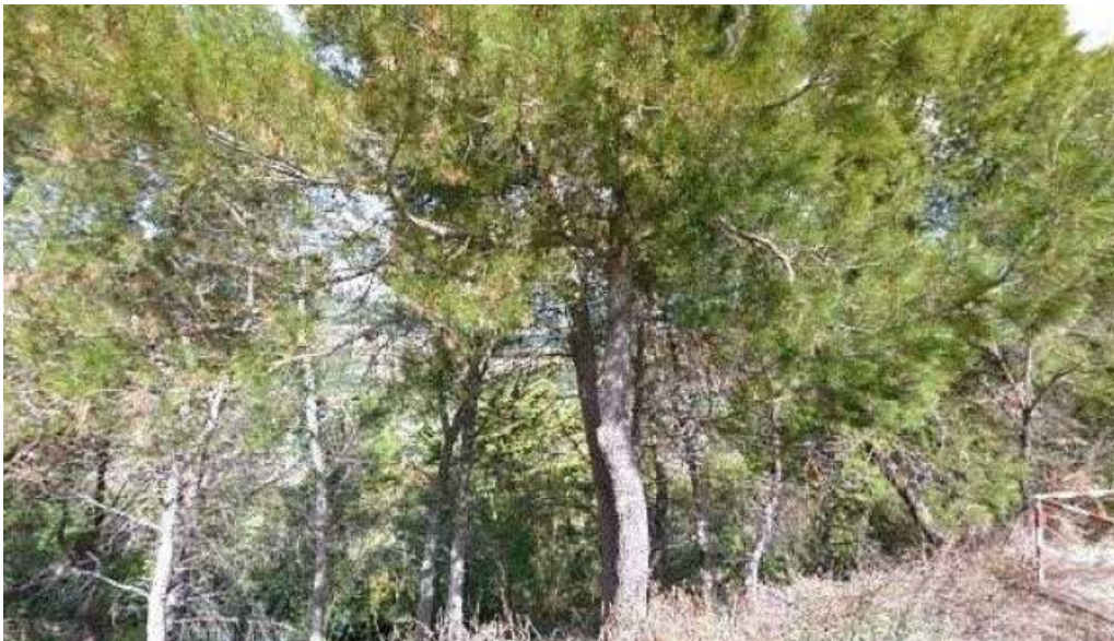
Iglesia de santa maria cerca de mi