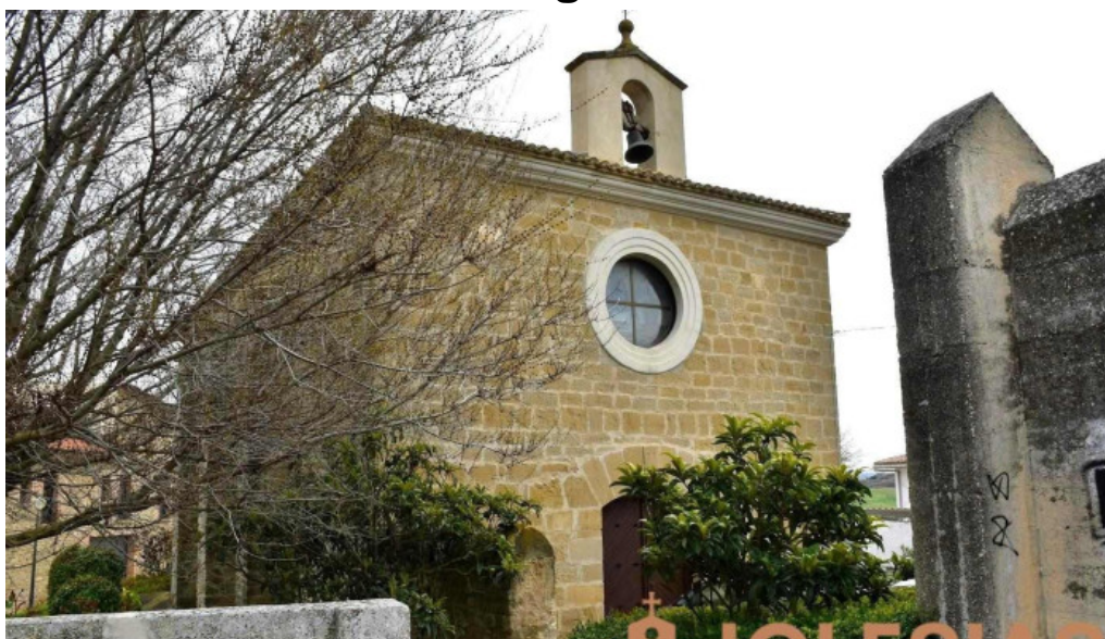
Iglesia de santa maria mendigorria