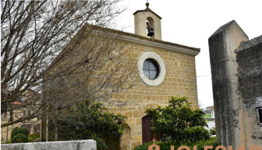
Iglesia de santa maria iglesia catolica