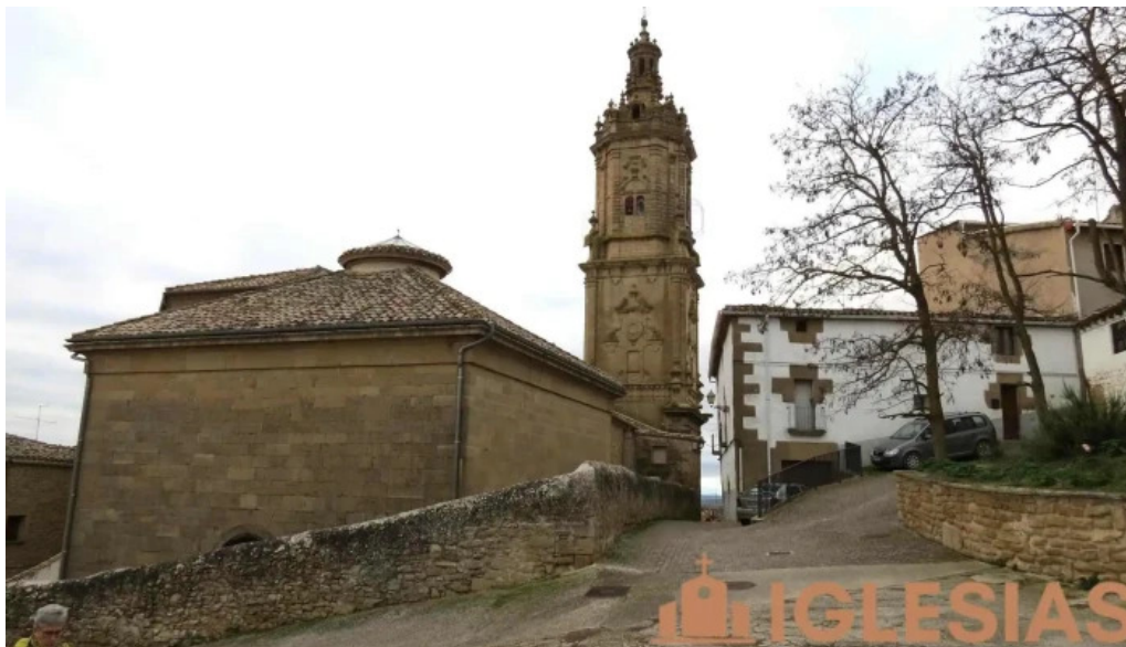
Iglesia de santa maria iglesia