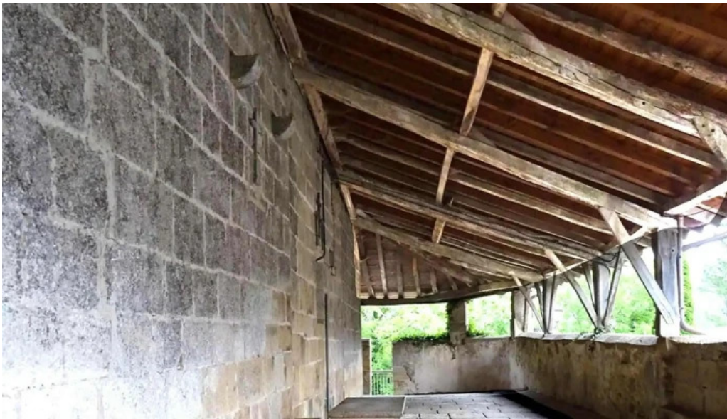
Iglesia de san martin obispo meakaur