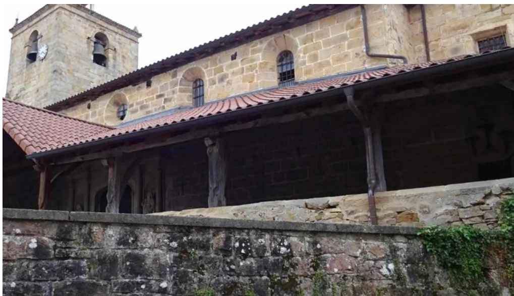
Iglesia de san martin obispo abierto ahora