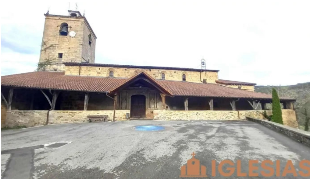
Iglesia de san martin obispo iglesia catolica