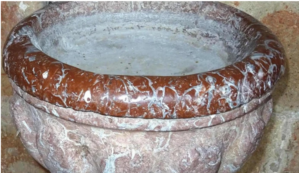
Iglesia de san martin obispo como llegar