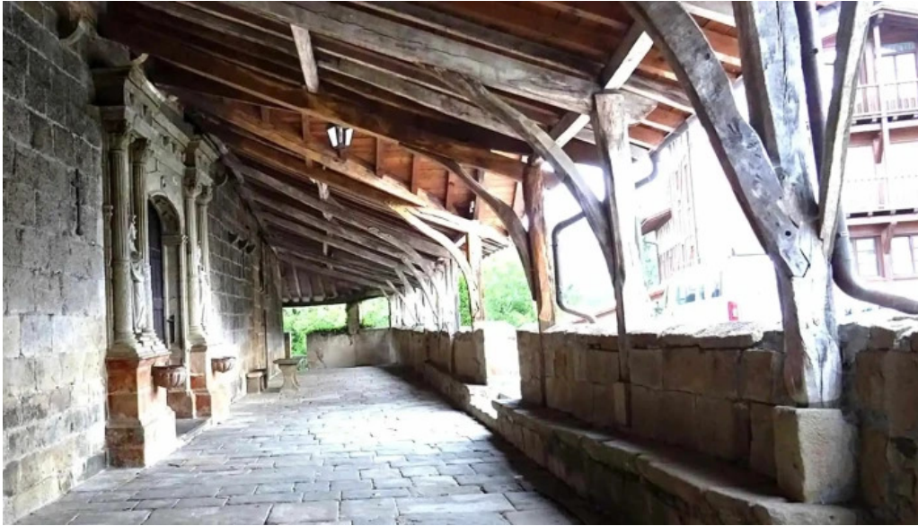
Iglesia de san martin obispo telefono