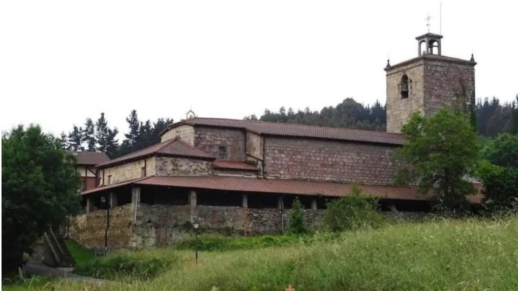
Iglesia de san martin obispo iglesia