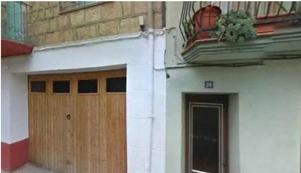
Iglesia de san bartolome como llegar