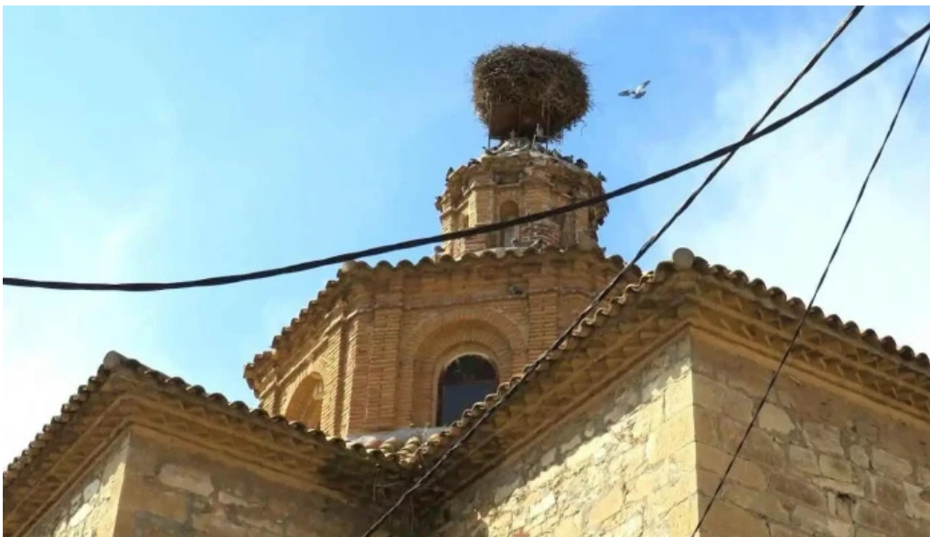
Iglesia de san bartolome massalcoreig