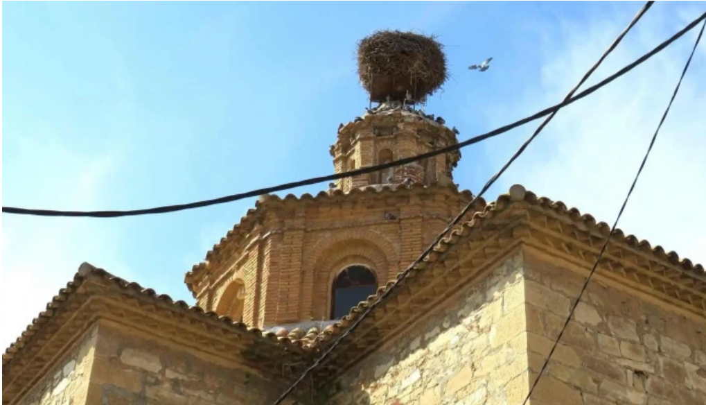
Iglesia de san bartolome iglesia catolica