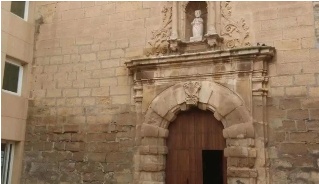
Iglesia de san bartolome iglesia