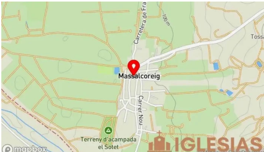
Iglesia de san bartolome mapa