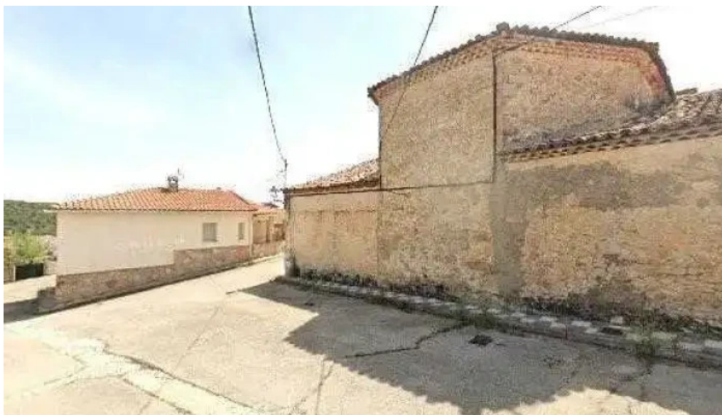
Iglesia de santa ana iglesia catolica