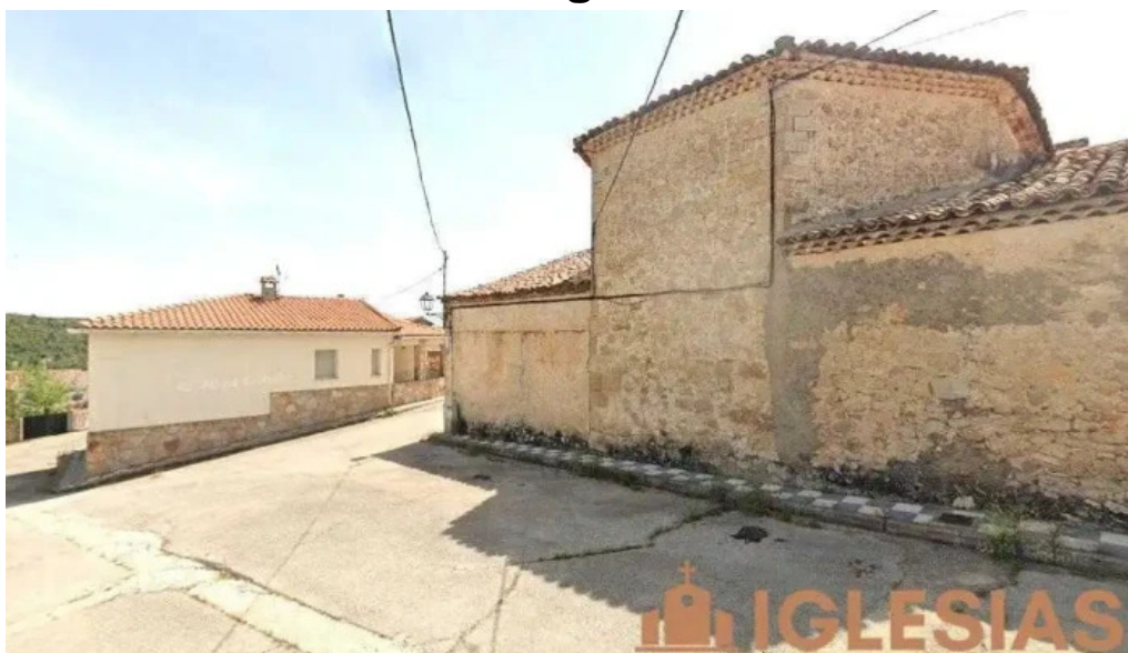
Iglesia de santa ana masegosa