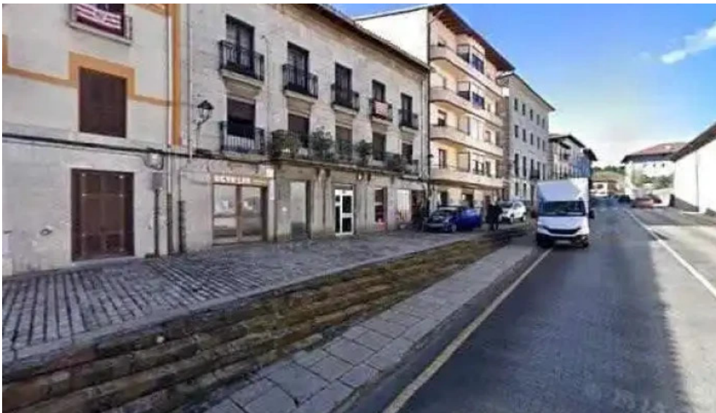
Iglesia de nuestra senora del carmen precios