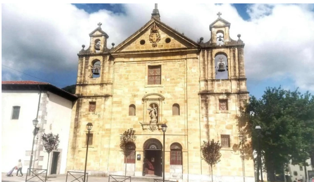
Iglesia de nuestra senora del carmen iglesia catolica