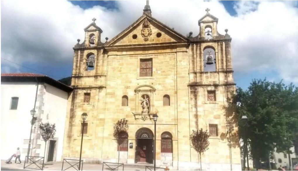
Iglesia de nuestra senora del carmen markina xemein