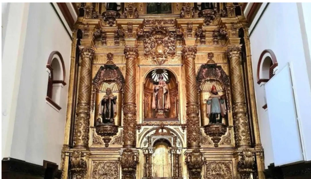
Iglesia de nuestra senora del carmen iglesia