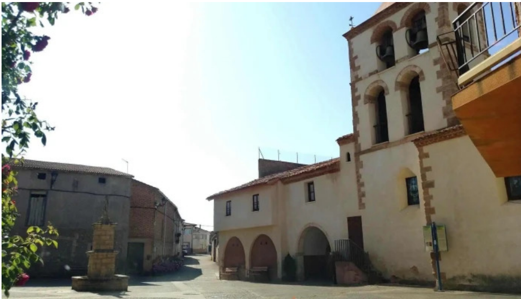
Iglesia de la asuncion manzanares de rioja iglesia