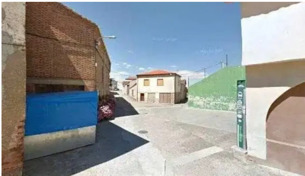
Iglesia de la asuncion manzanares de rioja telefono