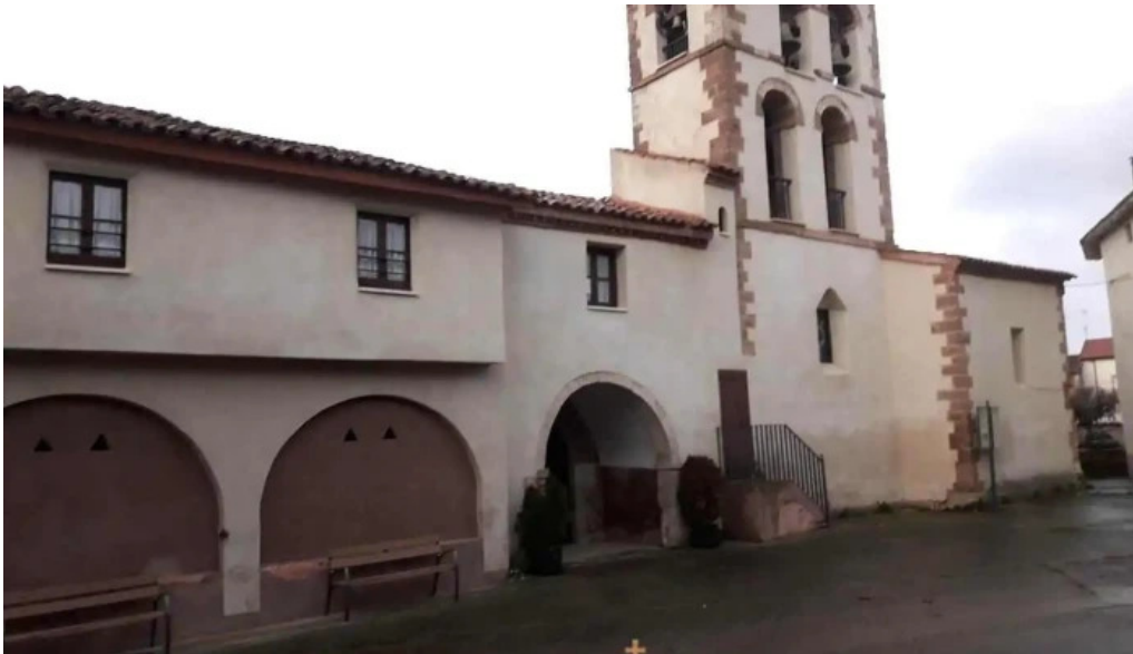
Iglesia de la asuncion manzanares de rioja manzanares de rioja