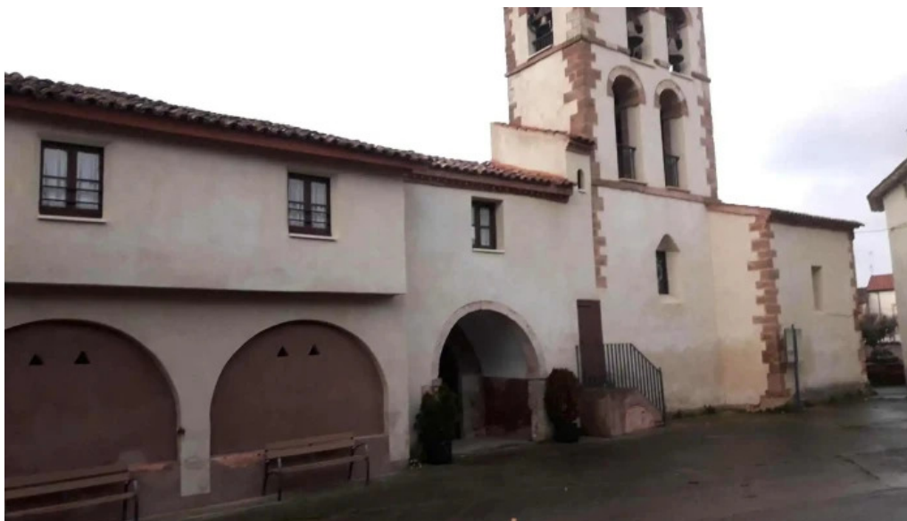
Iglesia de la asuncion manzanares de rioja iglesia catolica