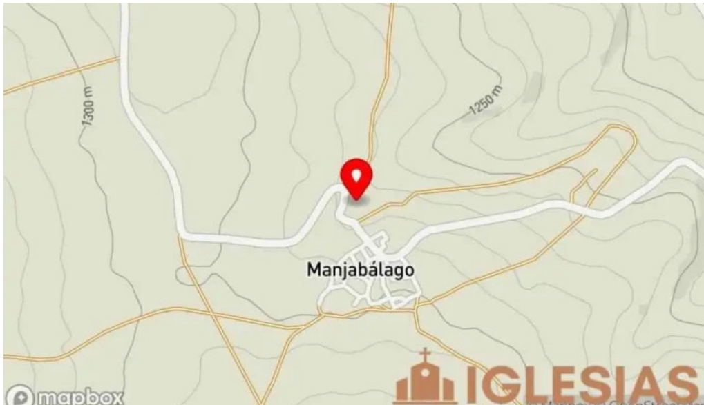
Iglesia de san miguel mapa