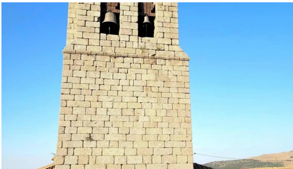
Iglesia de san miguel iglesia catolica