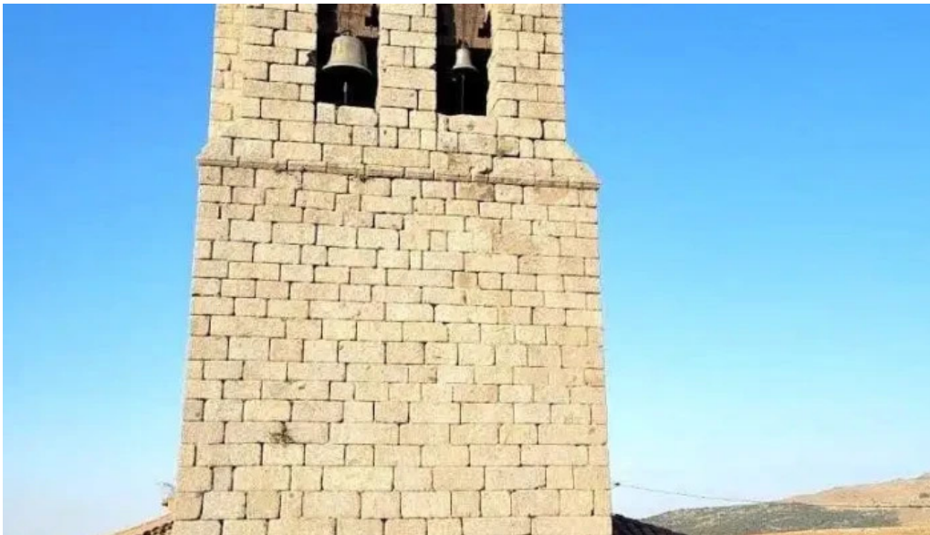
Iglesia de san miguel manjabalago