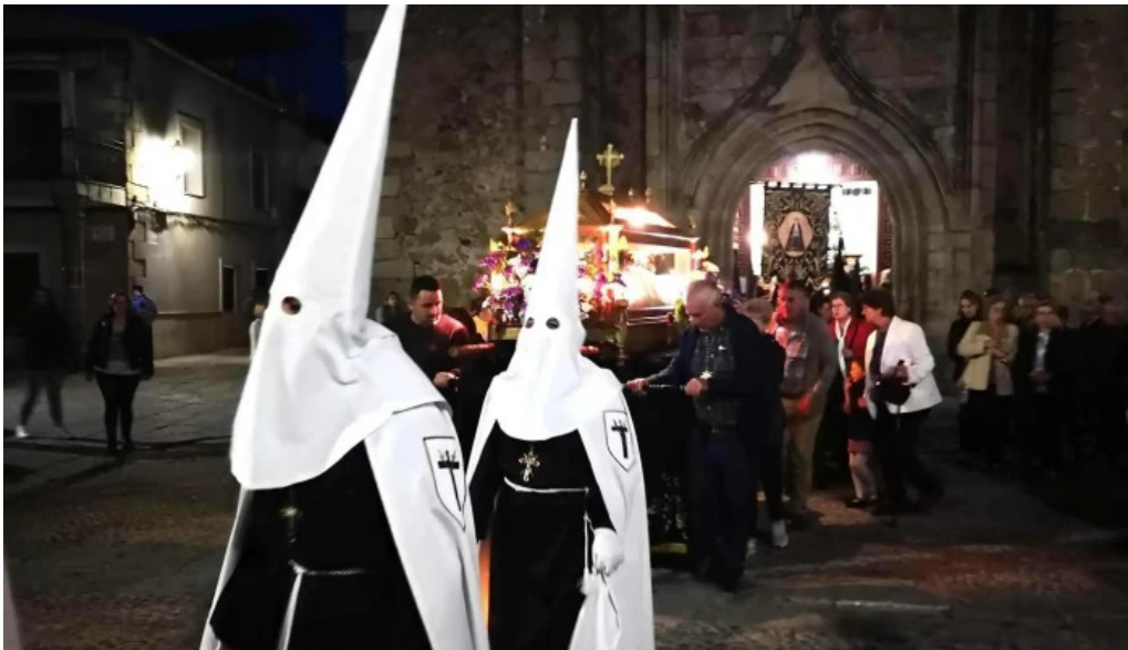
Iglesia de santiago apostol losar de la vera