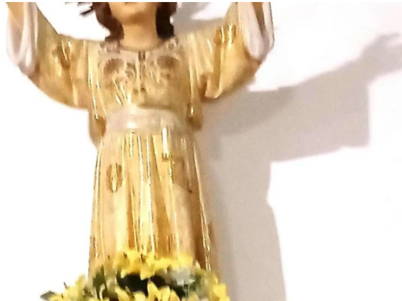
Iglesia de santiago apostol horario