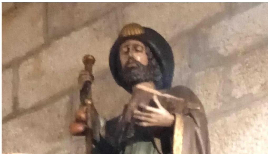
Iglesia de santiago apostol puntaje