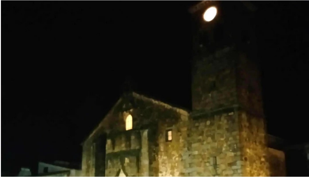
Iglesia de santiago apostol opiniones