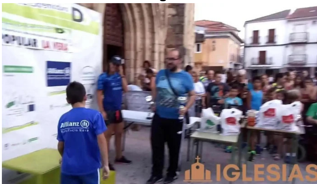
Iglesia de santiago apostol videos