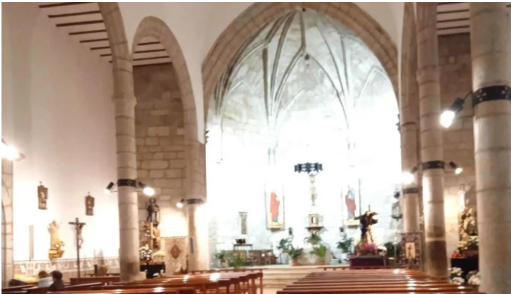
Iglesia de santiago apostol numero