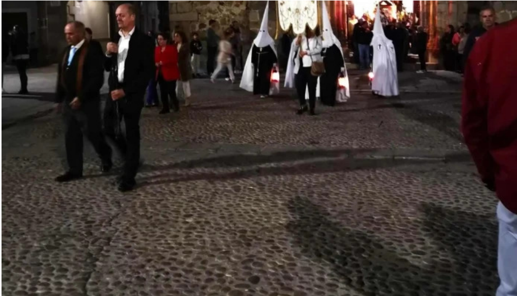
Iglesia de santiago apostol instagram