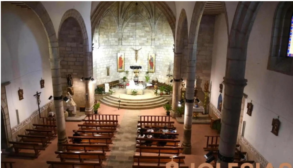
Iglesia de santiago apostol iglesia