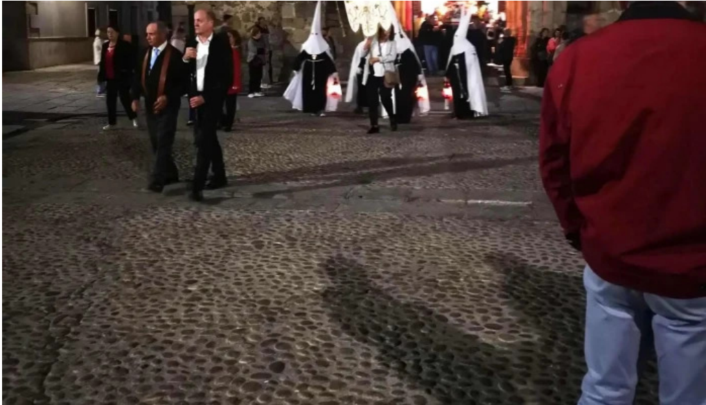
Iglesia de santiago apostol direccion