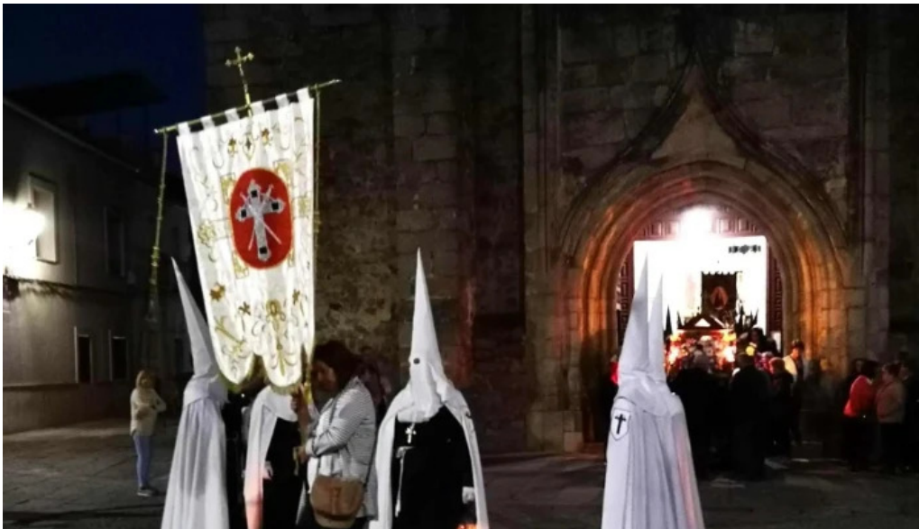
Iglesia de santiago apostol abierto ahora