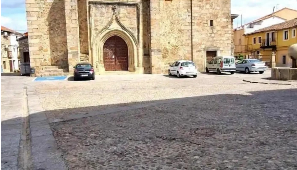
Iglesia de santiago apostol iglesia catolica