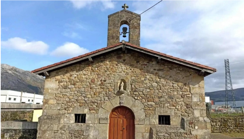
Ermita de la virgen de la rueda iglesia