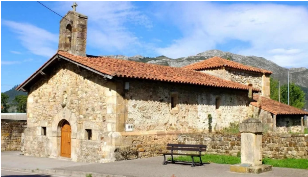
Ermita de la virgen de la rueda iglesia catolica