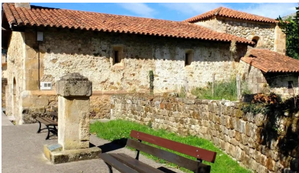
Ermita de la virgen de la rueda numero