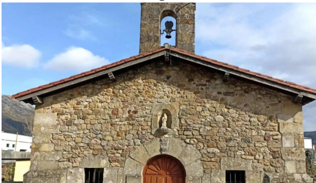
Ermita de la virgen de la rueda ubicacion