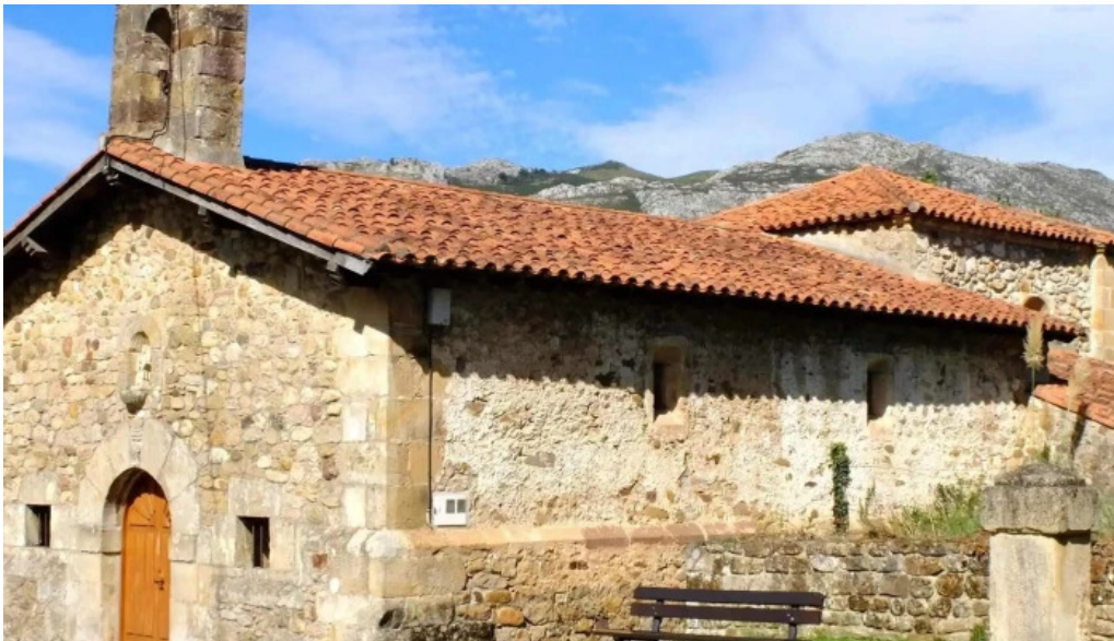
Ermita de la virgen de la rueda los corrales de buelna