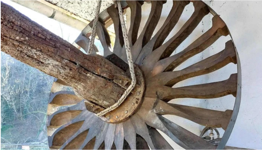
Iglesia santa maria de lloriana loriana