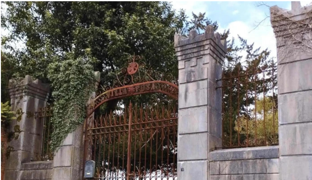
Iglesia santa maria de Lloriana telefono