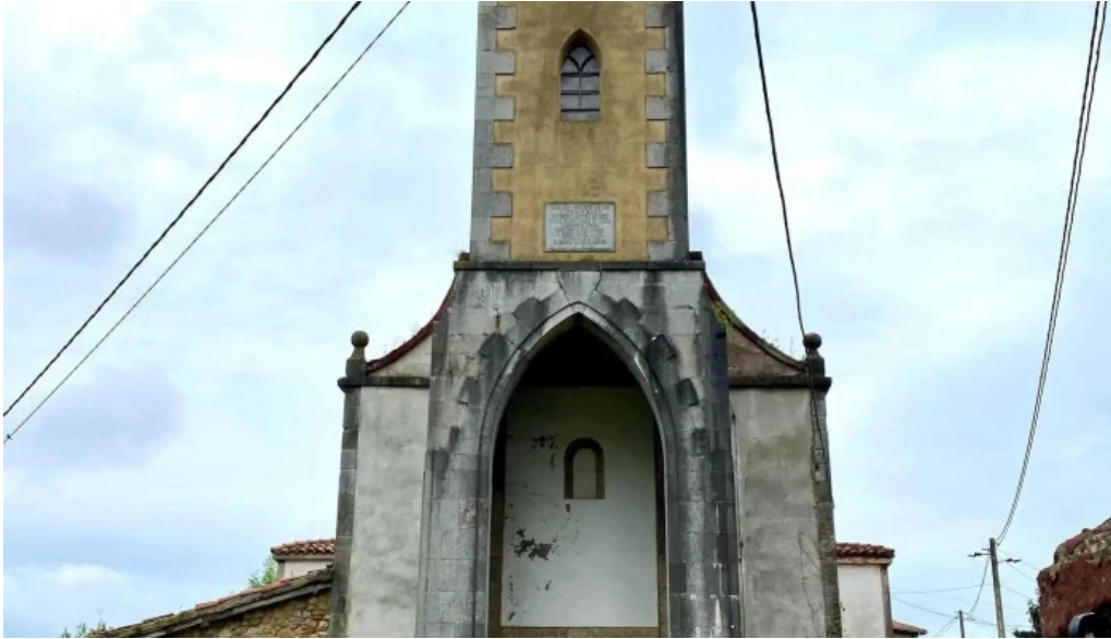
Iglesia santa maria de Lloriana ubicacion