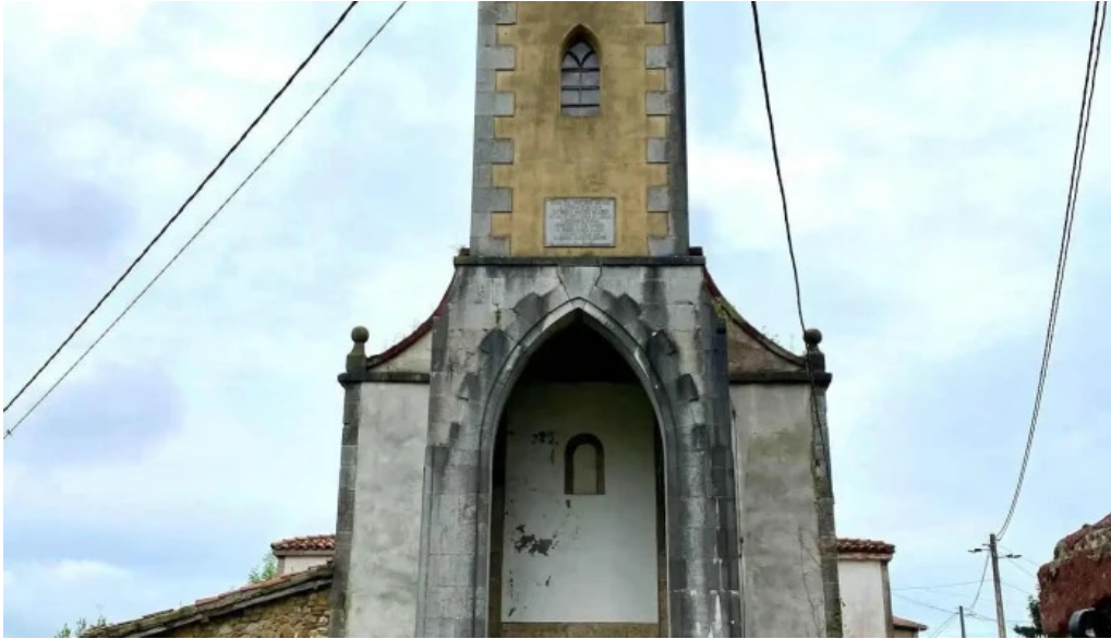
Iglesia santa maria de lloriana iglesia catolica