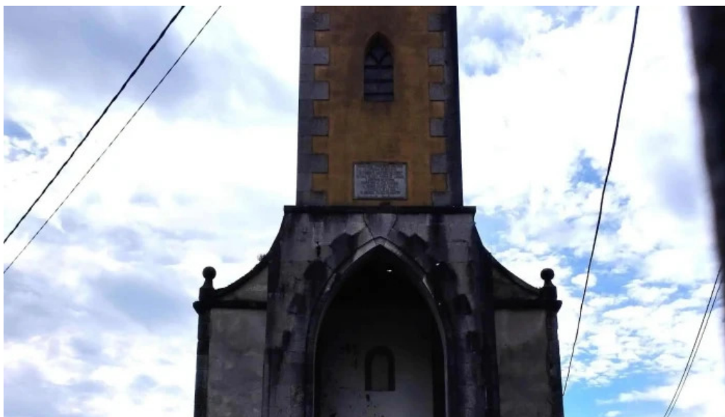
Iglesia santa maria de Iloriana catalogo