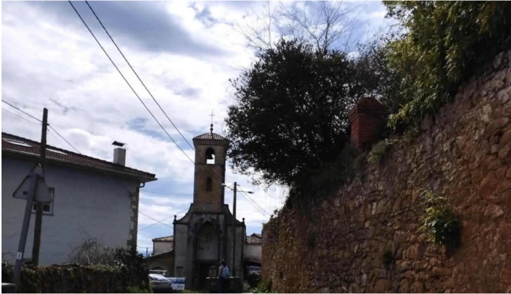
Iglesia santa maria de lloriana numero