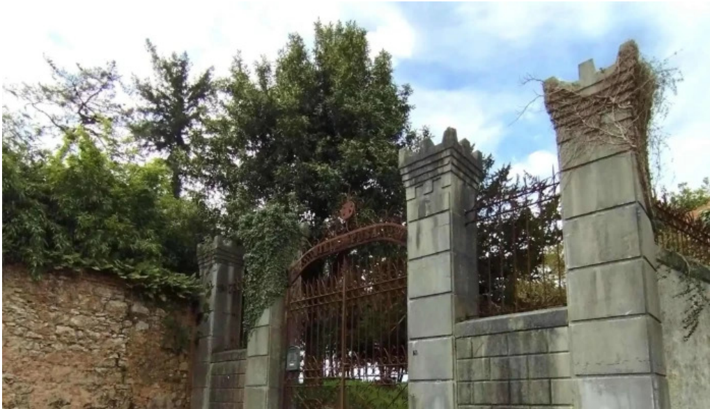
Iglesia santa maria de lloriana horario