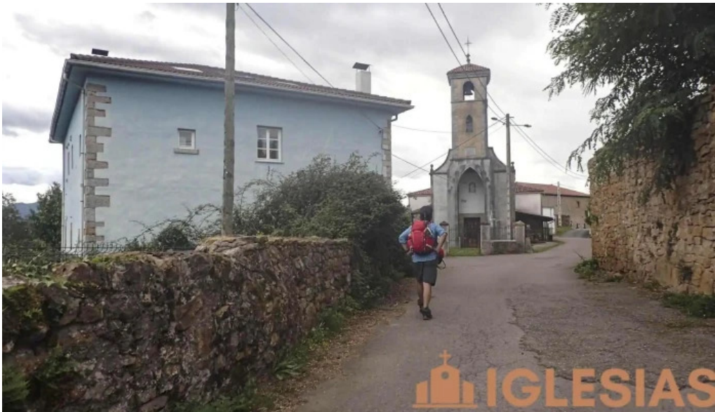
Iglesia santa maria de lloriana iglesia