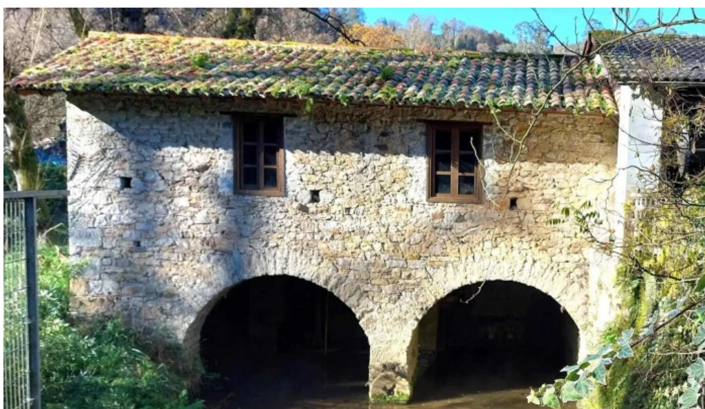
Iglesia santa maria de Iloriana abierto ahora