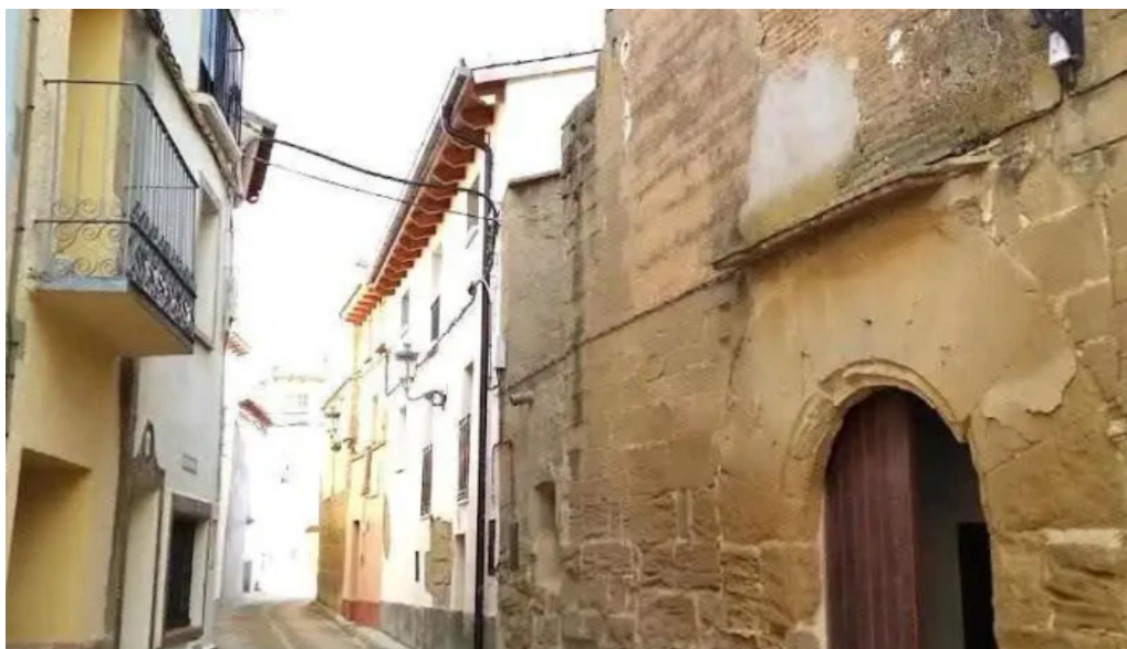
Iglesia parroquial de san salvador loporzano