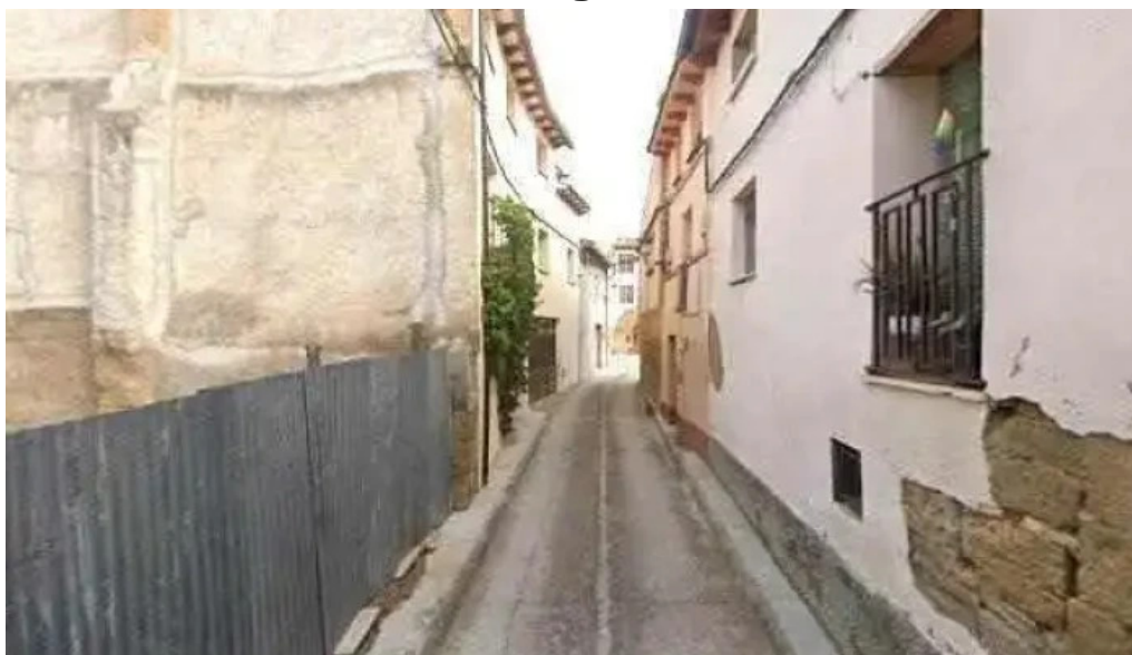
Iglesia parroquial de san salvador sitio web