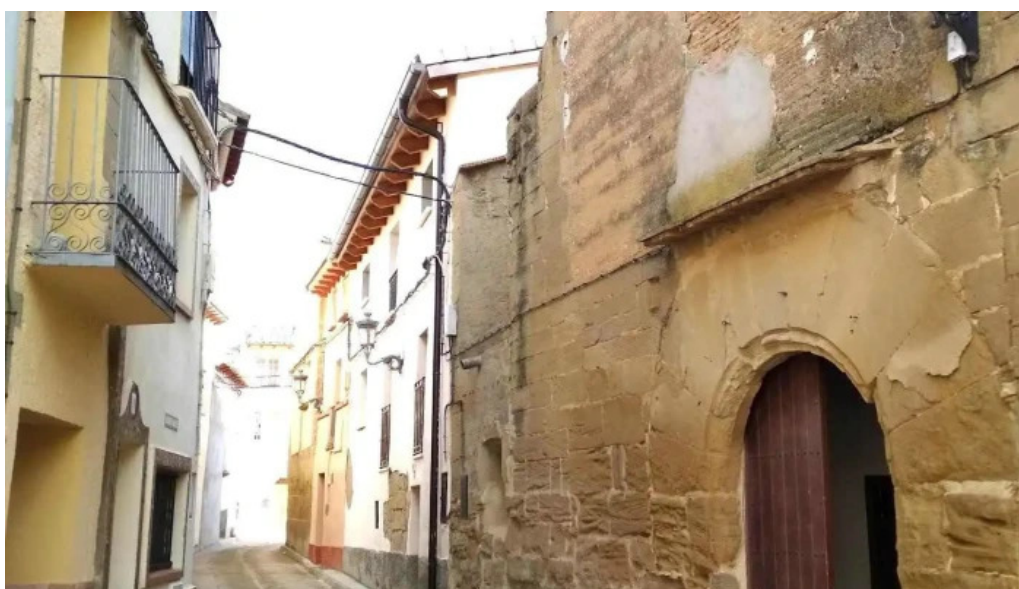
Iglesia parroquial de san salvador iglesia catolica