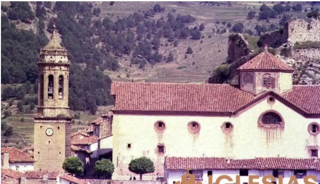
Iglesia de la inmaculada linares de mora iglesia