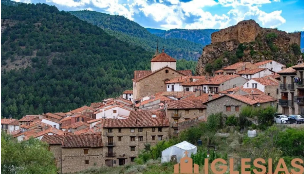
Iglesia de la Inmaculada Linares de Mora Iglesia Católica