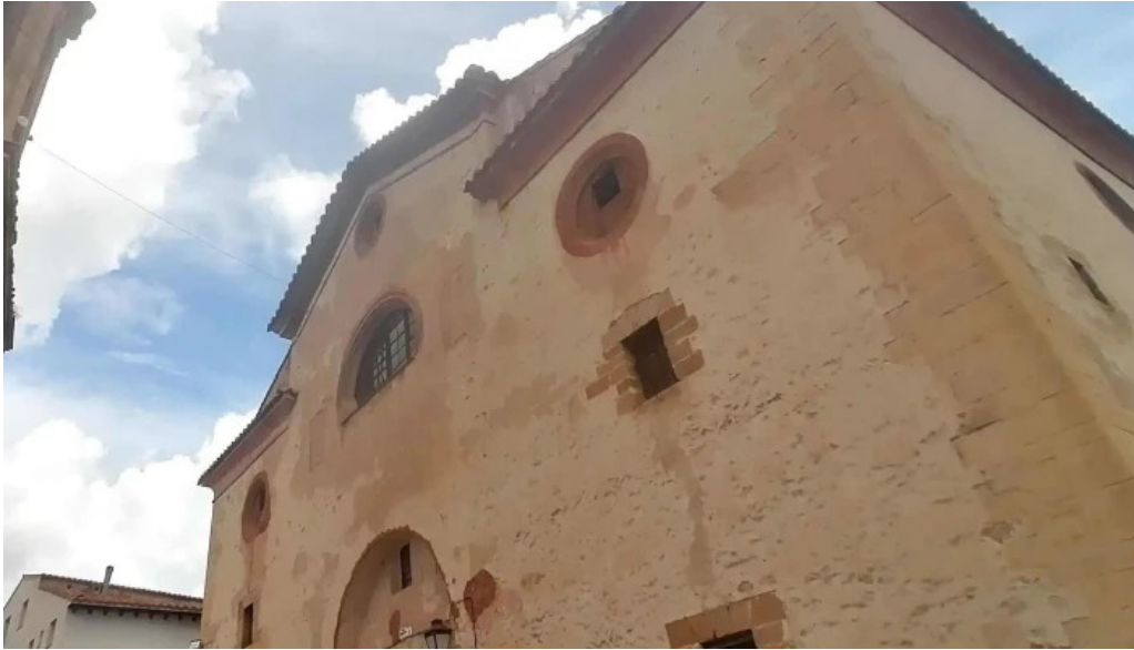
Iglesia de la inmaculada linares de mora zona