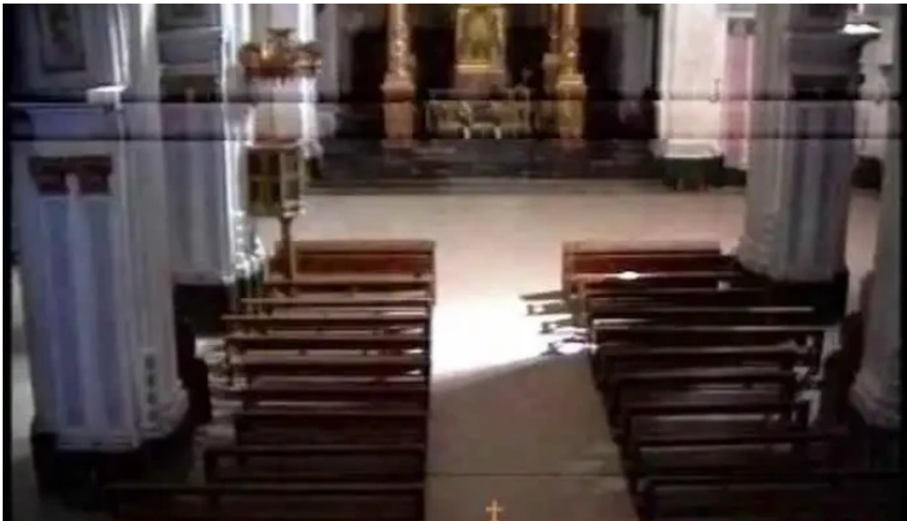
Iglesia de la inmaculada linares de mora videos