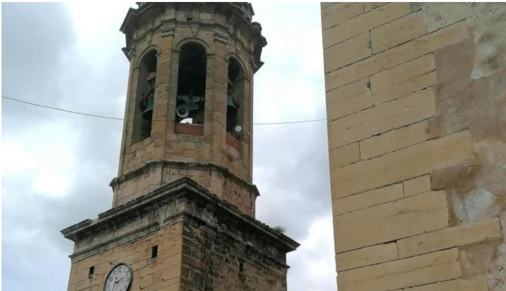
Iglesia de la inmaculada linares de mora linares de mora