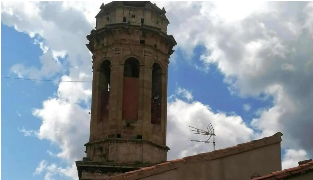
Iglesia de la inmaculada linares de mora instagram