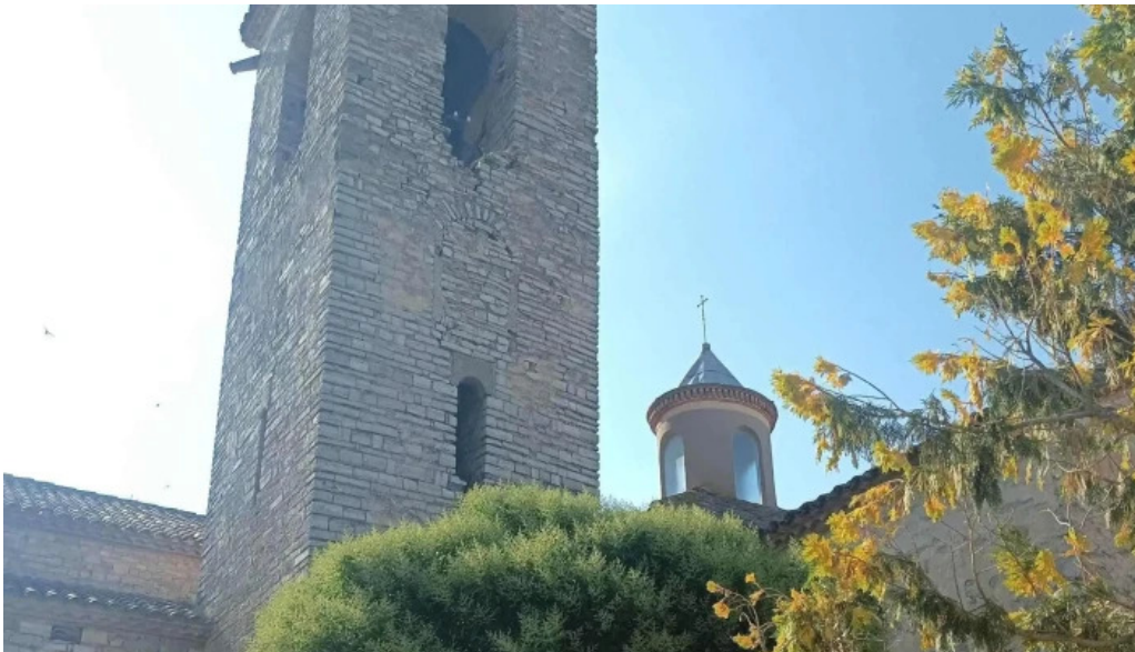
Santa maria de les oluges precios