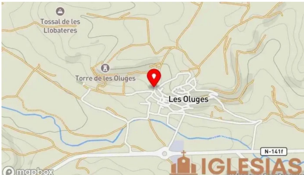
Santa maria de les oluges mapa