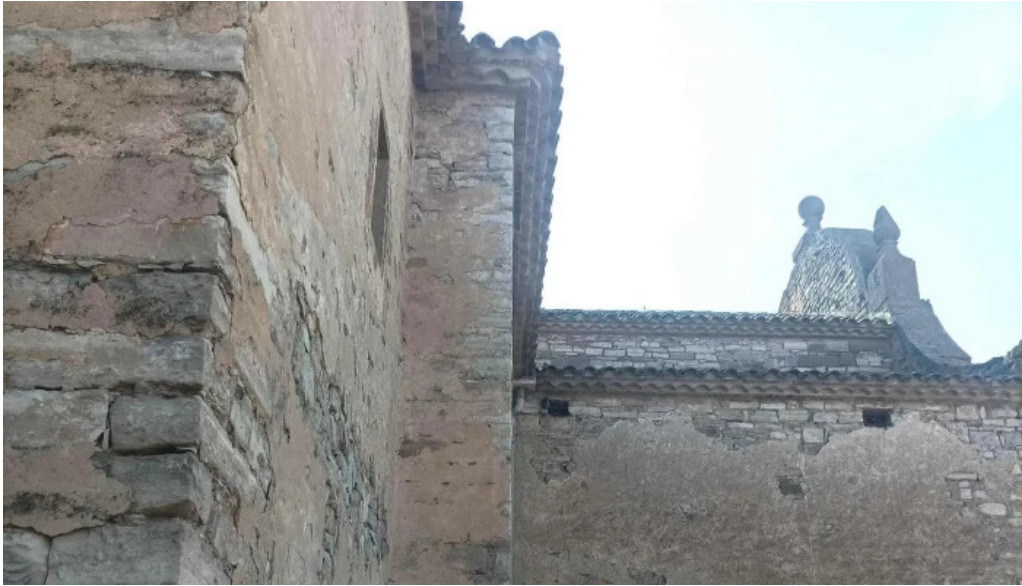
Santa maria de les oluges ubicacion