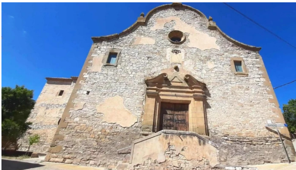
Santa maria de les oluges iglesia catolica