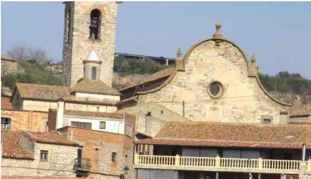
Santa maria de les oluges iglesia