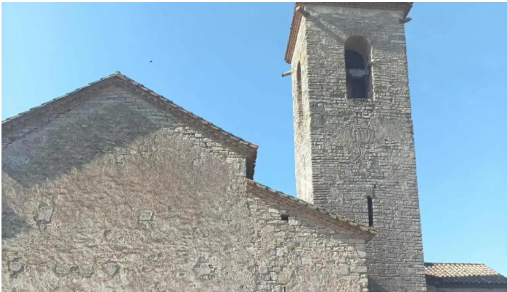
Santa maria de les oluges les oluges