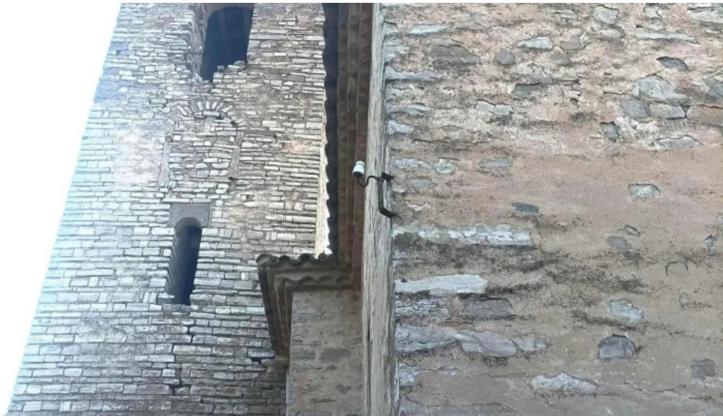
Santa maria de les oluges instagram