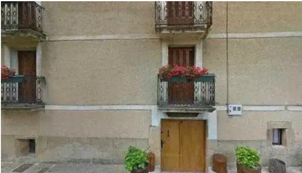
Iglesia de san martin navarra