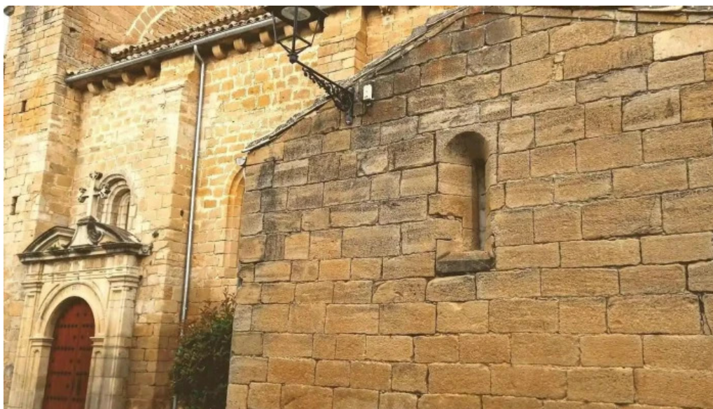
Iglesia de san martin iglesia