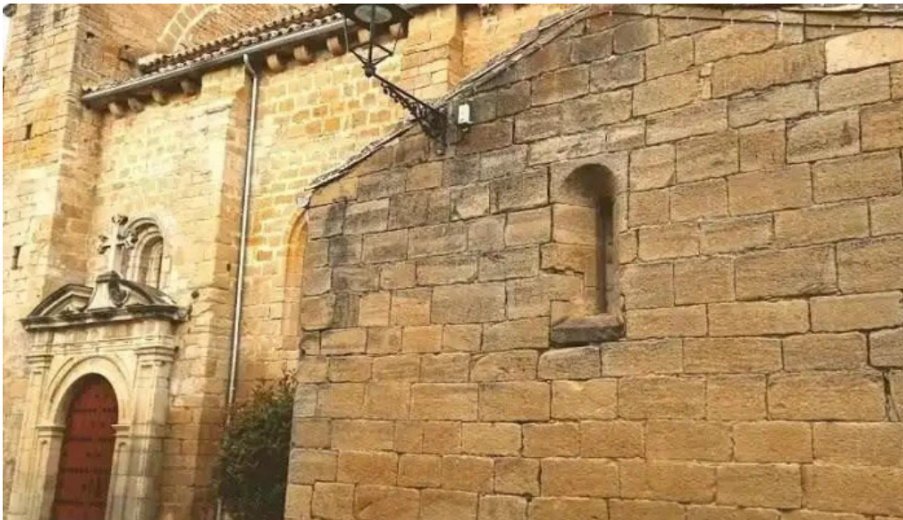
Iglesia de san martin lerga