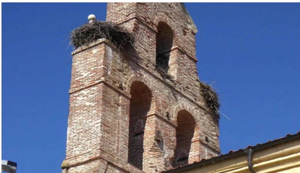
Iglesia de san pedro de puente castro como llegar