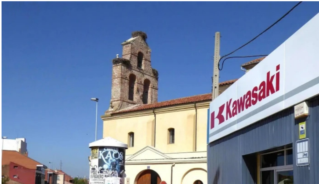
Iglesia de san pedro de puente castro leon