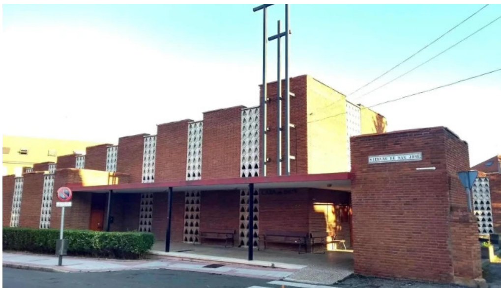
Iglesia de san pedro de puente castro iglesia catolica