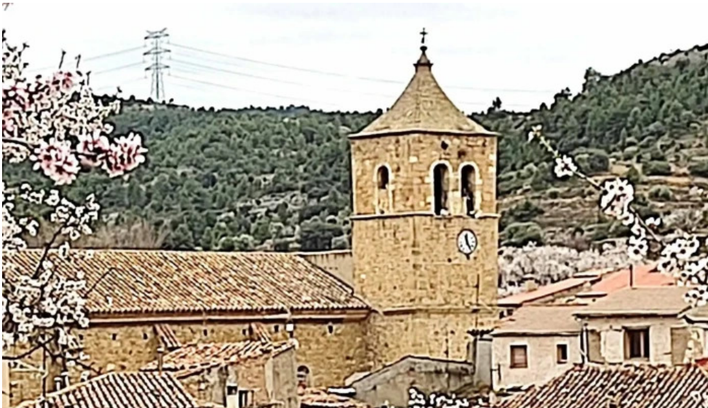
Iglesia de san nicolas de bari las parras de castellote comentario 5