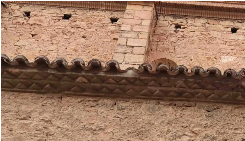
Iglesia de san nicolas de bari las parras de castellote comentario 3