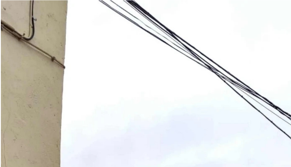
Iglesia de san nicolas de bari las parras de castellote comentario 2