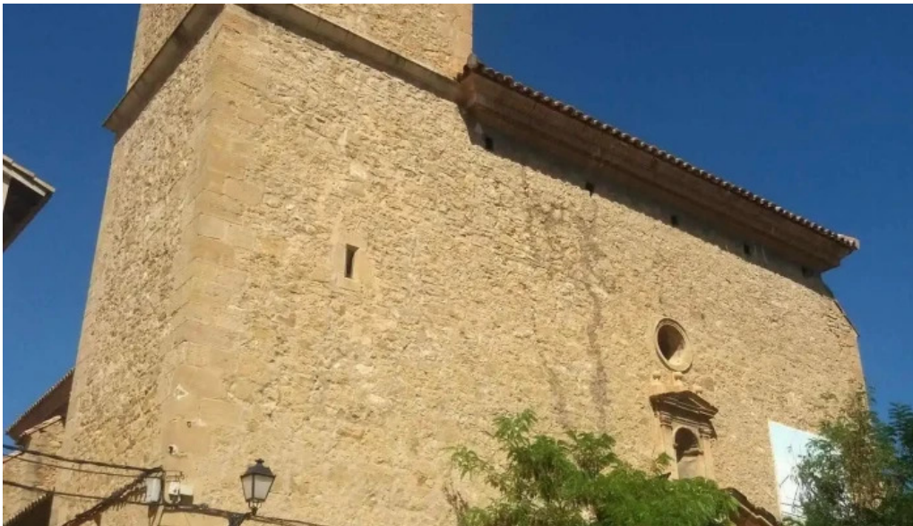
Iglesia de san nicolas de bari las parras de castellote iglesia