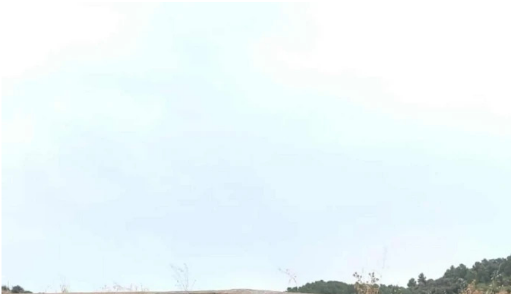
Iglesia de san nicolas de bari las parras de castellote comentario 1