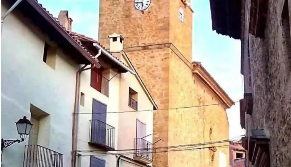
Iglesia de san nicolas de bari las parras de castellote las parras de castellote