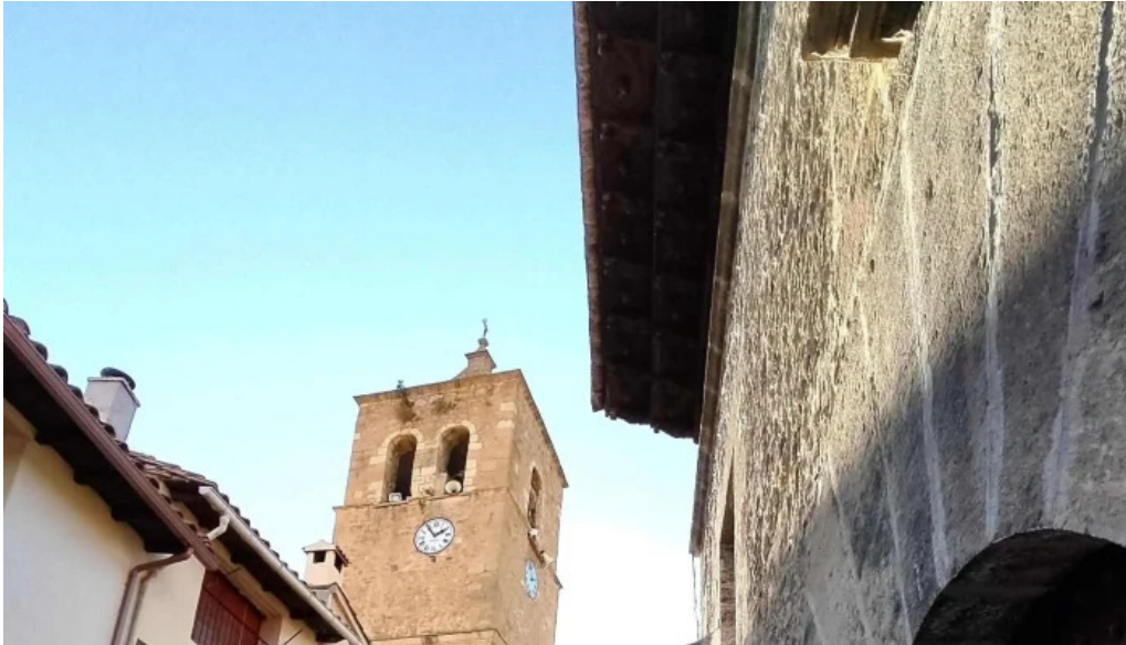
Iglesia de san nicolas de bari las parras de castellote comentario 6