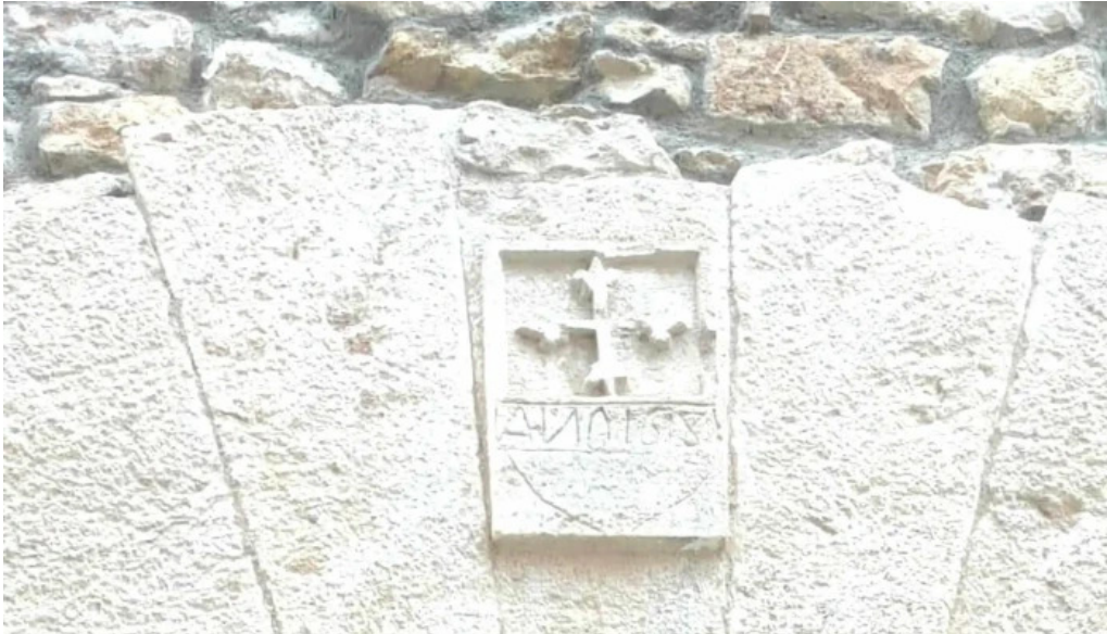
Iglesia de san nicolas de bari las parras de castellote comentario 4