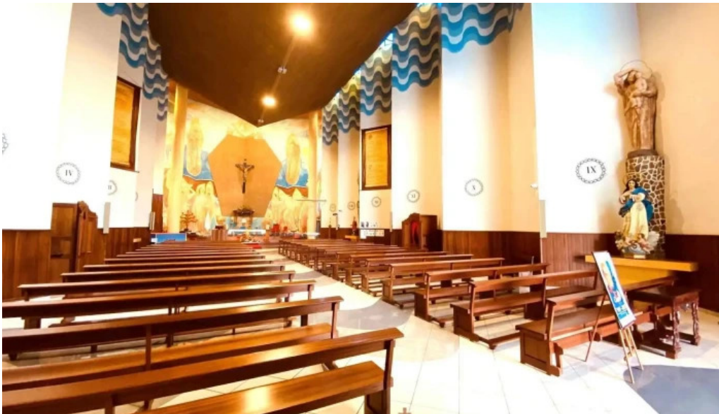
Iglesia nuestra senora de los dolores iglesia