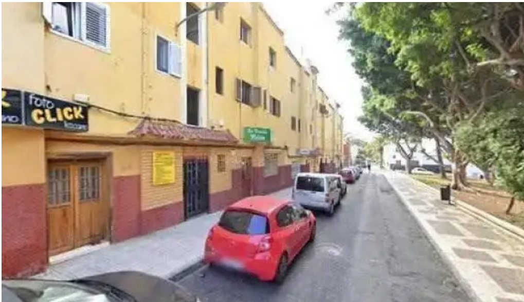
Iglesia nuestra senora de los dolores precios