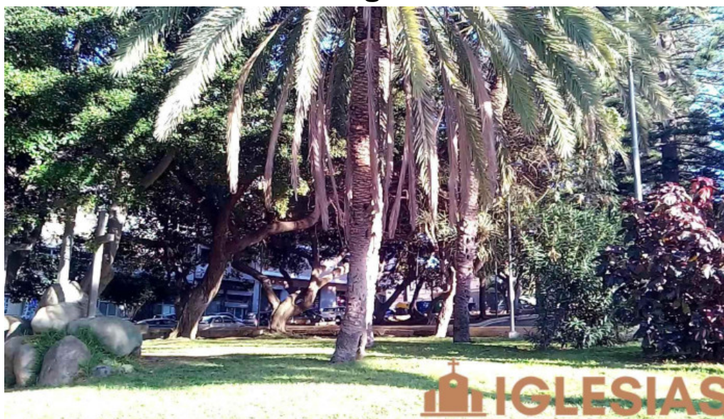
Iglesia nuestra senora de los dolores videos