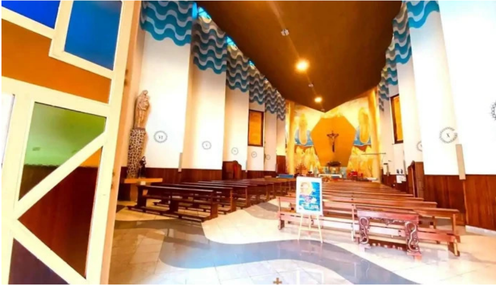
Iglesia nuestra senora de los dolores las palmas de gran canaria