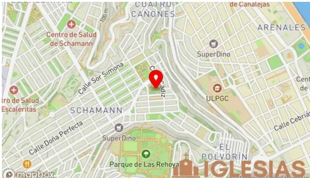
Iglesia nuestra senora de los dolores mapa