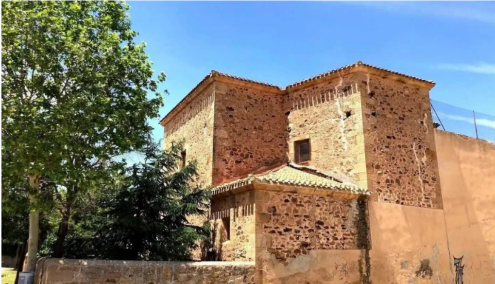
Iglesia de san bartolome apostol las casas