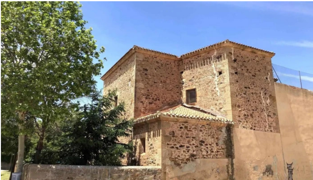
Iglesia de san bartolome apostol iglesia catolica