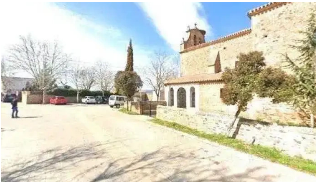
Iglesia de san bartolome apostol videos