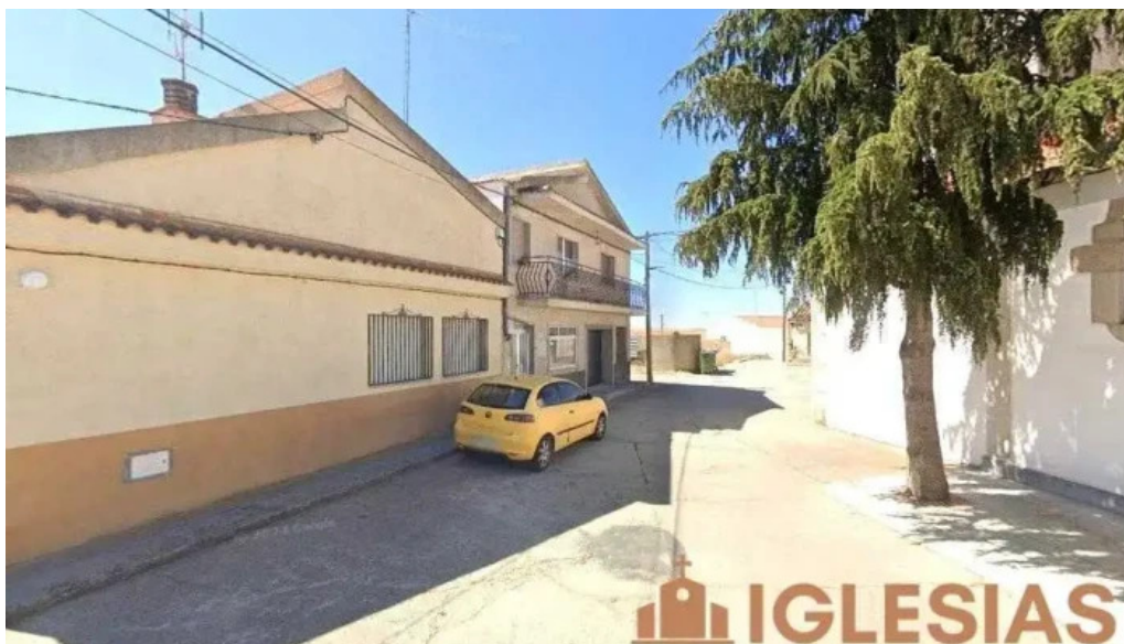
Iglesia parroquial de san pedro apostol larrodrigo