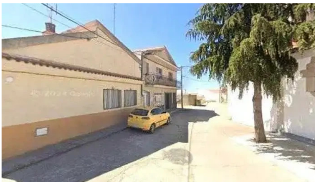
Iglesia parroquial de san pedro apostol iglesia catolica