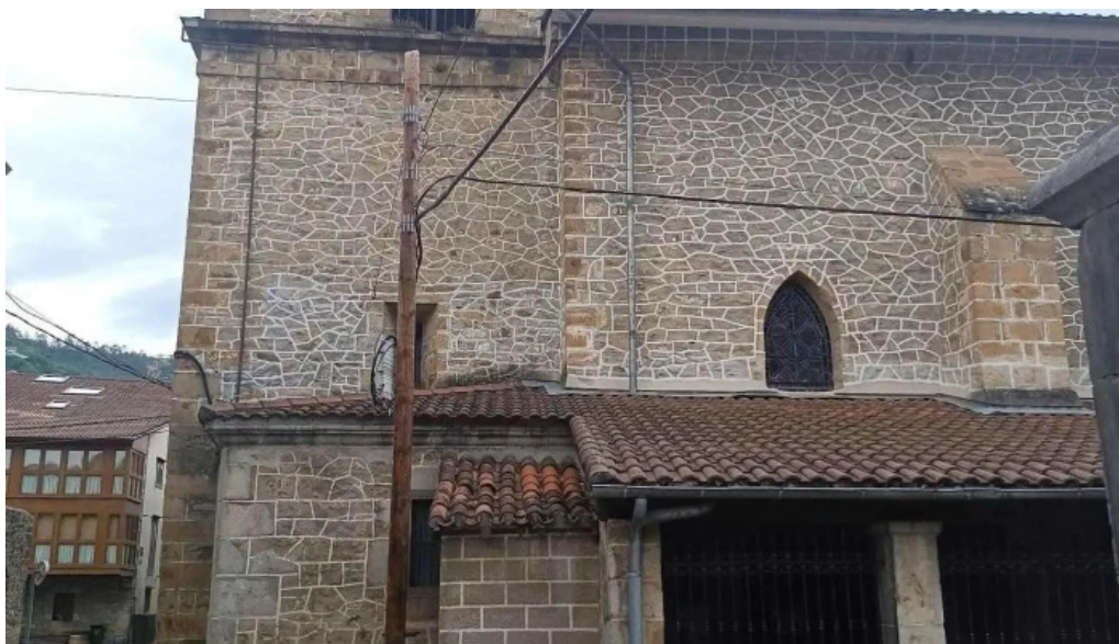
Iglesia de san pedro de lanestosa iglesia catolica