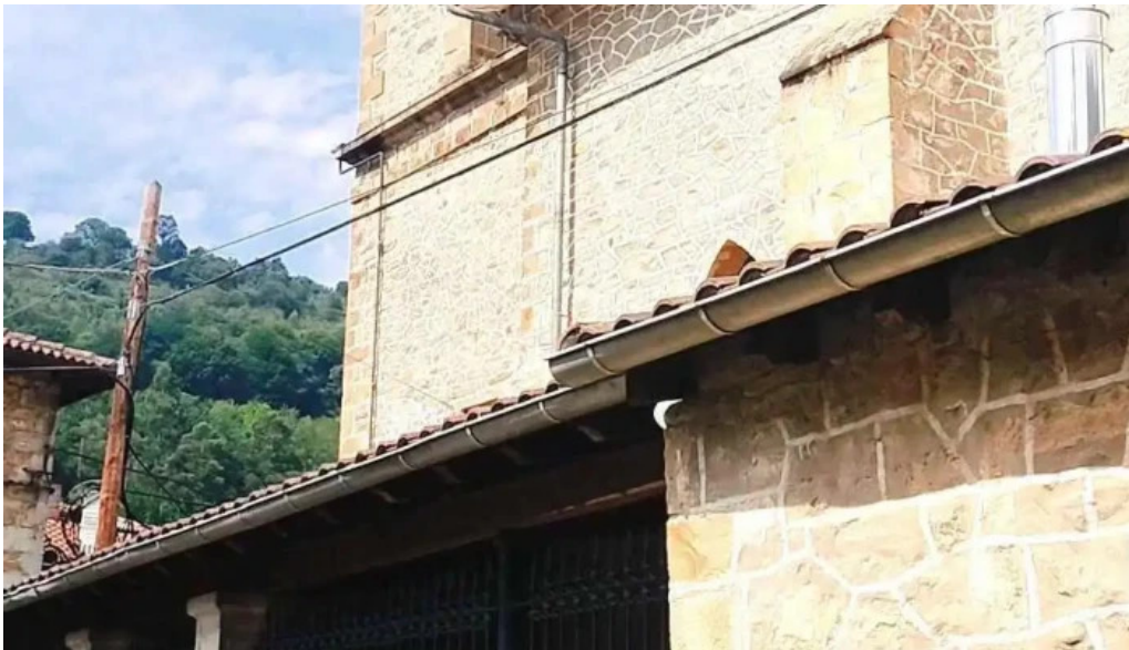
Iglesia de san pedro de lanestosa videos