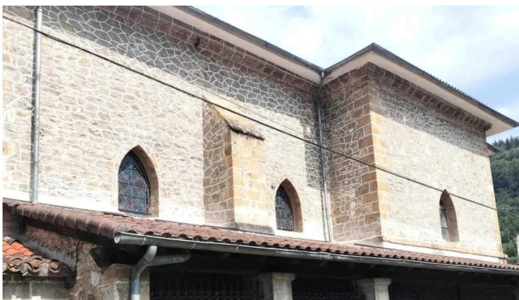
Iglesia de san pedro de lanestosa cerca de mi