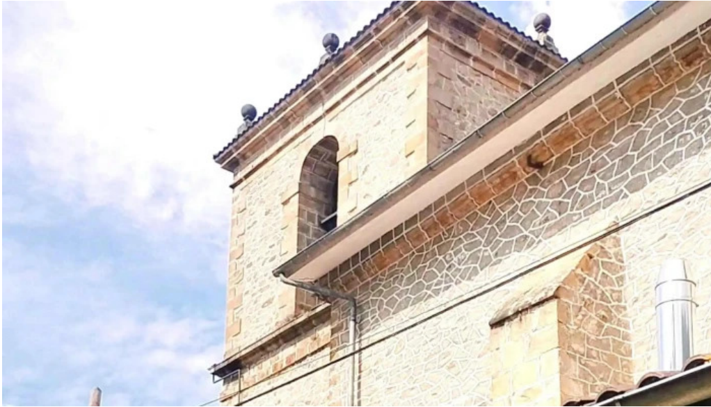
Iglesia de san pedro de lanestosa lanestosa