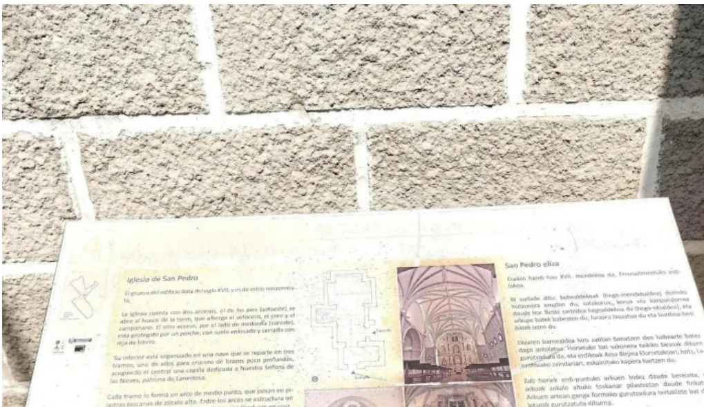
Iglesia de san pedro de lanestosa puntaje