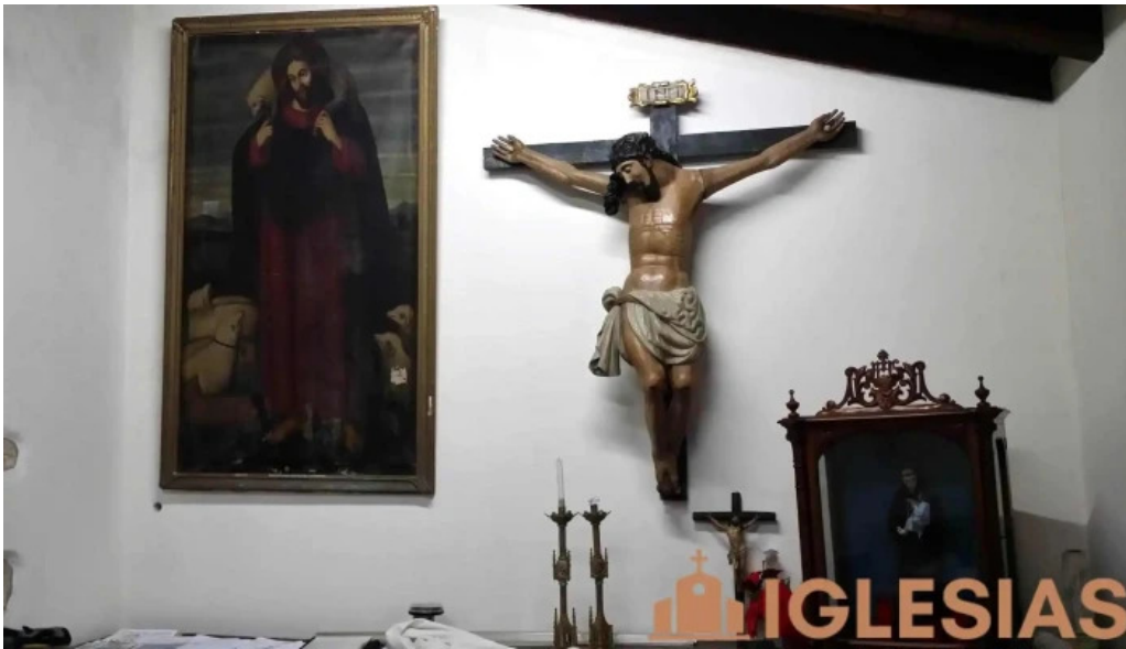
Iglesia de san pedro de lanestosa iglesia