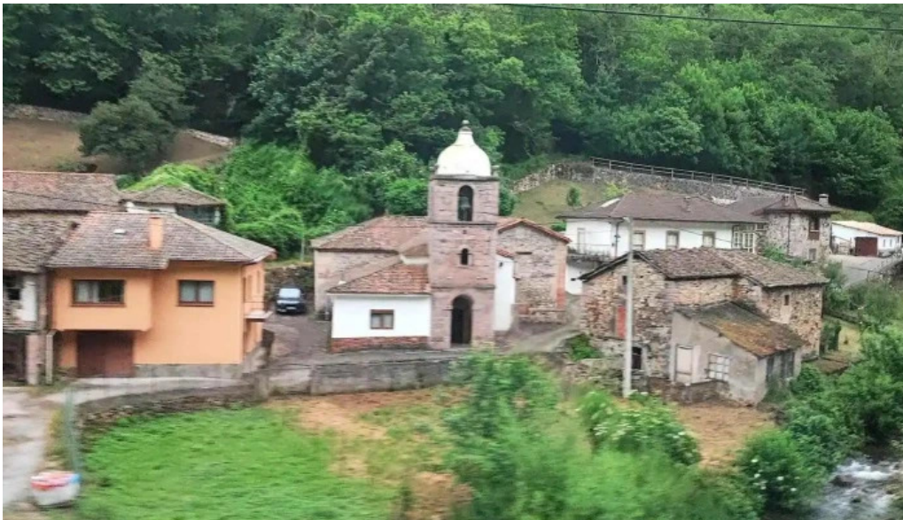
Iglesia de san pedro iglesia catolica