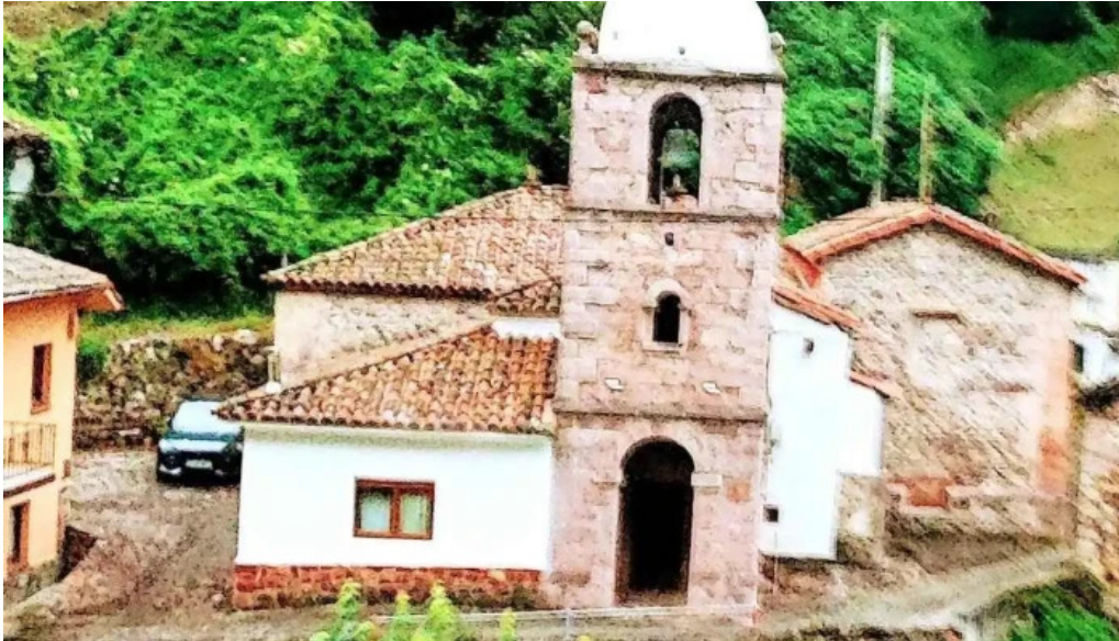
Iglesia de san pedro iglesia