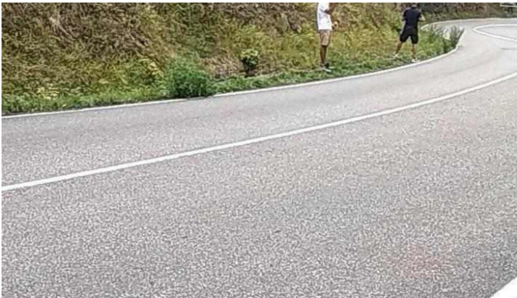
Iglesia de san pedro videos