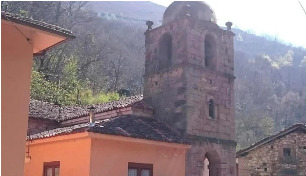
Iglesia de san pedro la riera