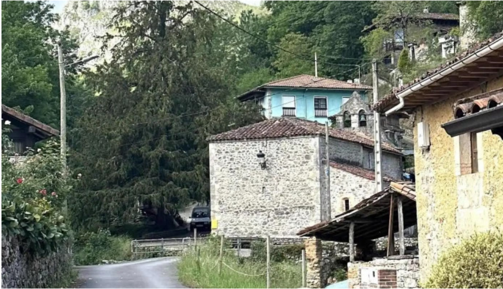
Iglesia de san justo y san pastor iglesia catolica