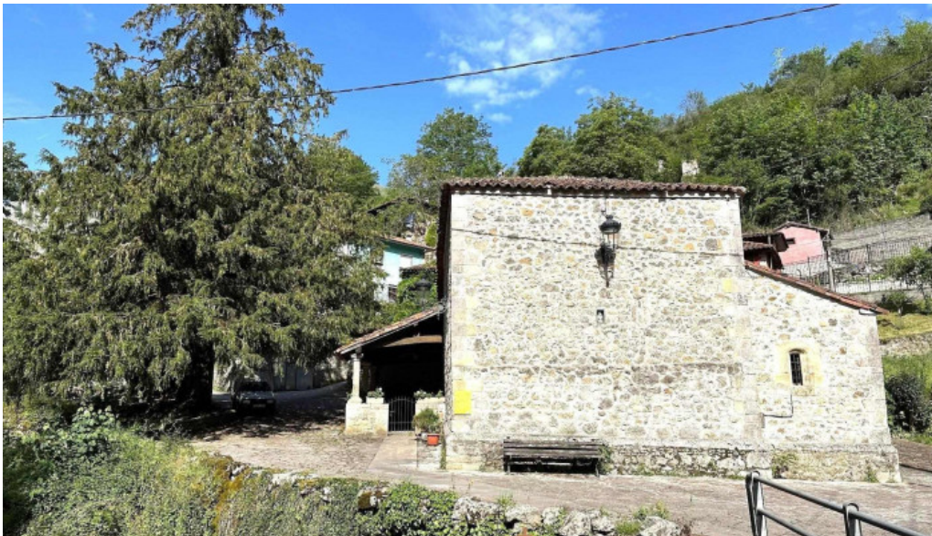
Iglesia de san justo y san pastor del propietario