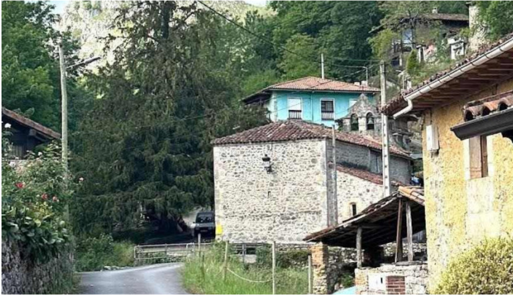
Iglesia de san justo y san pastor la riera