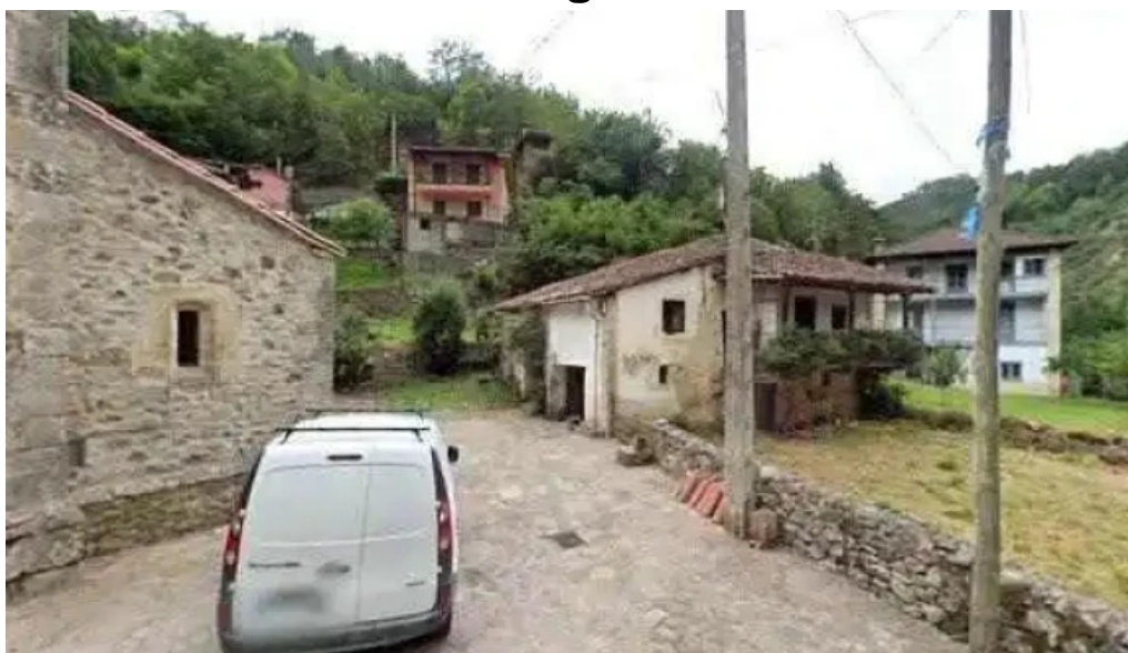
Iglesia de san justo y san pastor telefono