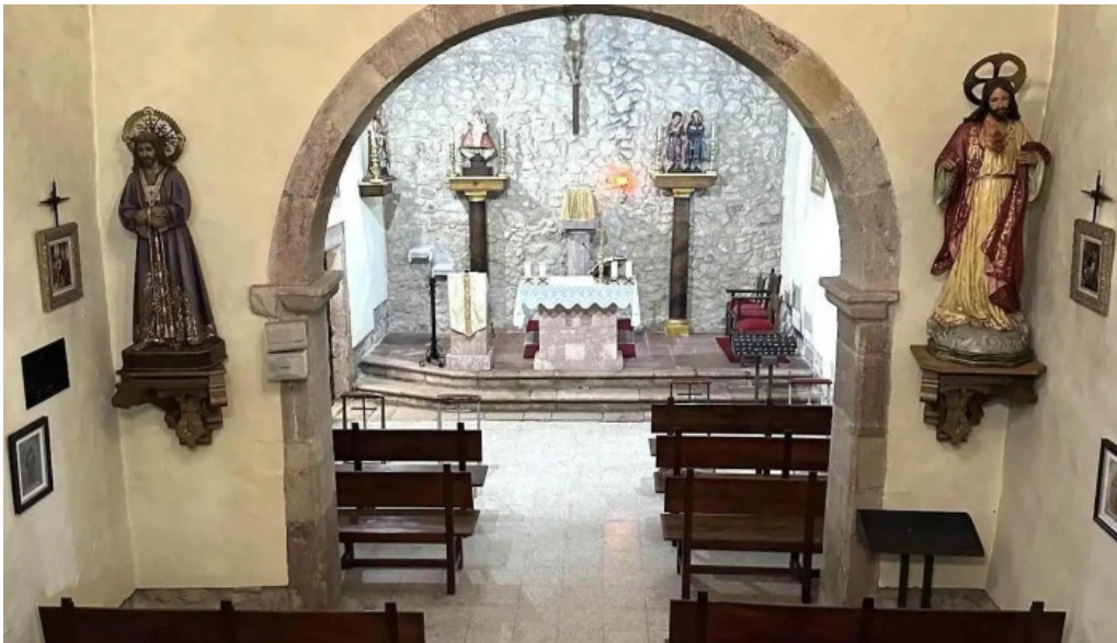
Iglesia de san justo y san pastor iglesia