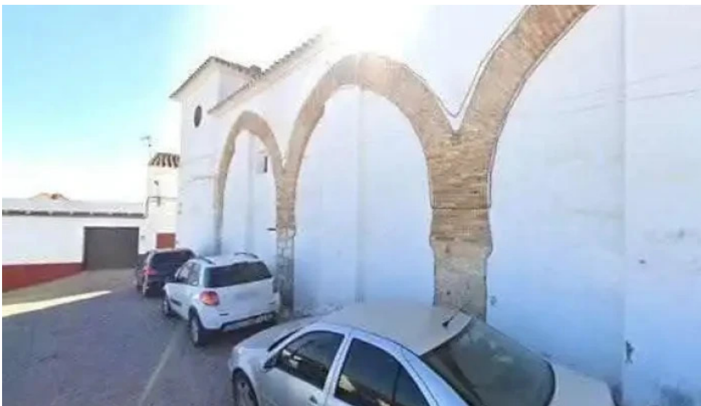
Ermita de santiago comentarios