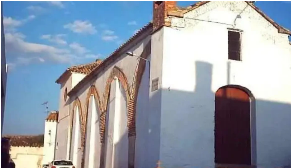
Ermita de santiago iglesia catolica