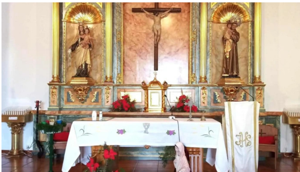
Parroquia san antonio de padua cerca de mi