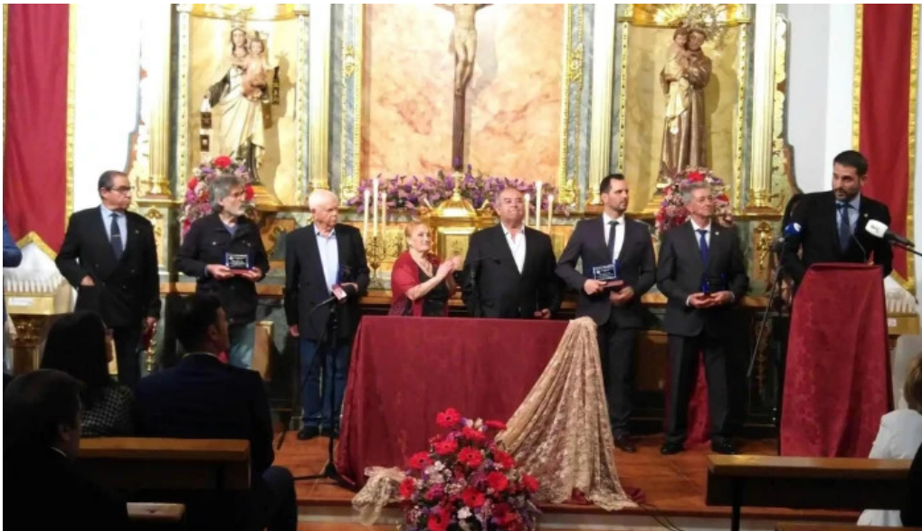
Parroquia san antonio de padua isla del moral