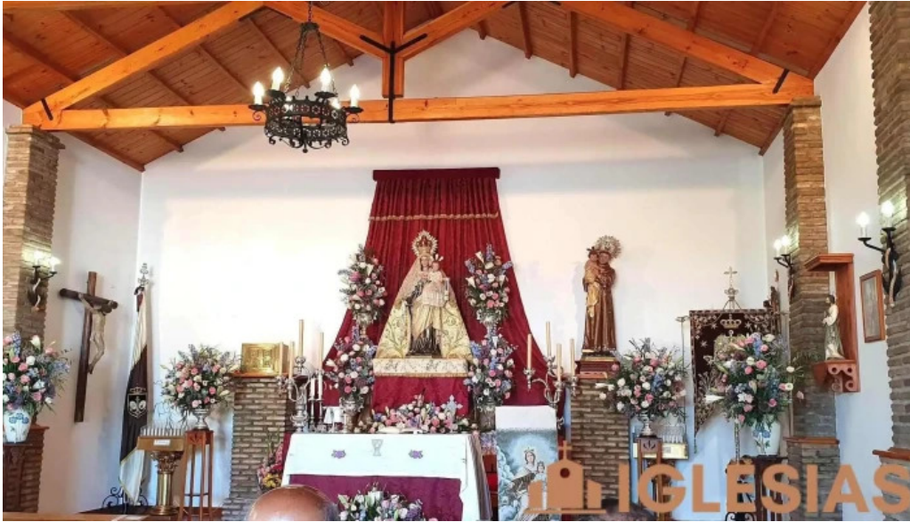
Parroquia san antonio de padua iglesia