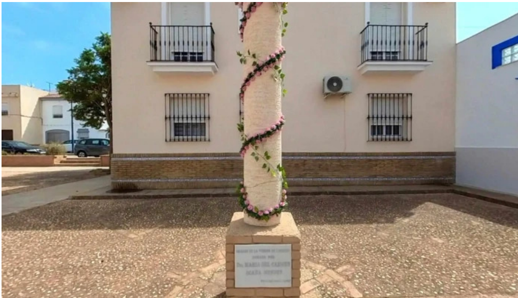
Parroquia san antonio de padua recientes