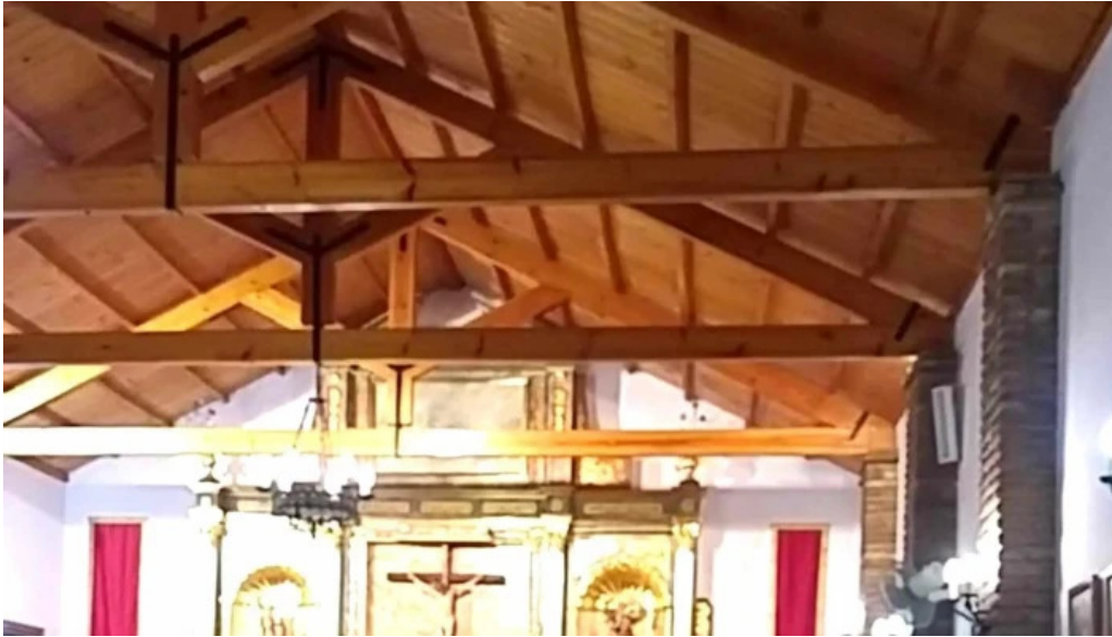
Parroquia san antonio de padua opiniones