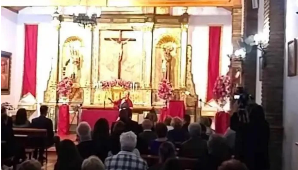
Parroquia san antonio de padua videos