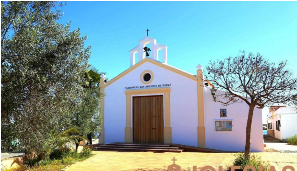
Parroquia san antonio de padua iglesia catolica