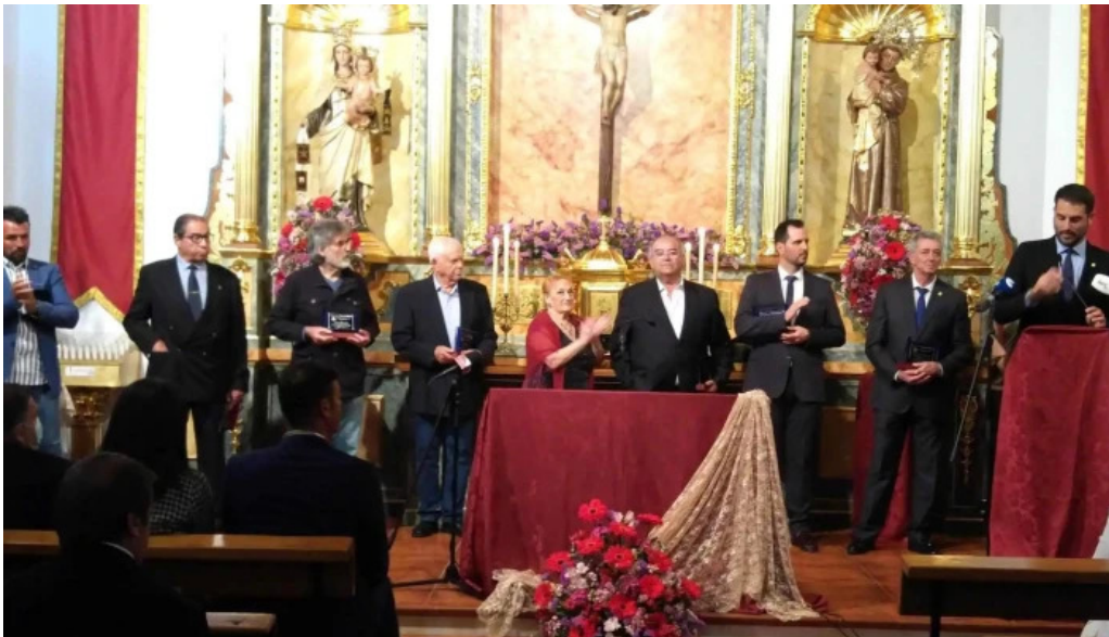
Parroquia san antonio de padua numero