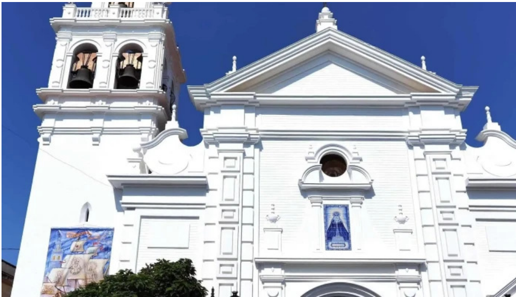
Iglesia nuestra senora de los dolores donde