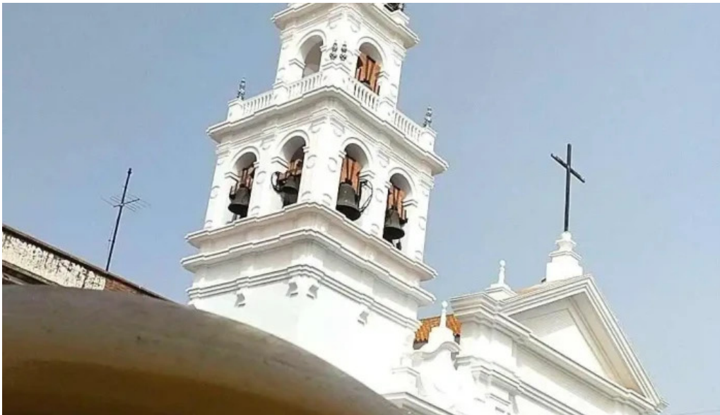
Iglesia nuestra senora de los dolores iglesia