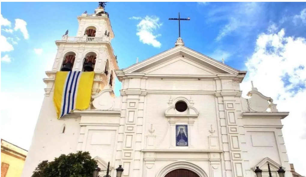
Iglesia nuestra senora de los dolores iglesia catolica