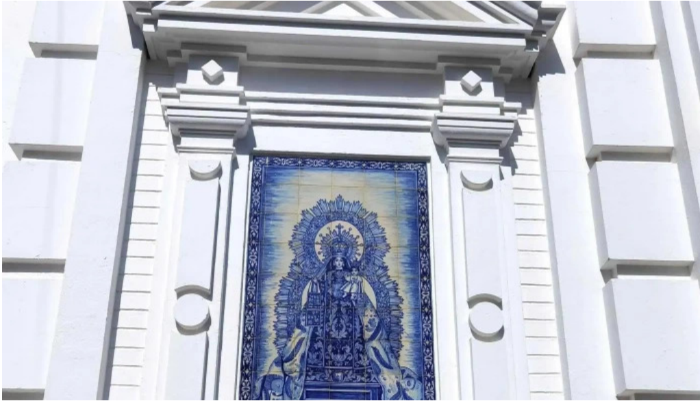
Iglesia nuestra senora de los dolores horario