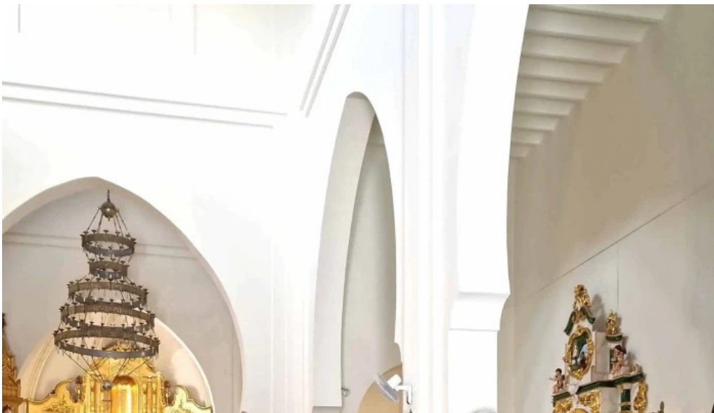
Iglesia nuestra senora de los dolores precios