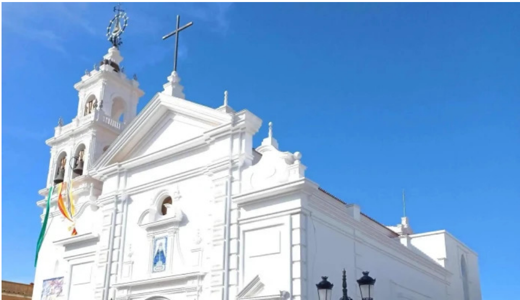
Iglesia nuestra senora de los dolores puntaje