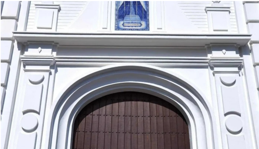
Iglesia nuestra senora de los dolores telefono