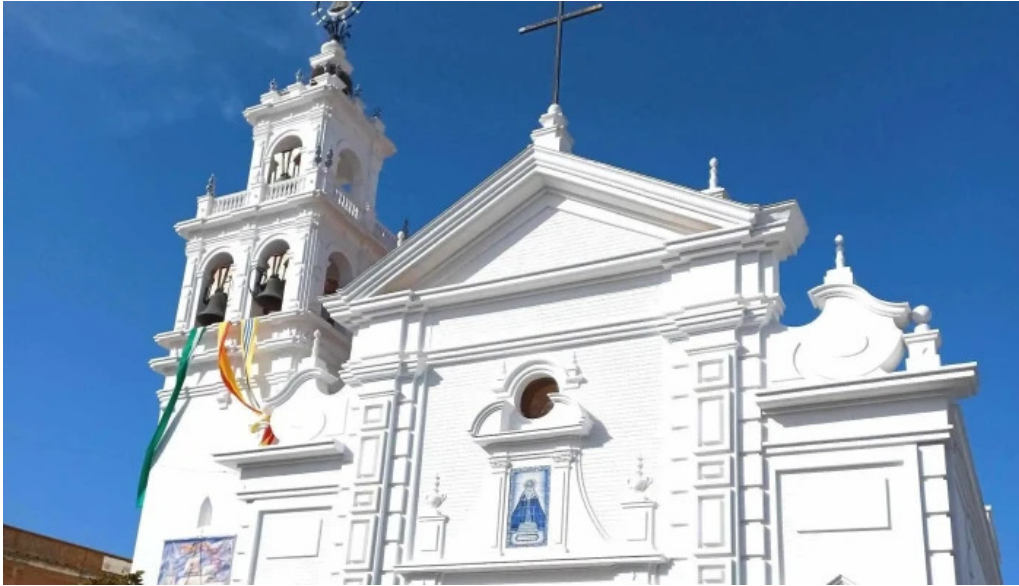
Iglesia nuestra senora de los dolores sitio web