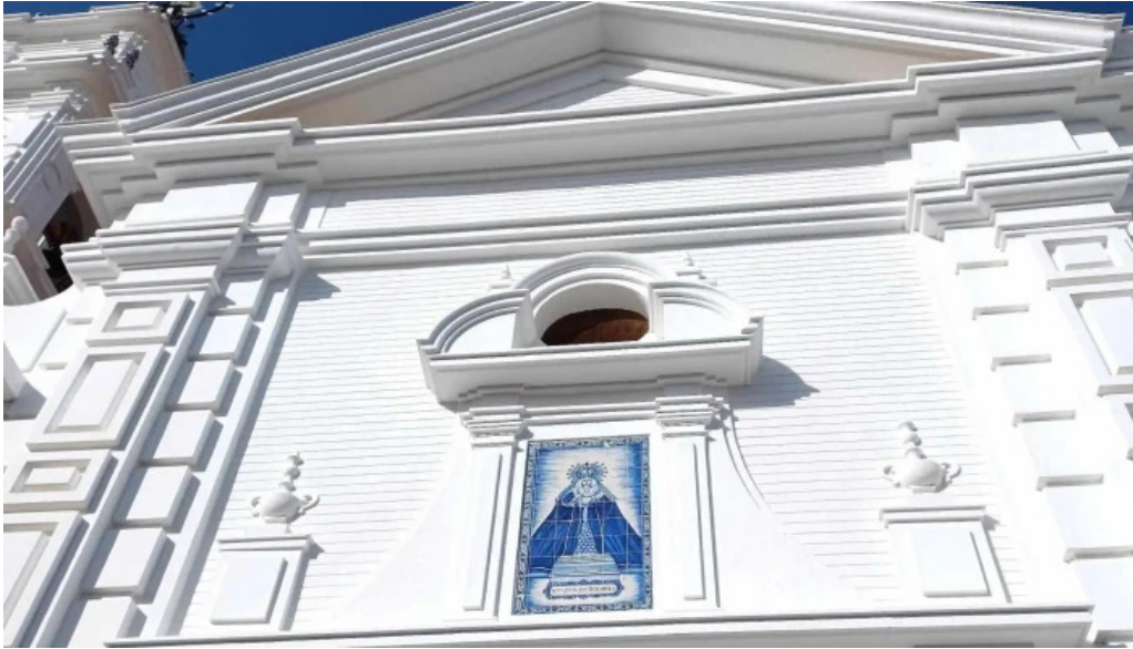
Iglesia nuestra senora de los dolores videos