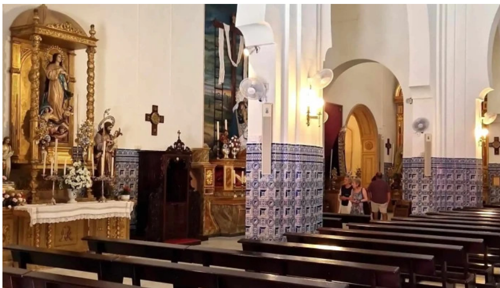
Iglesia nuestra senora de los dolores direccion