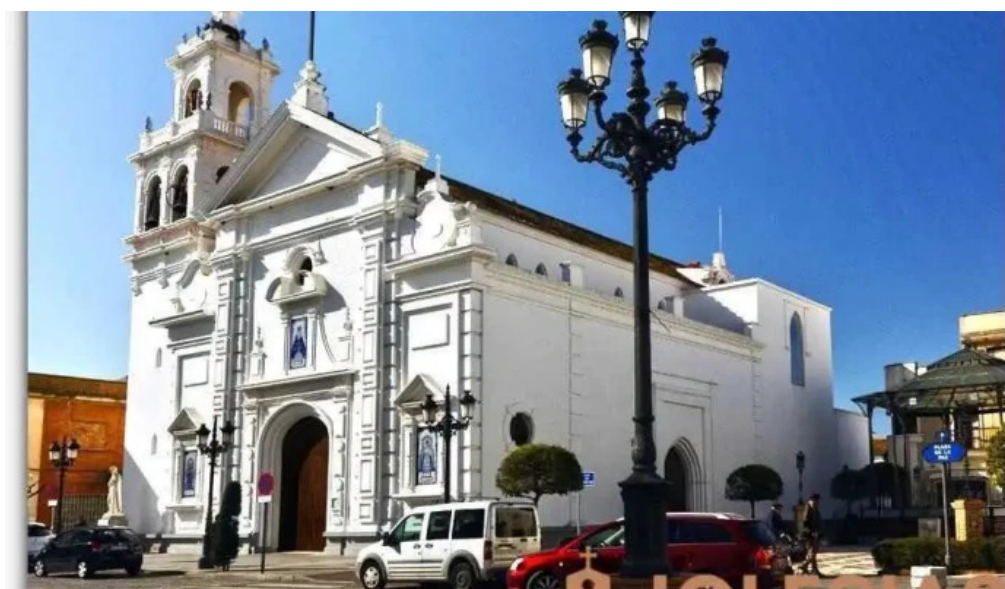
Iglesia nuestra senora de los dolores del propietario