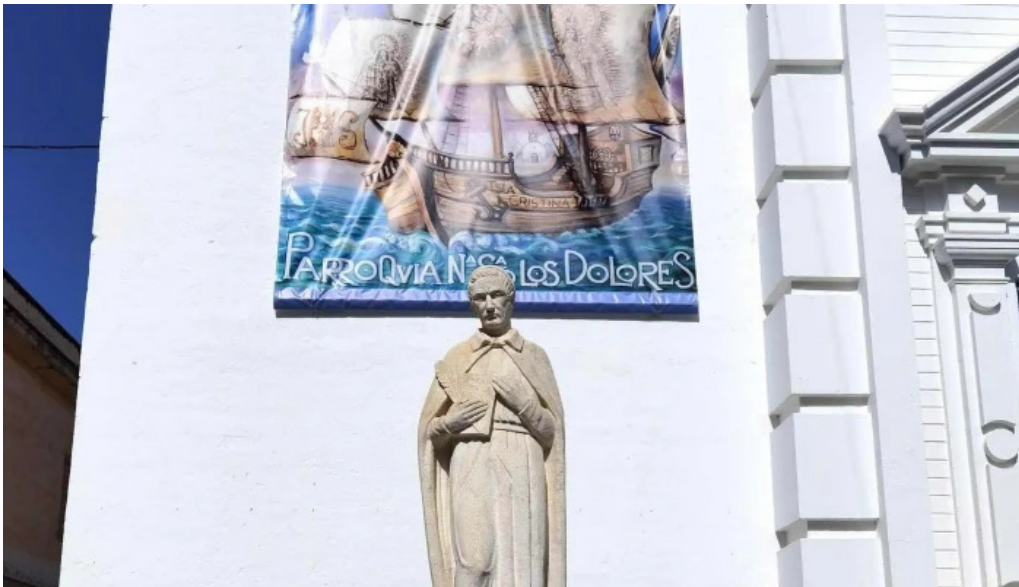
Iglesia nuestra senora de los dolores promocion