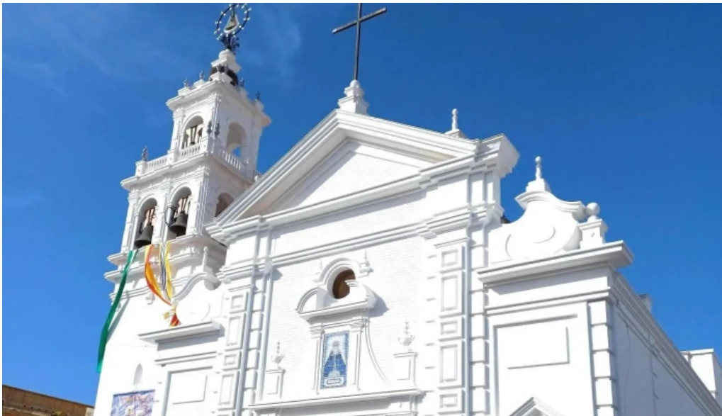
Iglesia nuestra senora de los dolores isla cristina