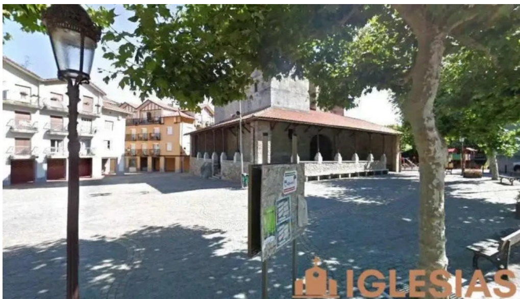
Mikel deunaren eliza iglesia de san miguel irura