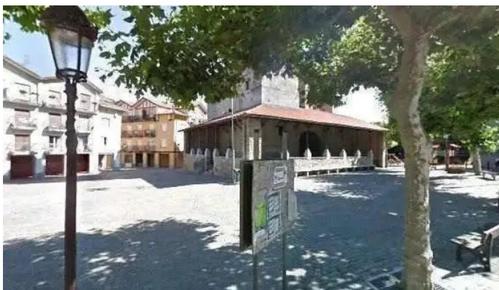
Mikel deunaren elizaiglesia de san miguel iglesia catolica