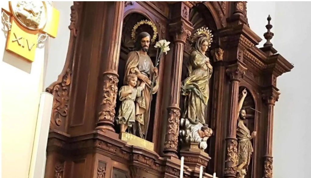
Iglesia de san antonio infiesto