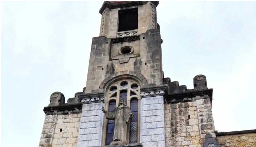
Iglesia de san antonio horario