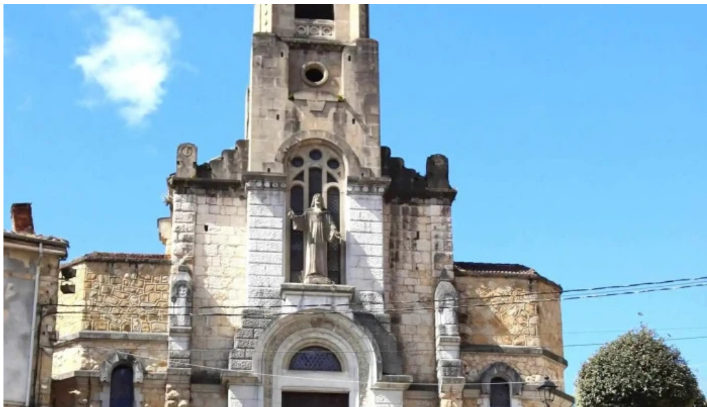
Iglesia de san antonio iglesia