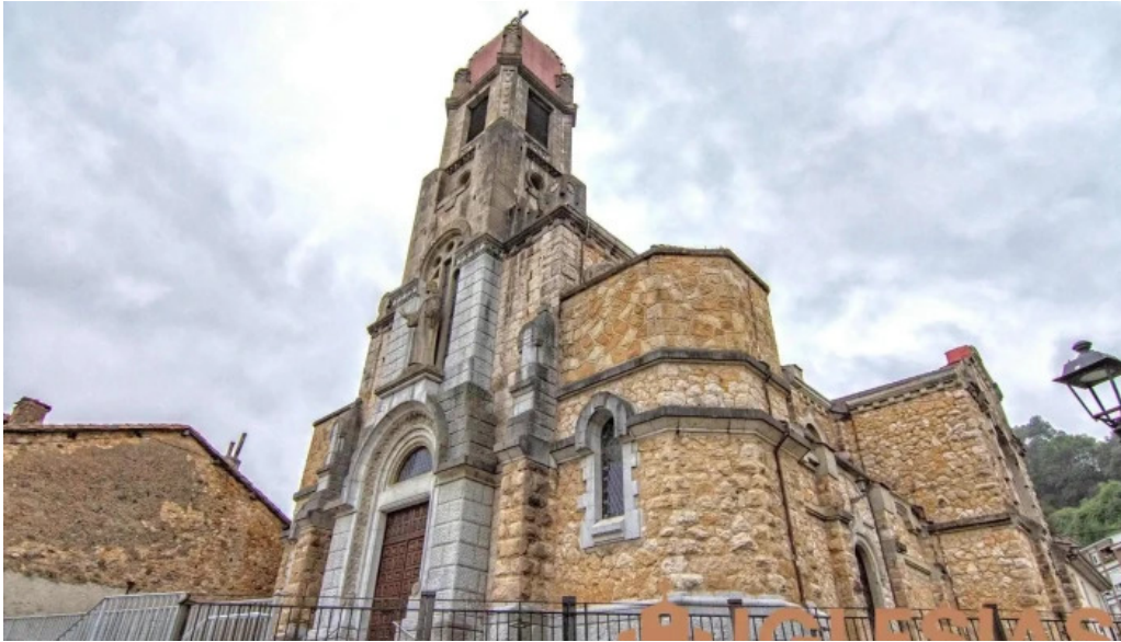
Iglesia de san antonio iglesia catolica