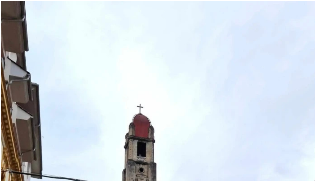
Iglesia de san antonio descuentos