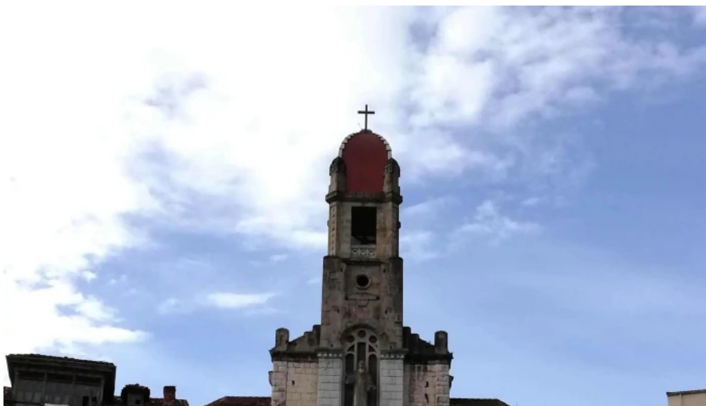
Iglesia de san antonio como llegar