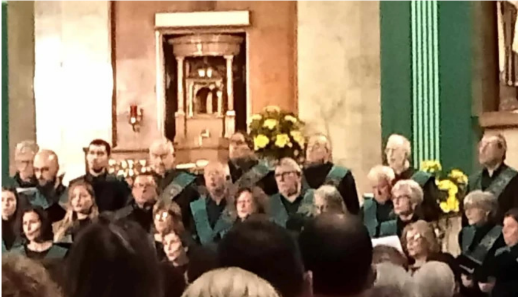
Iglesia de san antonio zona