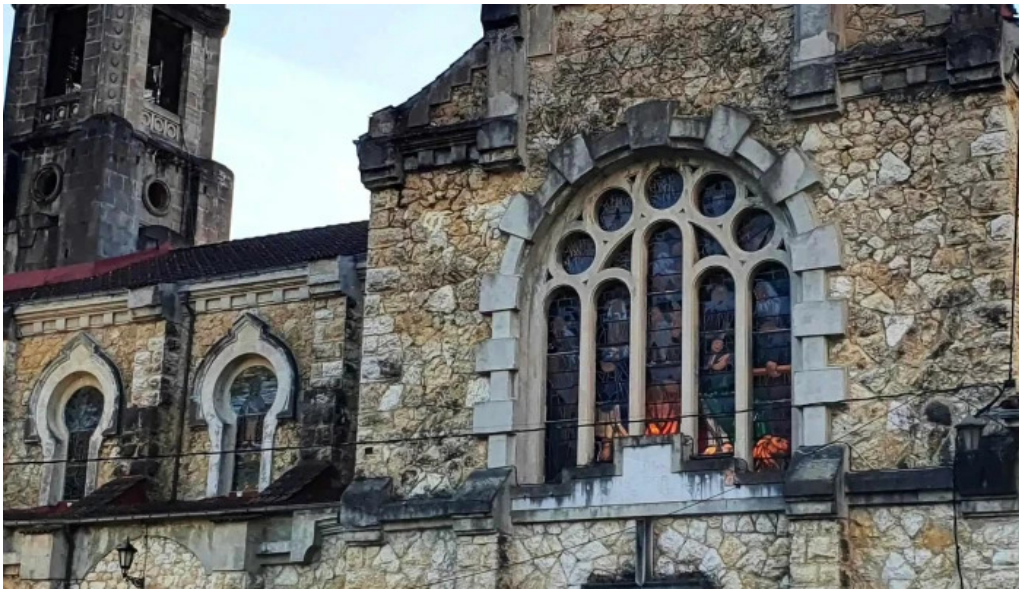
Iglesia de san antonio instagram