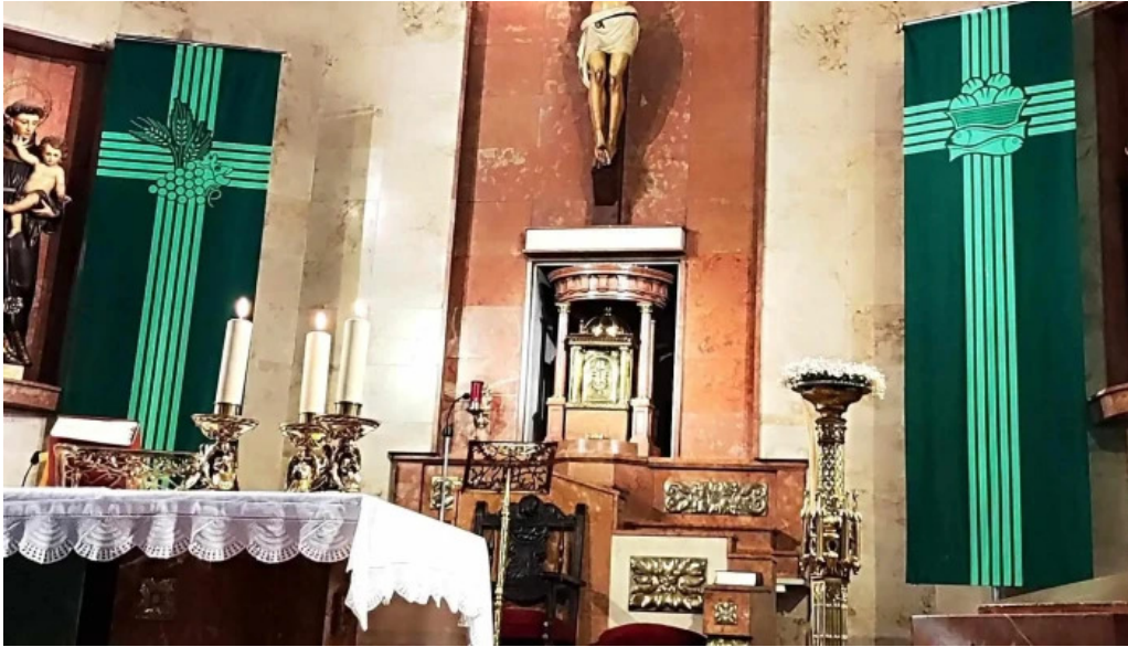
Iglesia de san antonio telefono