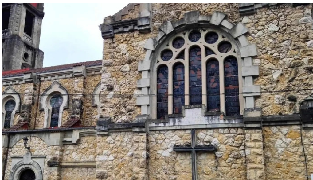
Iglesia de san antonio comentarios