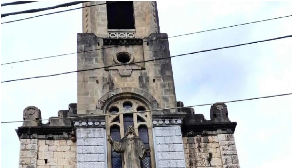
Iglesia de san antonio numero