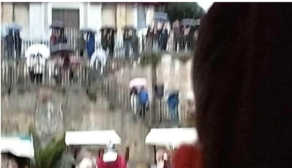
Iglesia de san antonio videos