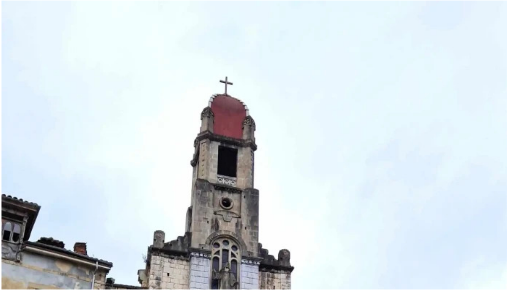
Iglesia de san antonio donde