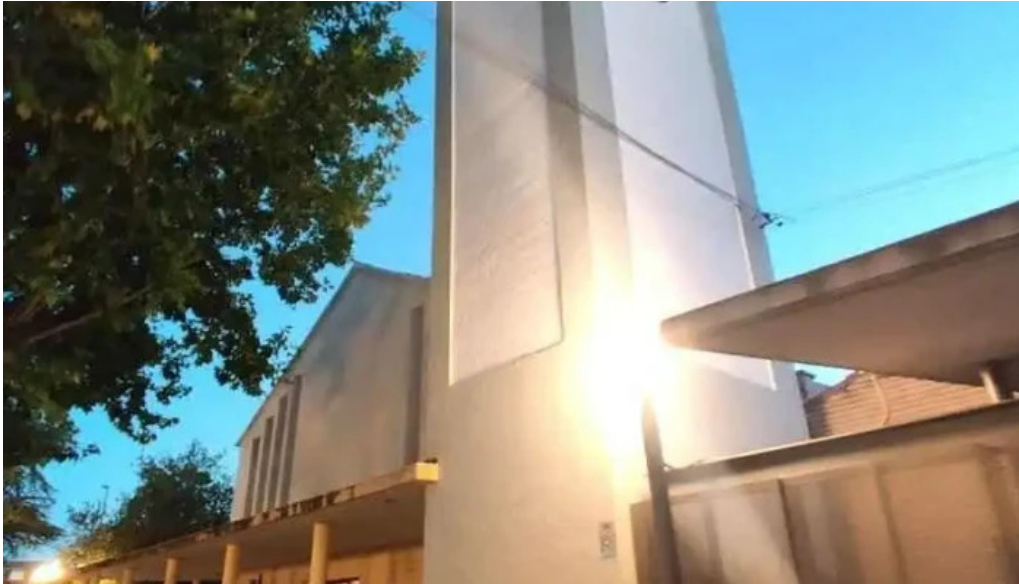
Nuestra señora del perpetuo socorro huesca