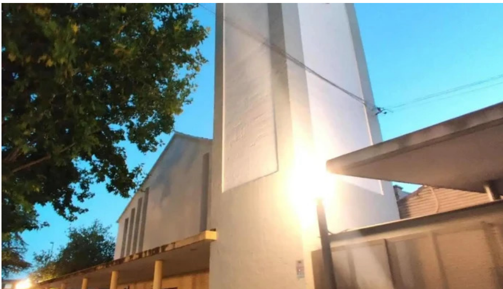
Nuestra senora del perpetuo socorro socorro