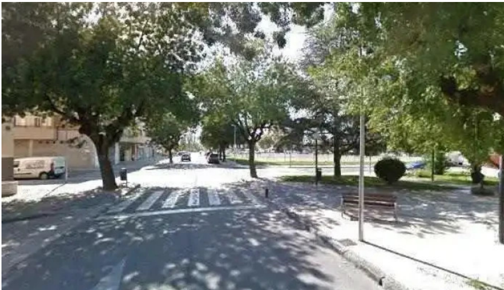
Nuestra senora del perpetuo socorro iglesia