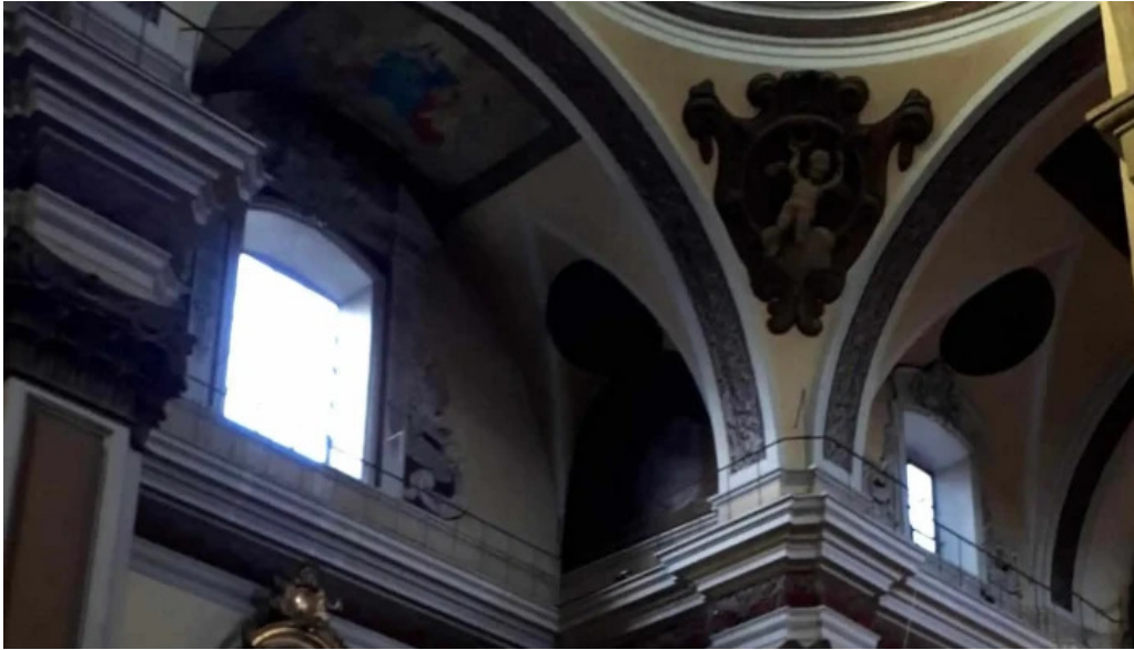
Iglesia de san vicente comentario 4