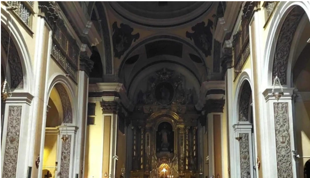
Iglesia de san vicente comentario 1