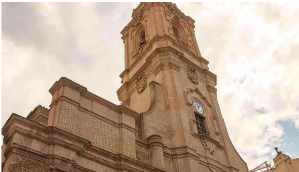
Iglesia de san vicente comentario 11