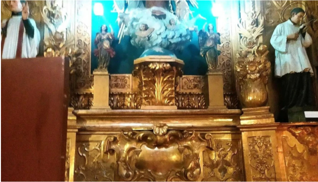
Iglesia de san vicente comentario 8