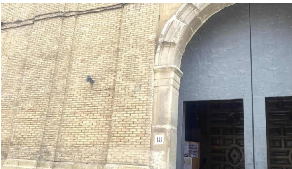
Iglesia de san vicente comentario 10