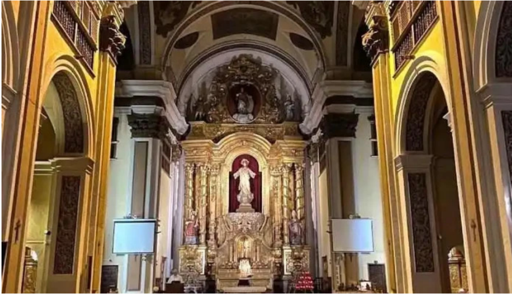
Iglesia de san vicente huesca