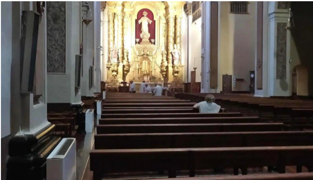
Iglesia de san vicente comentario 7