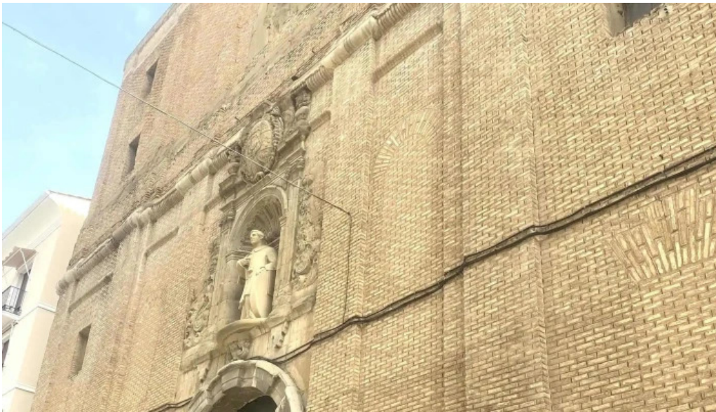
Iglesia de san vicente comentario 9