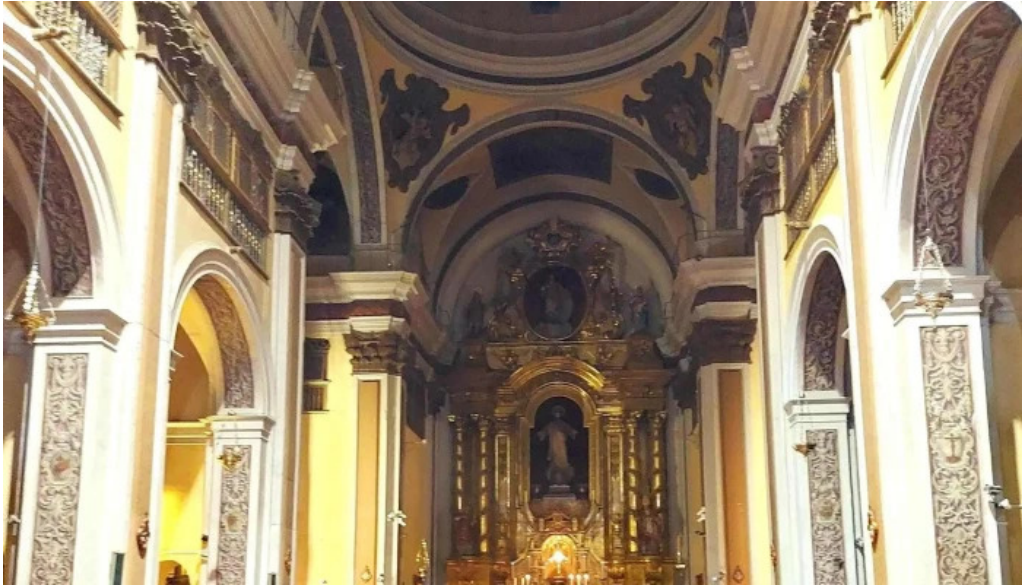
Iglesia de san vicente comentario 2