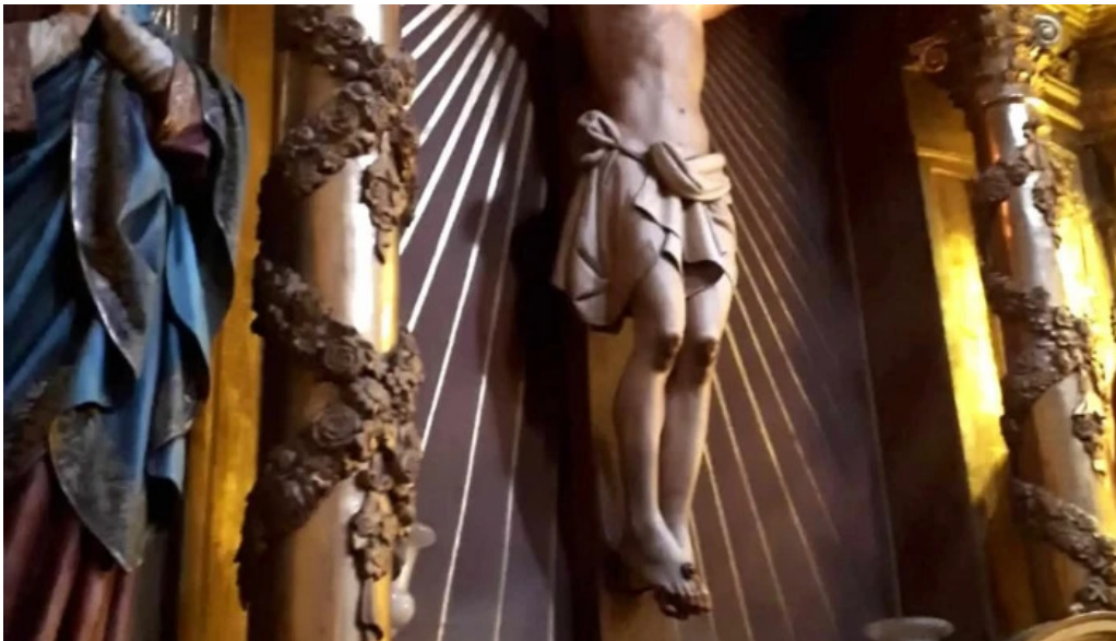
Iglesia de san vicente comentario 5