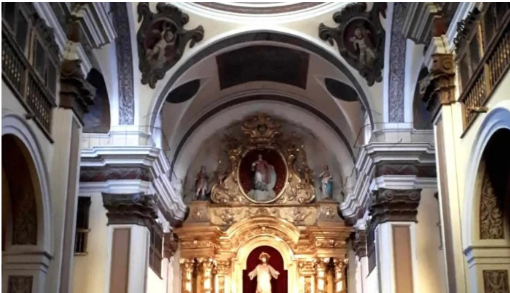
Iglesia de san vicente comentario 3