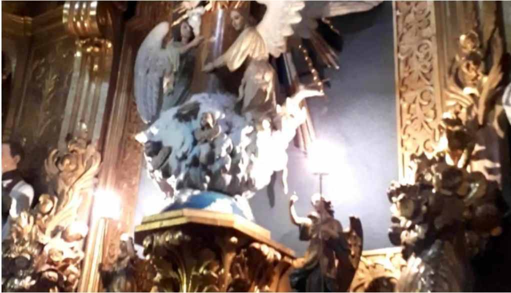
Iglesia de san vicente comentario 6