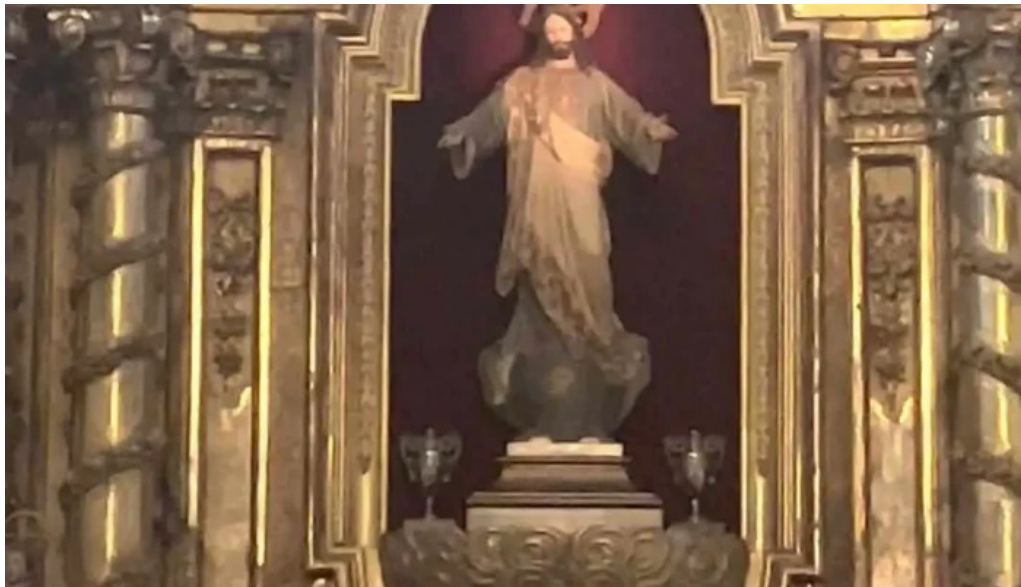
Iglesia de san vicente iglesia