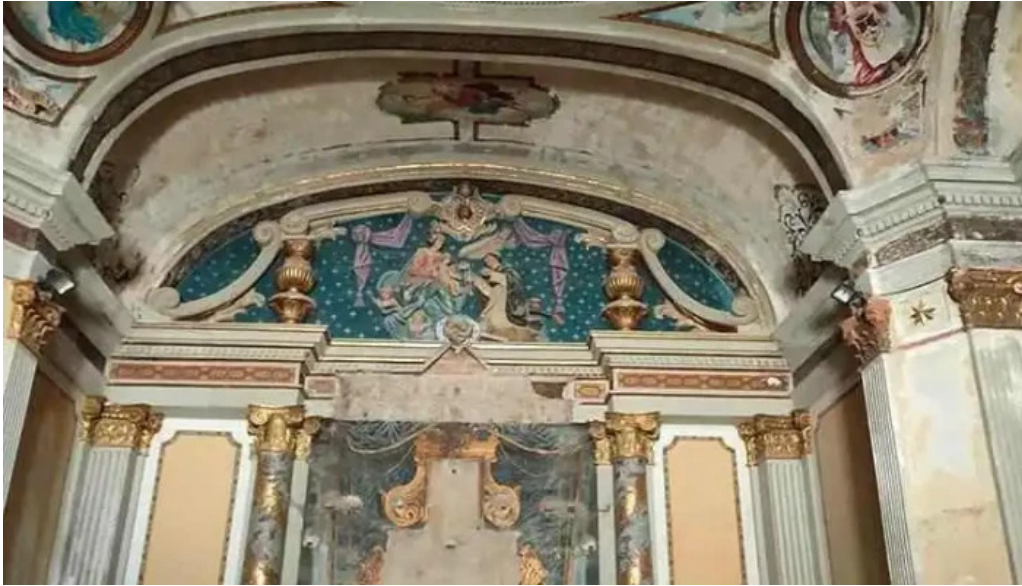
Antigua iglesia de santa rosa iglesia