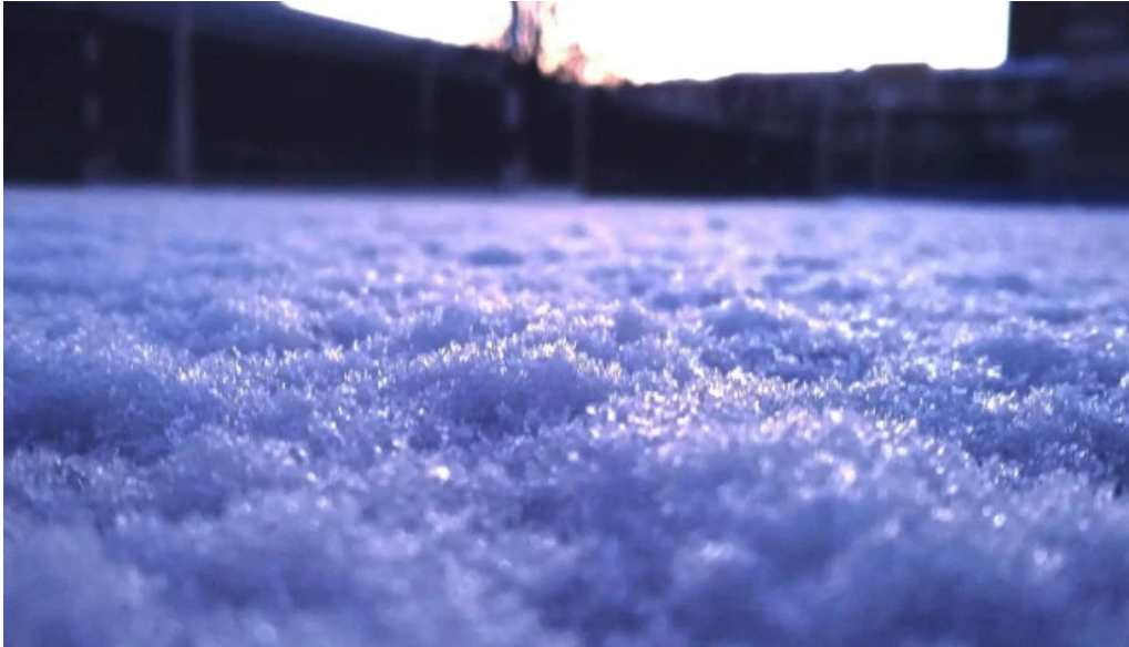
Antigua iglesia de santa rosa comentario 2