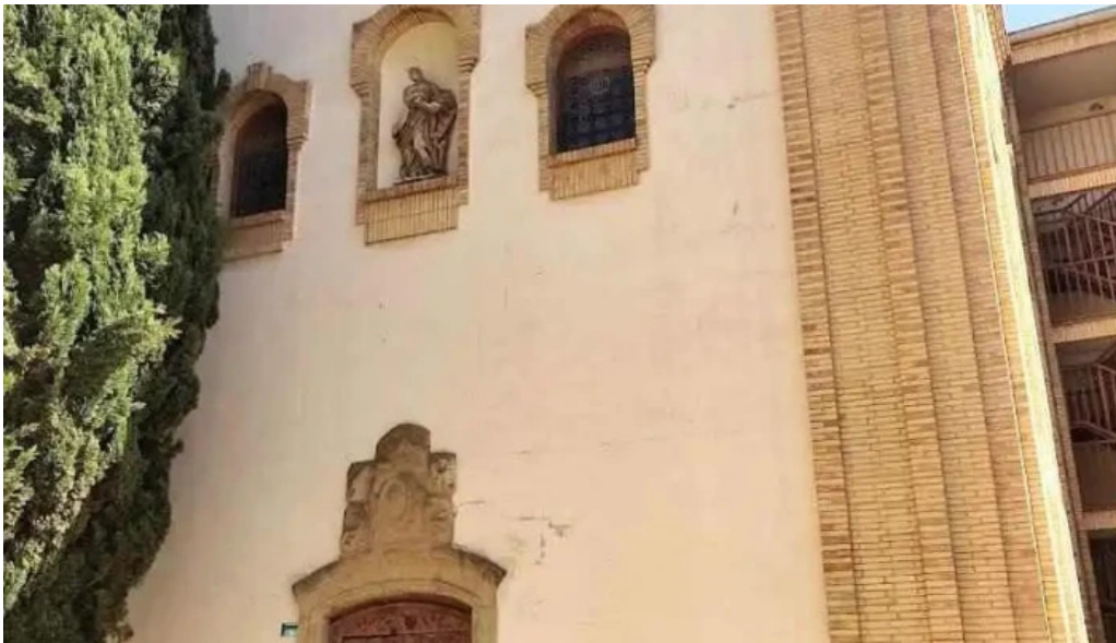
Antigua iglesia de santa rosa huesca