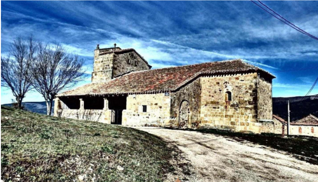
Iglesia de la asuncion de nuestra senora hinojosa de la sierra