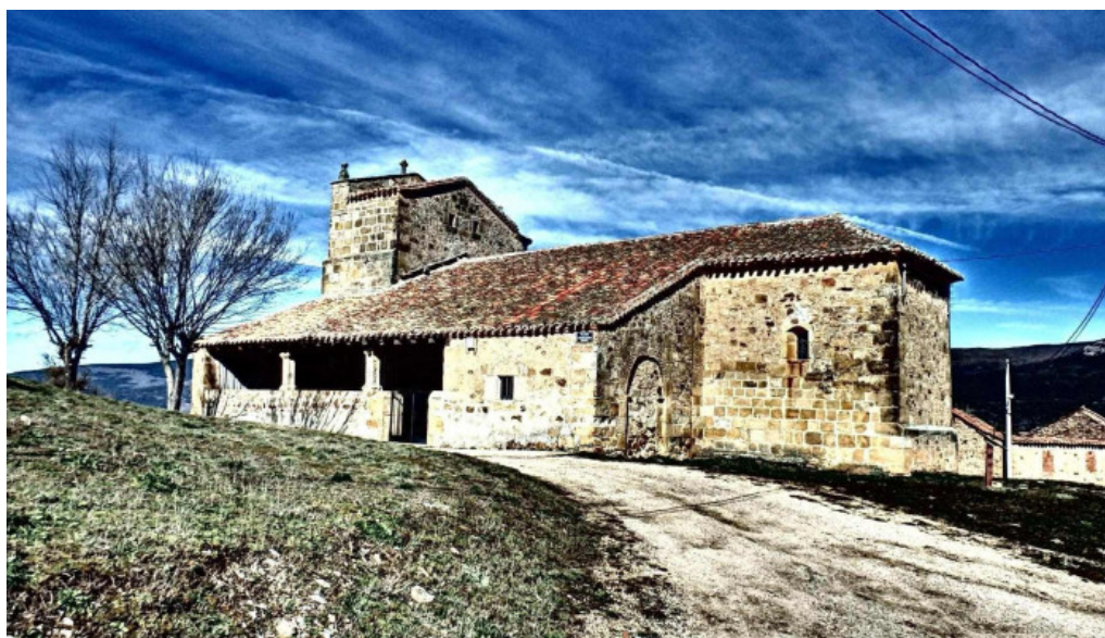
Iglesia de la asuncion de nuestra senora iglesia catolica