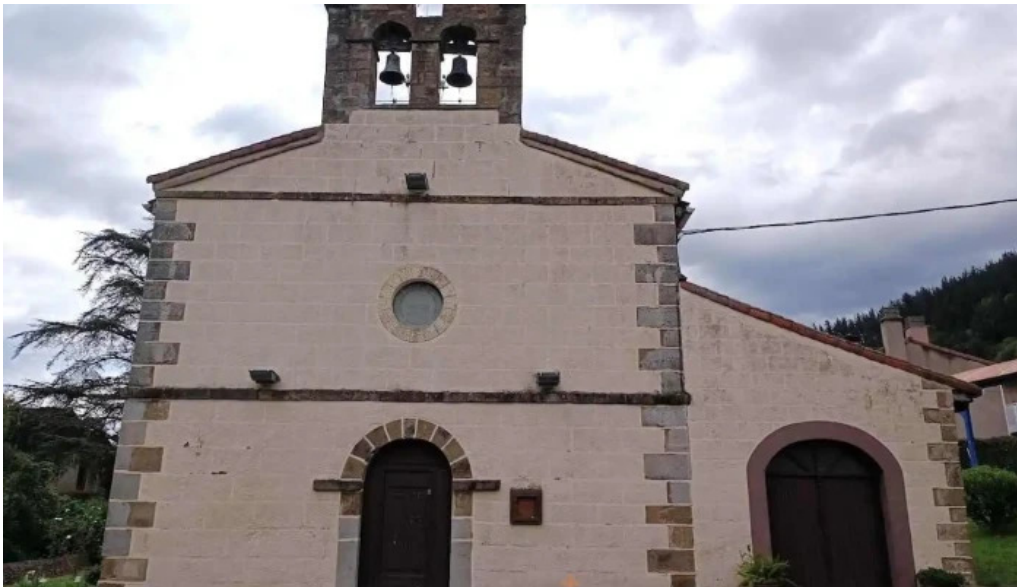
Iglesia de san pedro gueñes