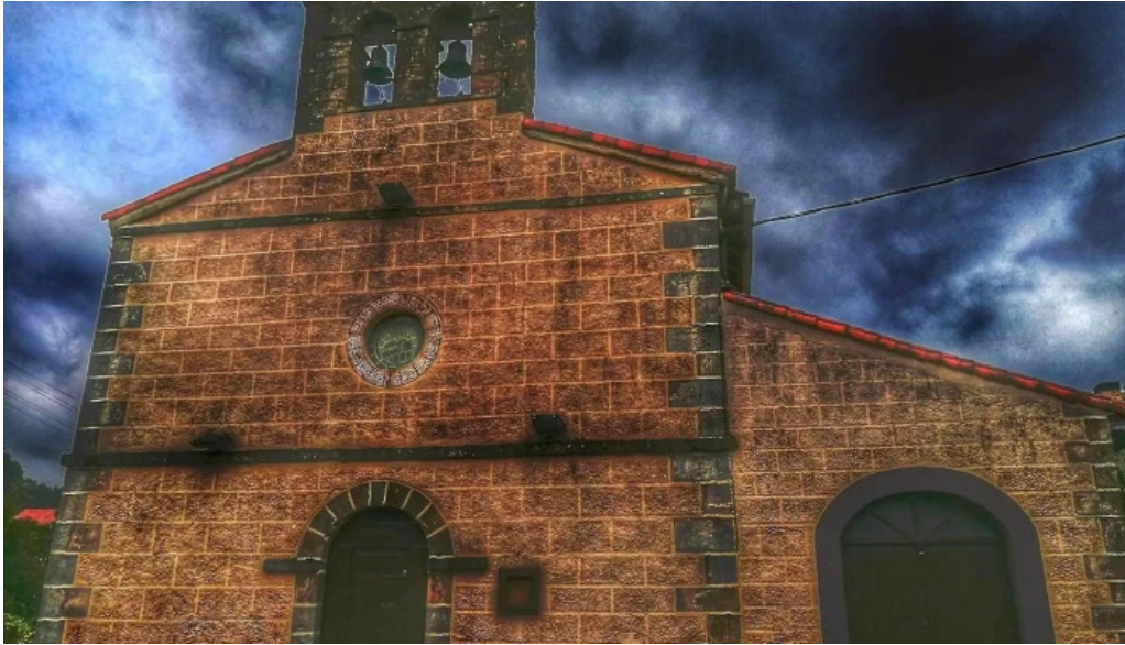
Iglesia de san pedro iglesia