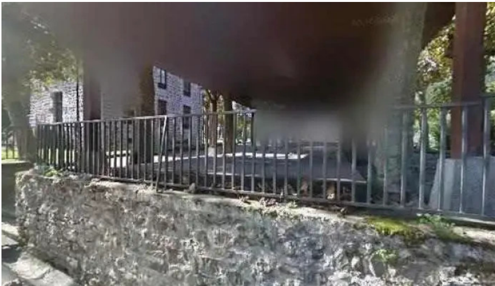
Iglesia de san pedro abierto ahora