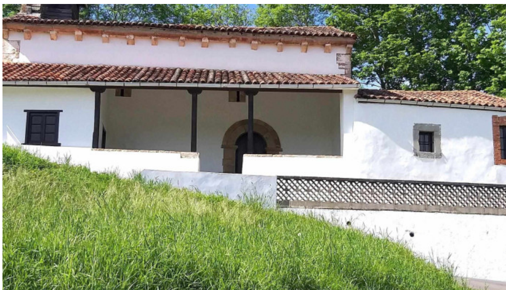
Iglesia de san vicente abierto ahora