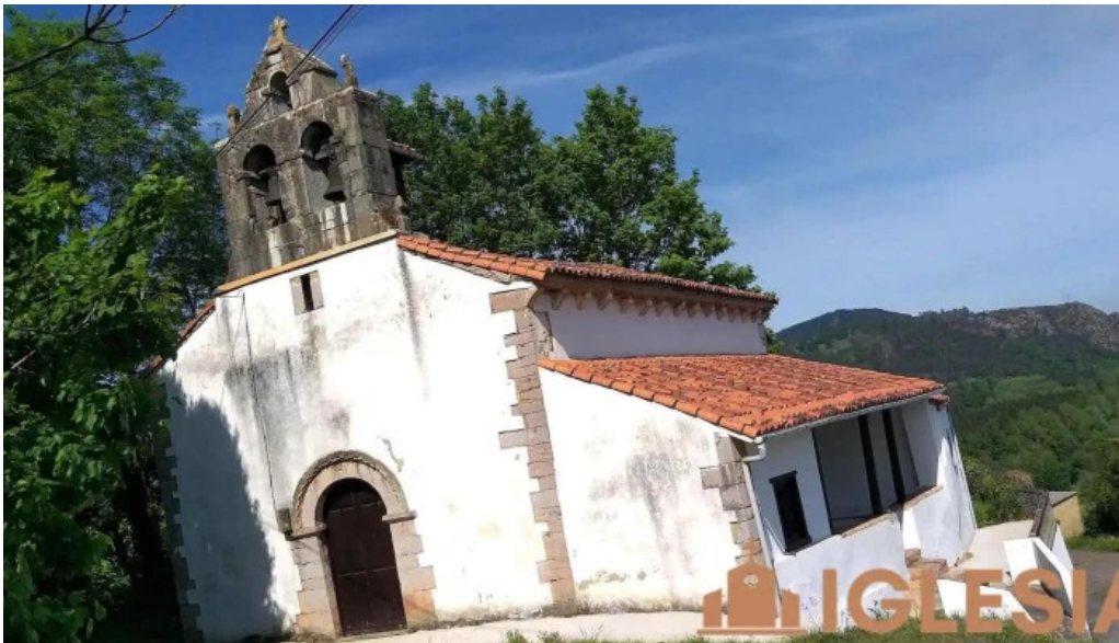
Iglesia de san vicente iglesia catolica