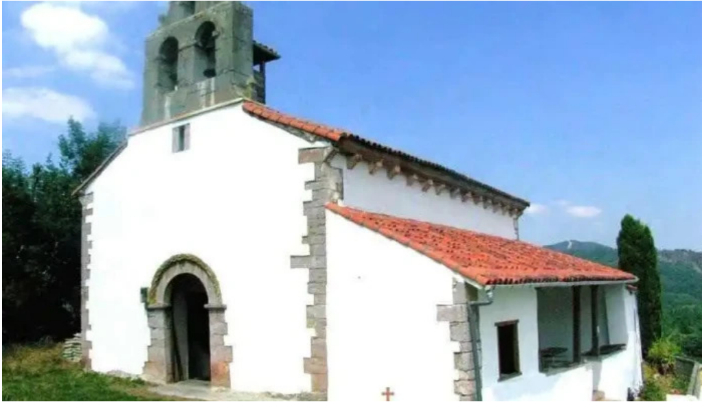
Iglesia de san vicente iglesia