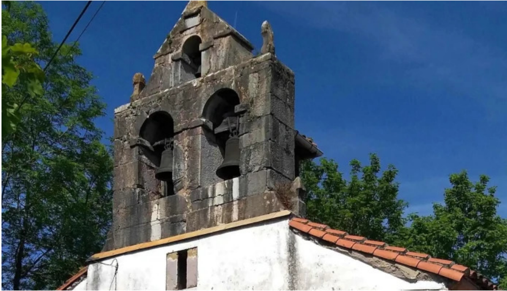
Iglesia de san vicente grado