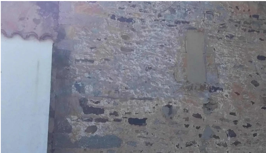
Iglesia de san vicente como llegar