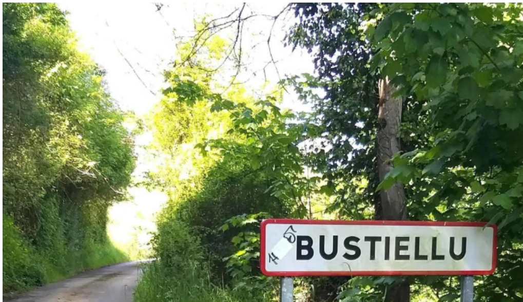
Iglesia de san vicente numero