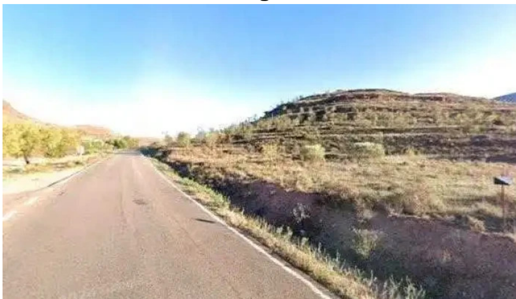
Ermita de santa barbara zaragoza