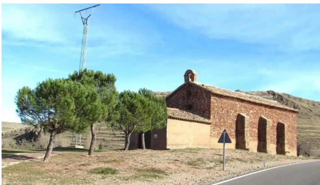
Ermita de santa barbara gotor