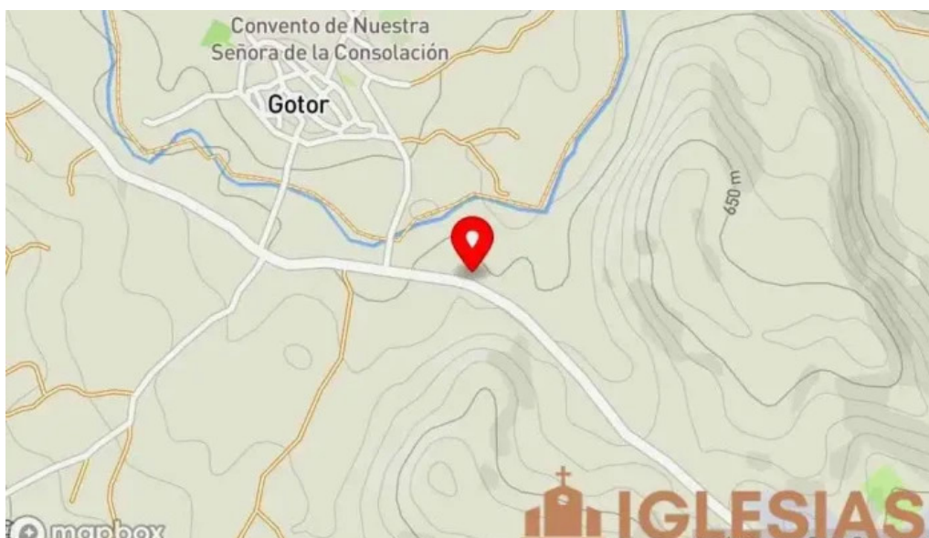
Ermita de santa barbara mapa