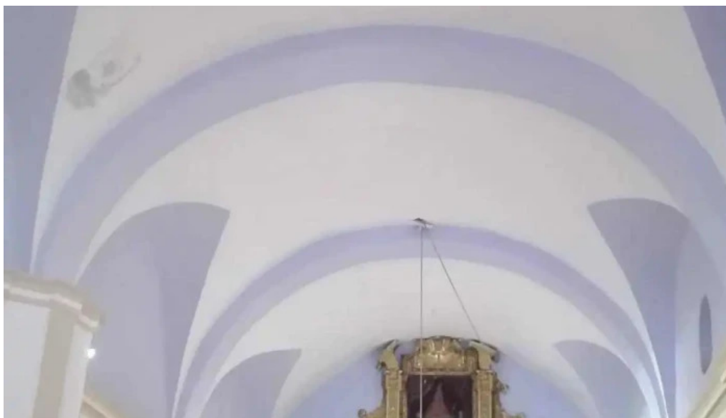
Ermita de santa barbara iglesia