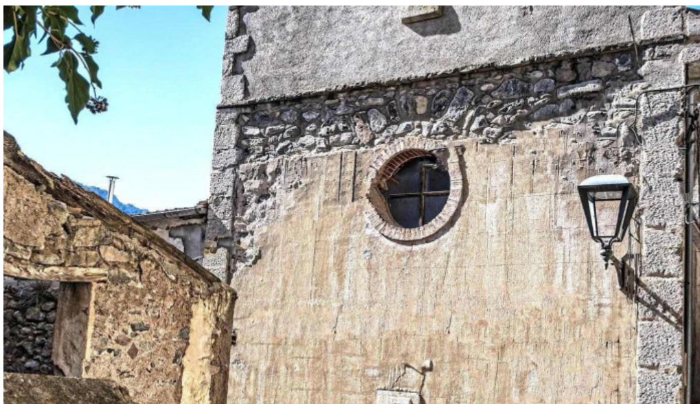
Esglesia sant feliu iglesia catolica