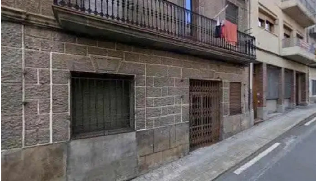
Esglesia sant feliu donde