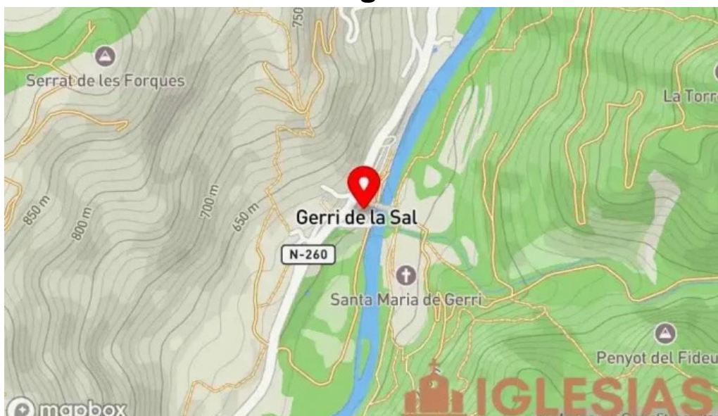
Esglesia sant feliu mapa