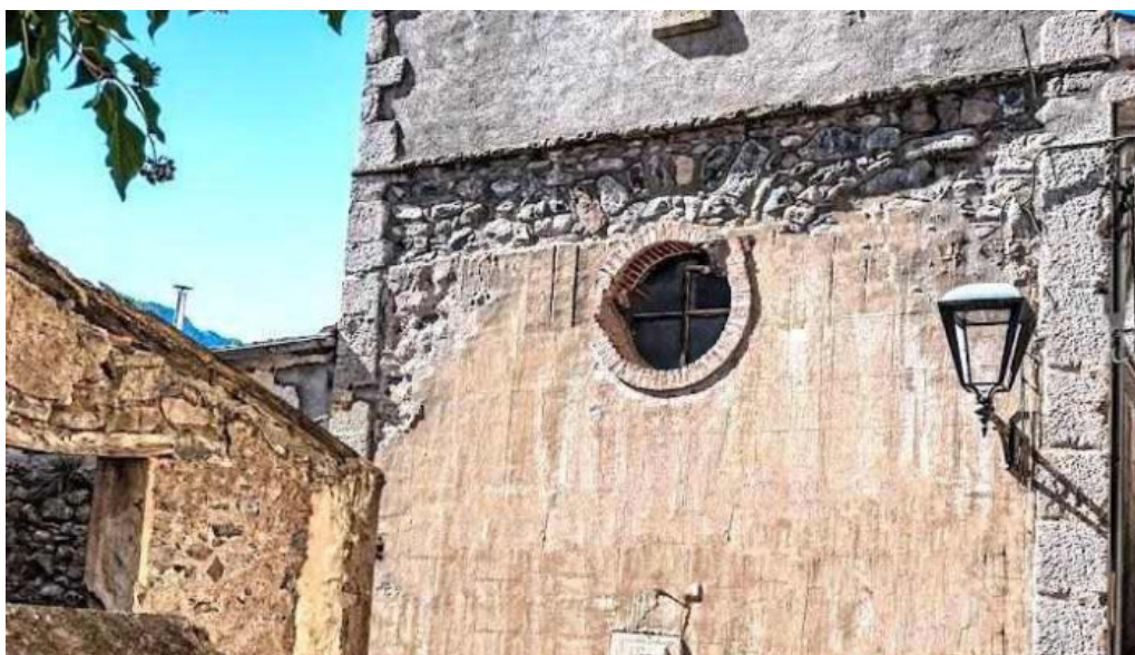
Esglesia sant feliu gerri de la sal