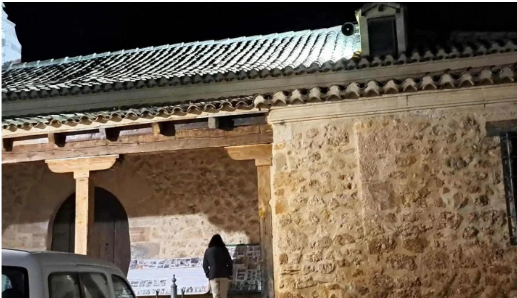
Iglesia de san sebastian garaballa