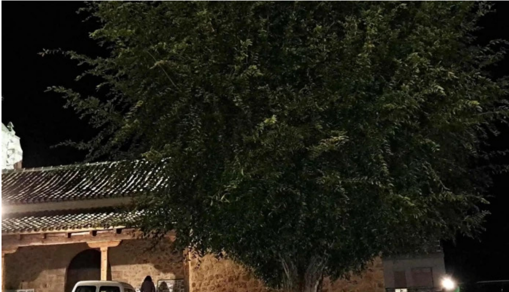
Iglesia de san sebastian catalogo