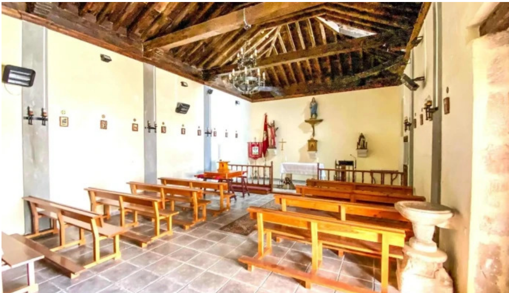
Iglesia de san sebastian iglesia