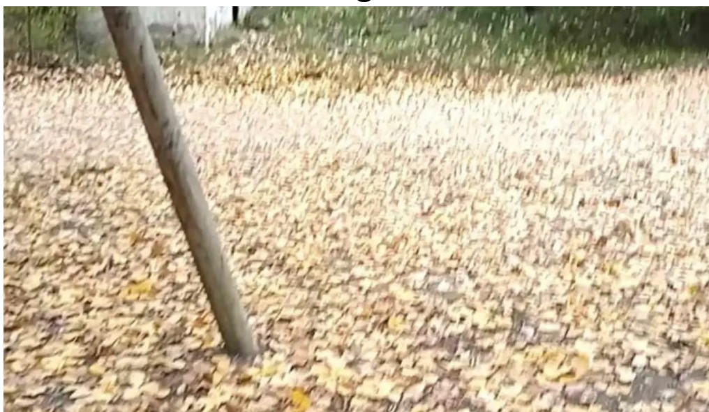
Iglesia de san sebastian videos