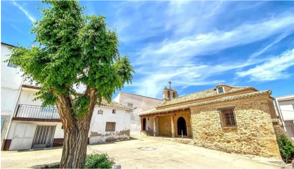
Iglesia de san sebastian iglesia catolica