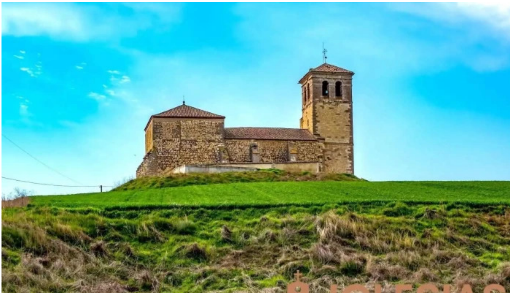
Iglesia de san esteban fuentesecas