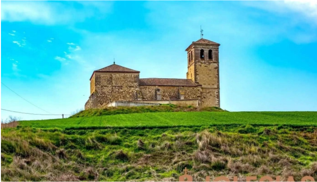
Iglesia de san esteban iglesia catolica