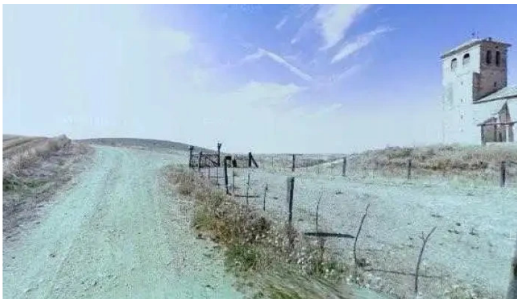
Iglesia de san esteban comentarios