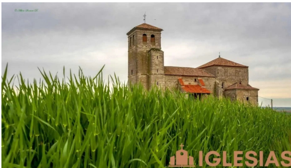
Iglesia de san esteban iglesia