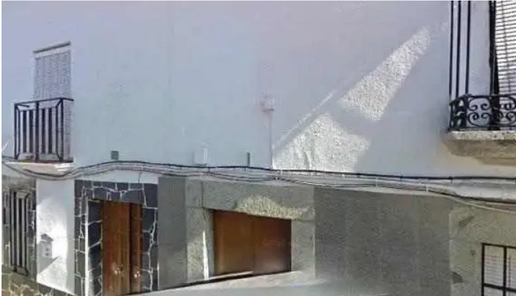
Iglesia de santa catalina comentarios