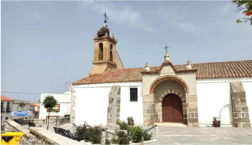
Iglesia de santa catalina iglesia catolica