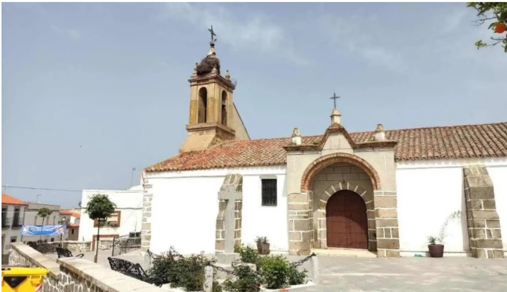
Iglesia de santa catalina fuente la lancha