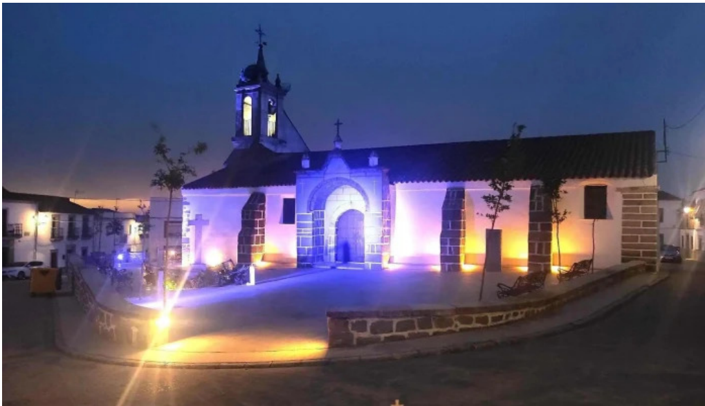
Iglesia de santa catalina iglesia