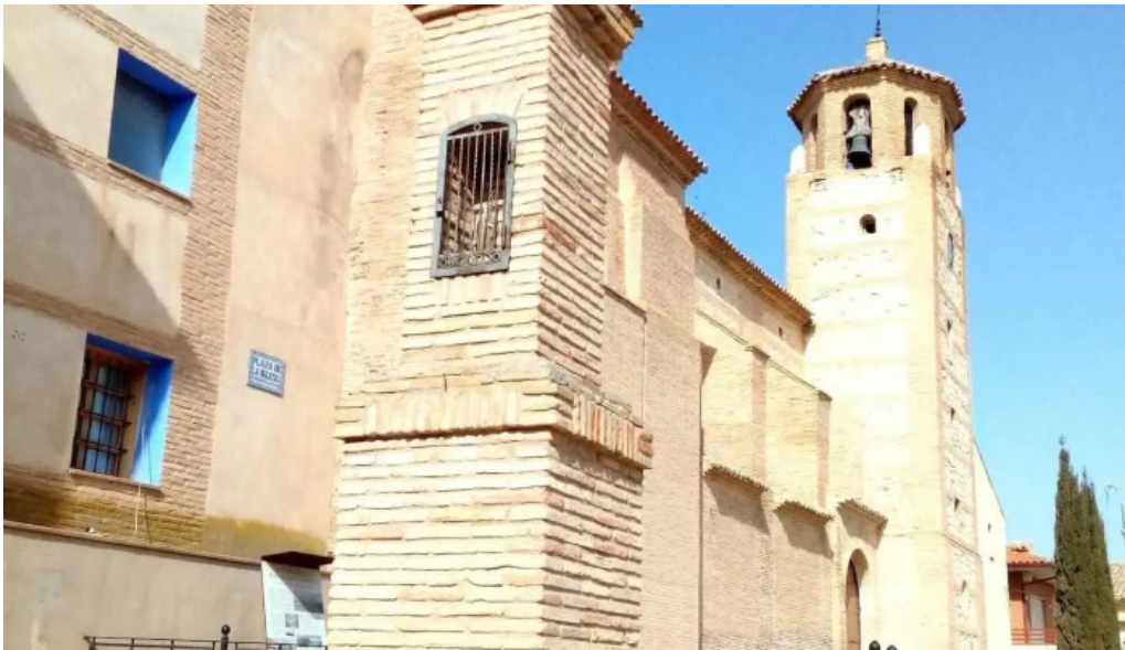
Iglesia parroquial nuestra senora del pilar iglesia catolica