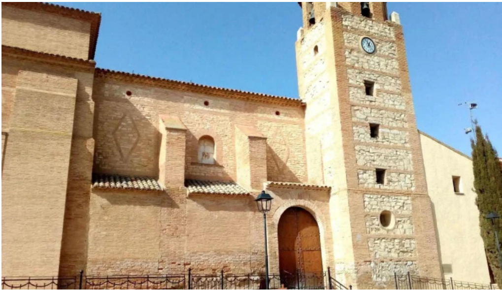
Iglesia parroquial nuestra senora del pilar iglesia