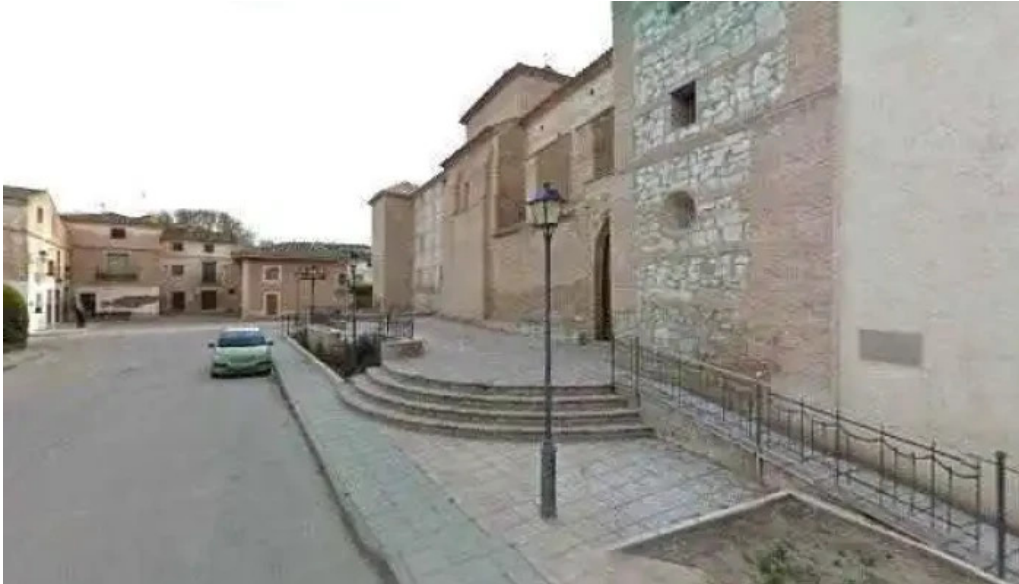
Iglesia parroquial nuestra senora del pilar numero