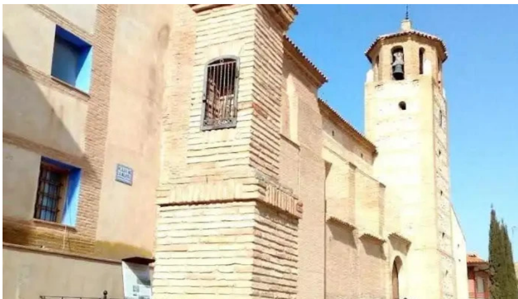
Iglesia parroquial nuestra senora del pilar frescano