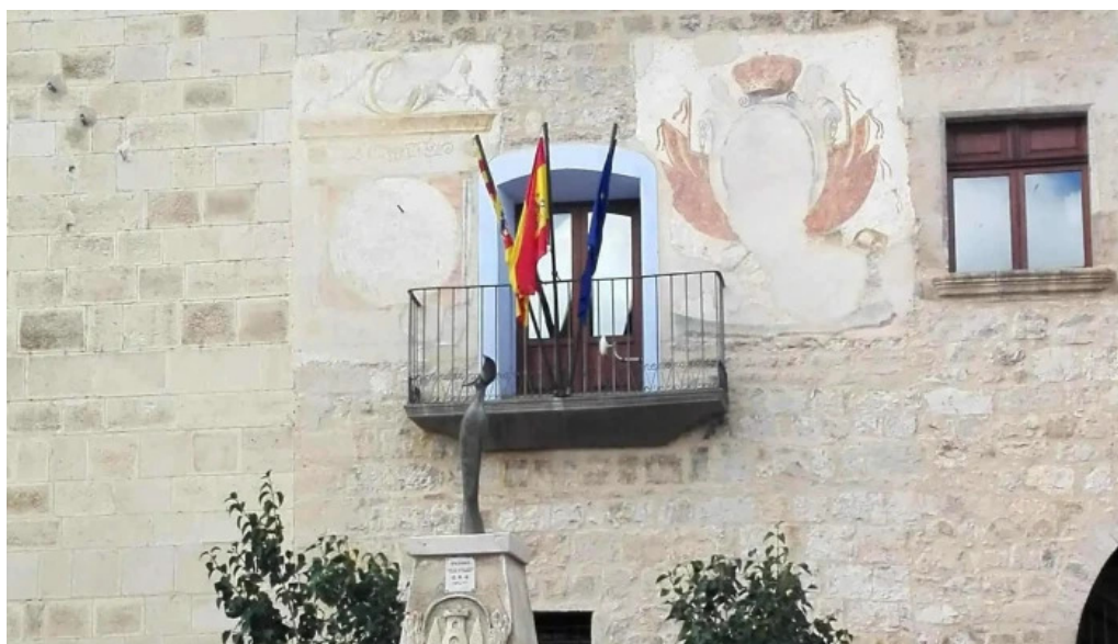
Iglesia de la purificacion fortanete telefono