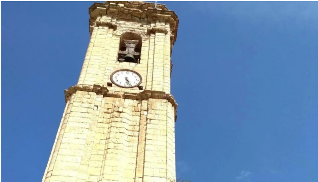
Iglesia de la purificacion fortanete descuentos