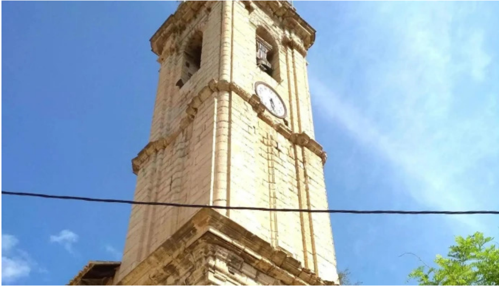
Iglesia de la purificacion fortanete fortanete