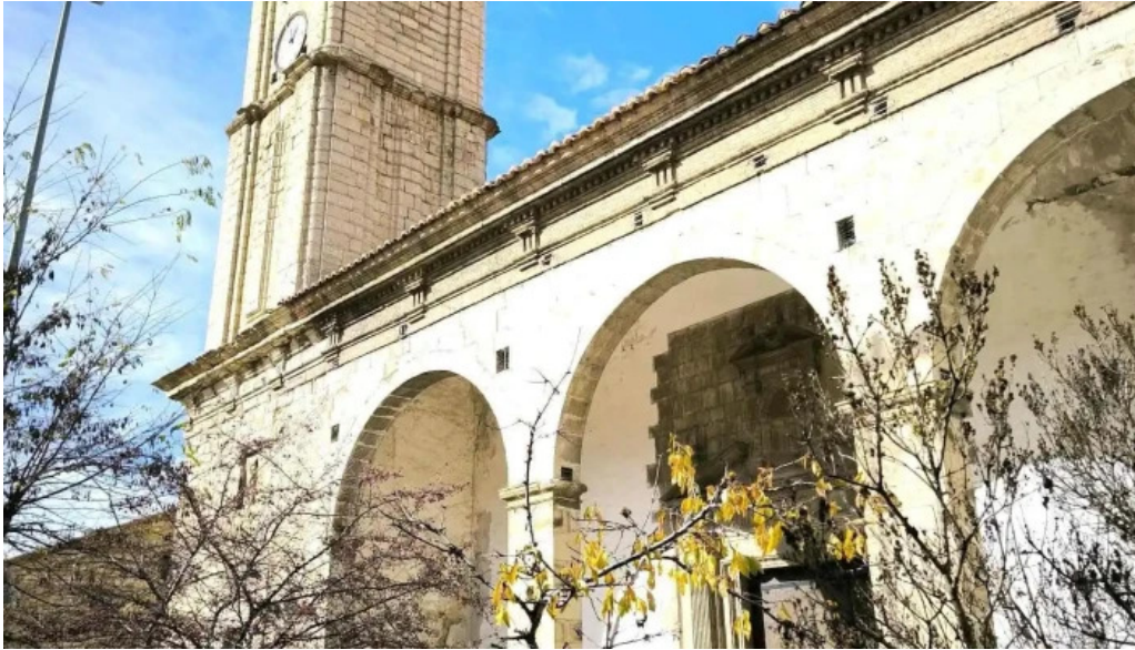
Iglesia de la purificacion fortanete recientes