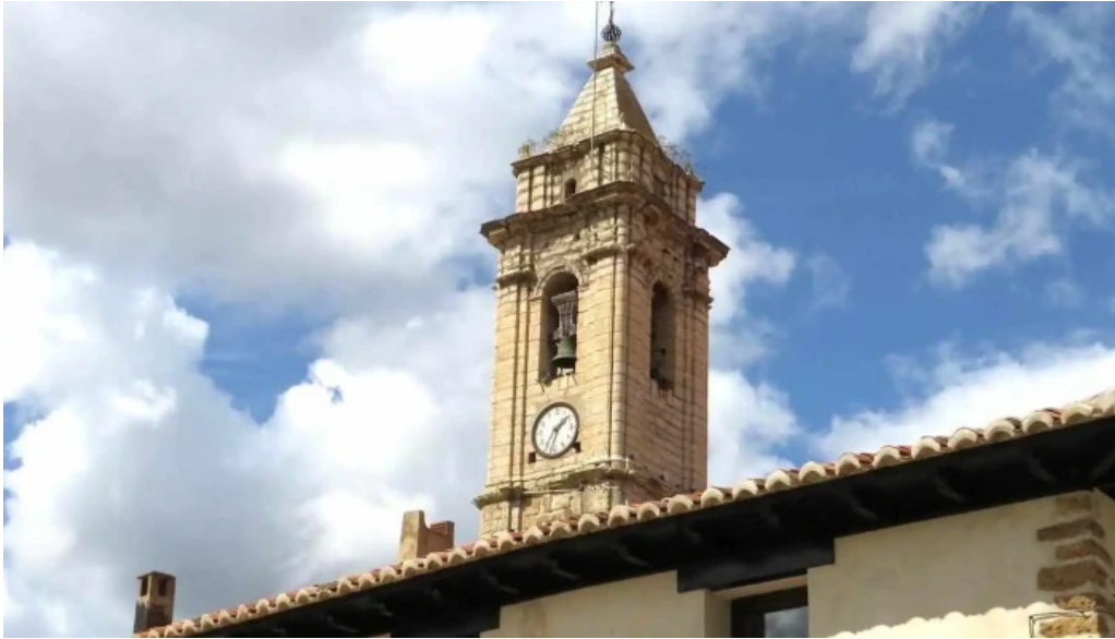
Iglesia de la purificacion fortanete iglesia