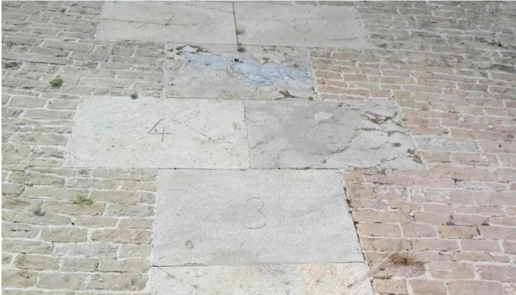
Iglesia de la purificacion fortanete comentarios