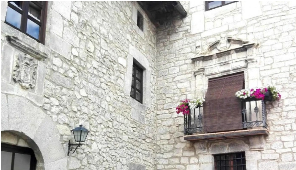
Iglesia de la purificacion fortanete promocion