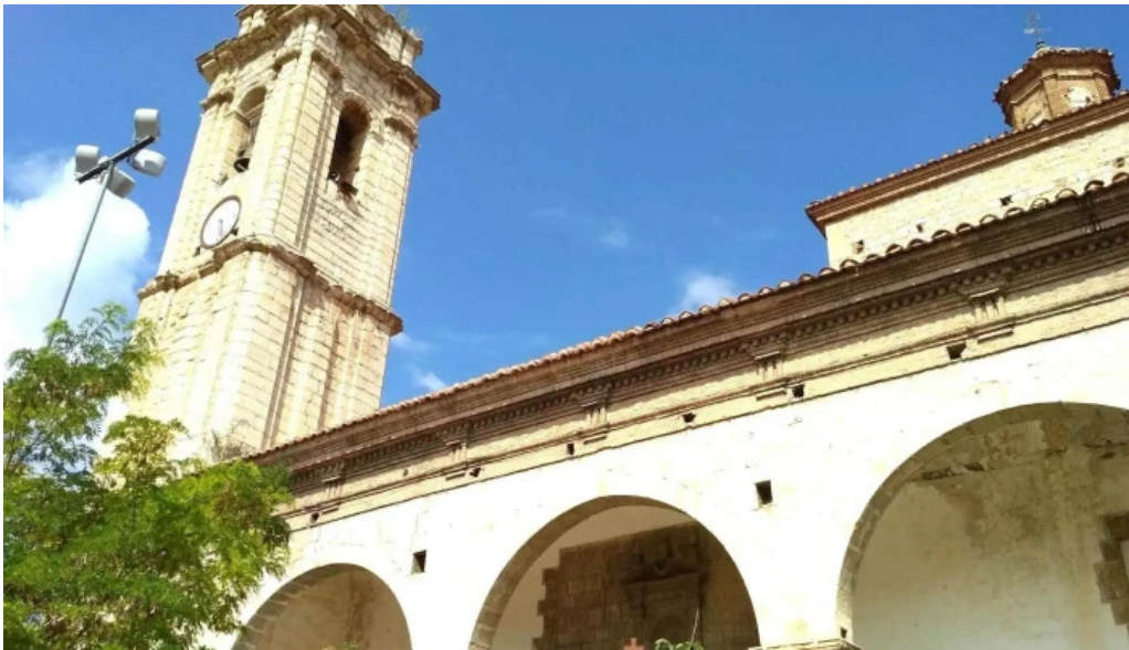
Iglesia de la purificacion fortanete iglesia catolica