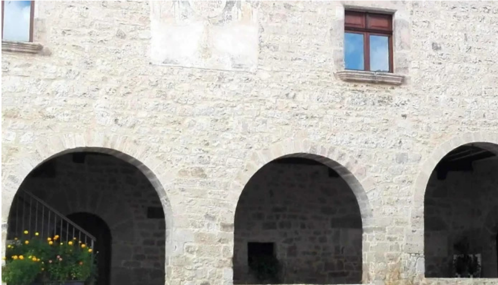
Iglesia de la purificacion fortanete opiniones