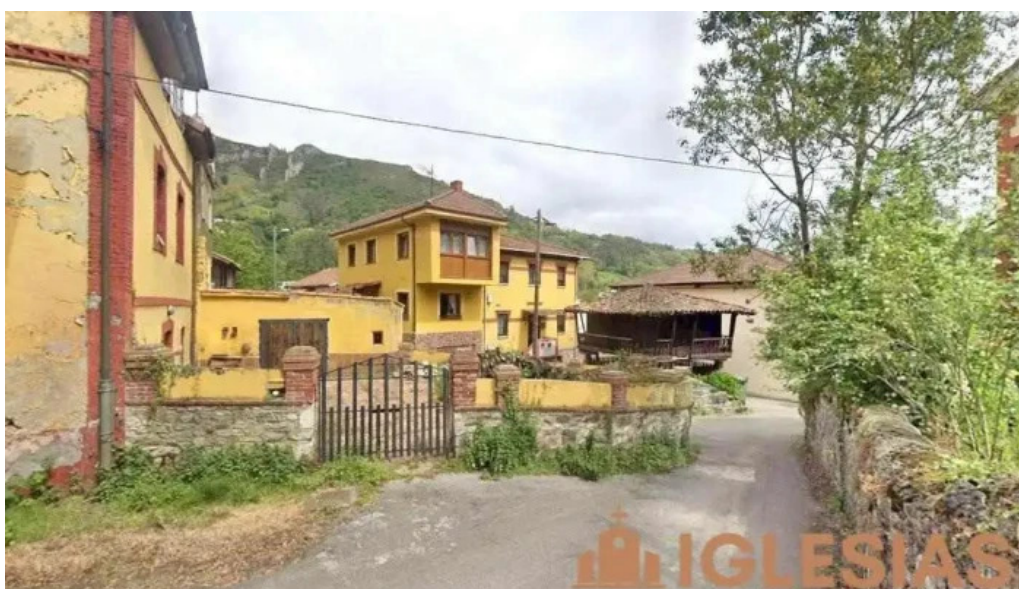
Iglesia de san pedro de lloreo fondos de villa