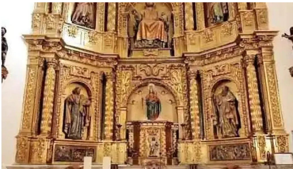
Iglesia de espronceda espronceda