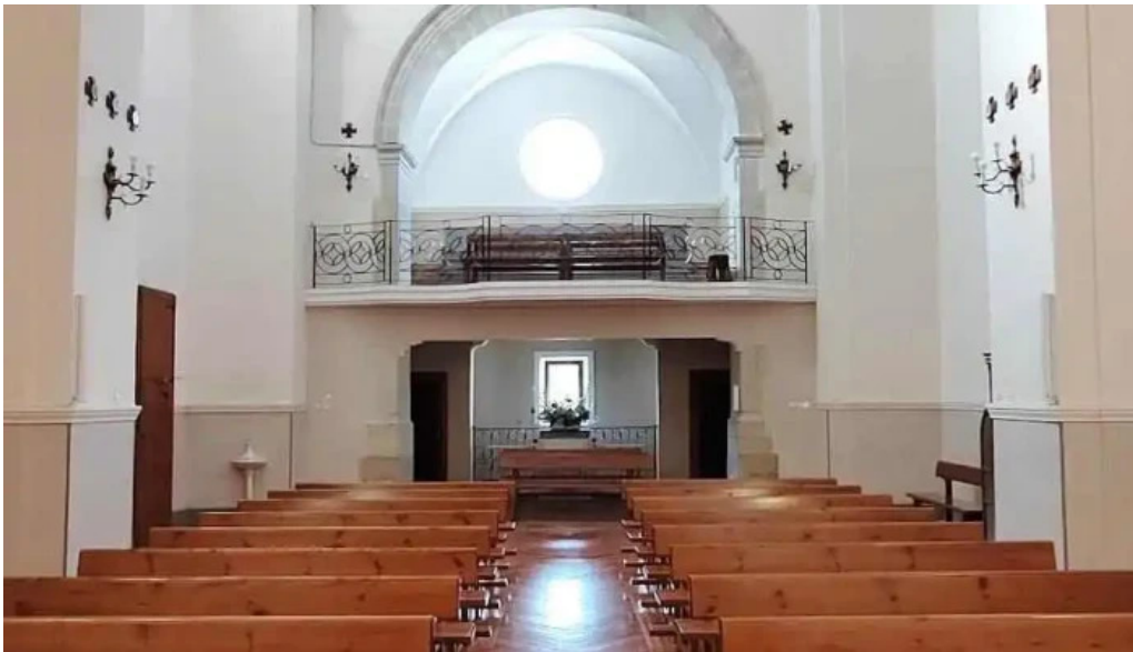
Iglesia de espronceda iglesia