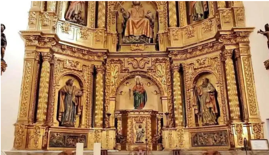
Iglesia de espronceda iglesia catolica