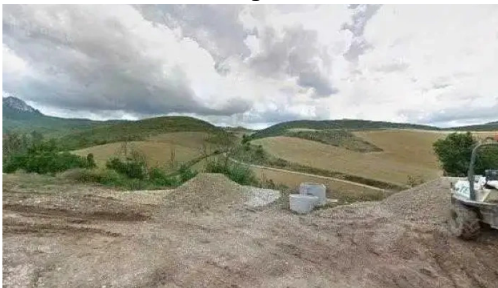
Iglesia de espronceda videos