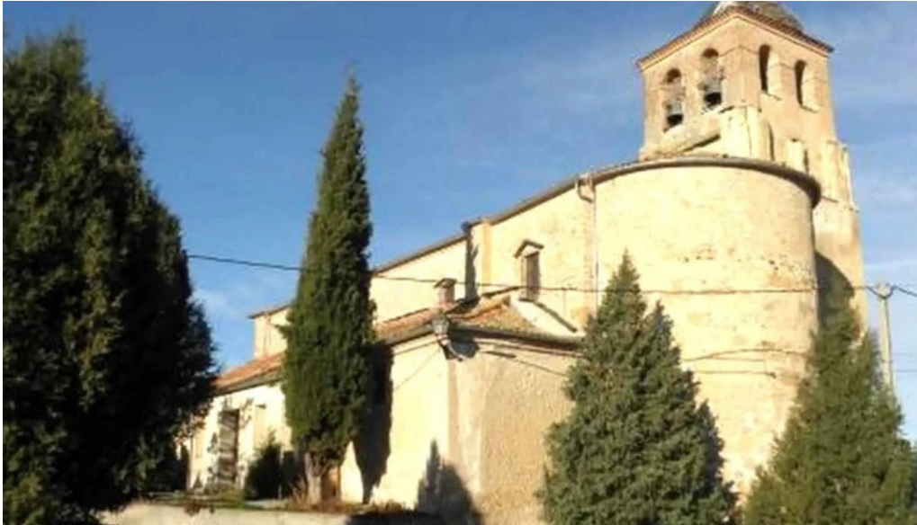
Iglesia de san nicolas de bari escobar de polendos