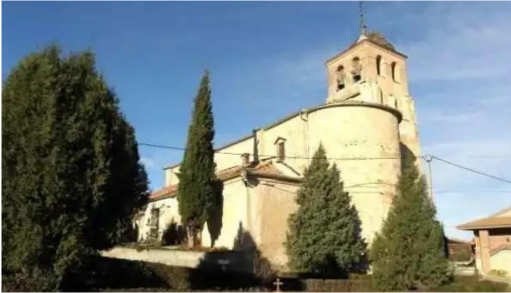
Iglesia de san nicolas de bari iglesia