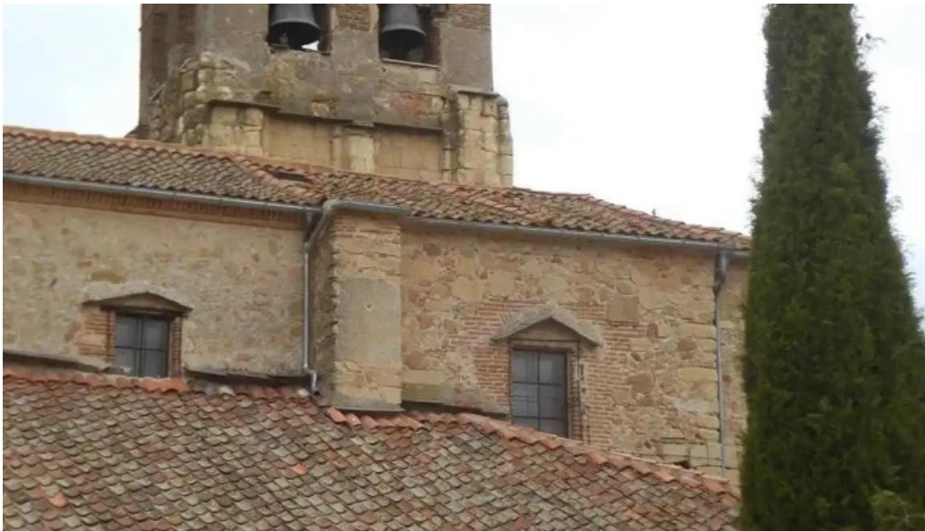
Iglesia de san nicolas de bari iglesia catolica